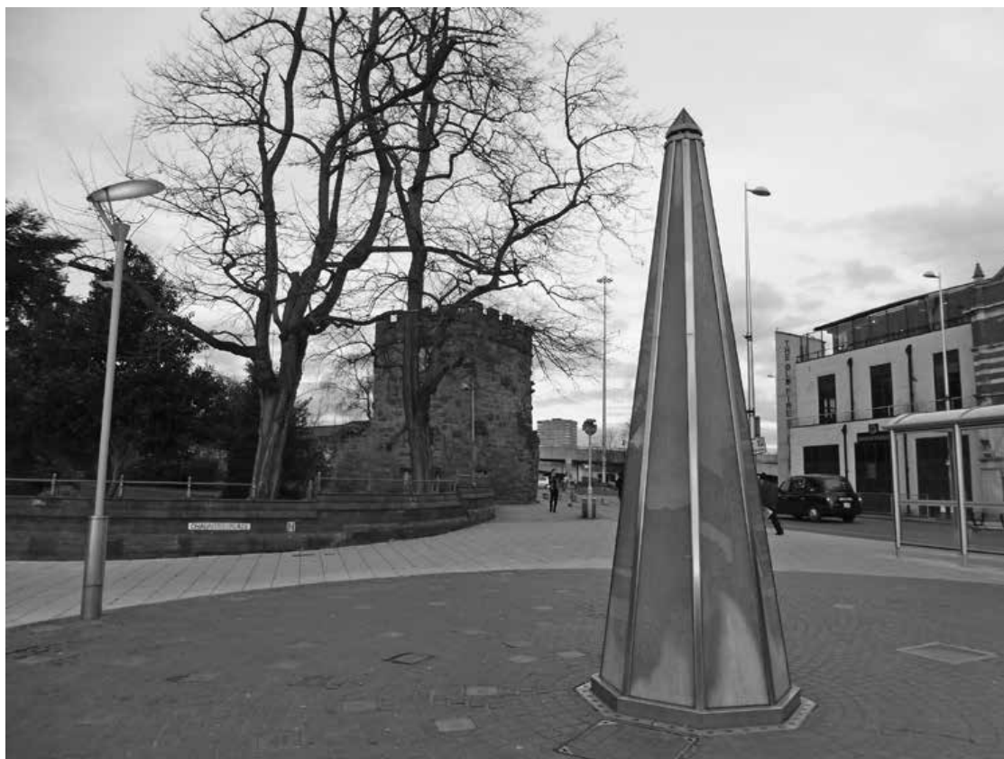
6. Jochen Gertz, „Monument przyszłości”, Coventry

(„Publiczna ławka”). Usytuowane zostały w nowo wykreowanej otwartej przestrzeni, nazwanej Millenium Place (Miejsce Milenijne), stanowiącej epicentrum rewitalizowanego terenu. Obie prace, zgodnie ze strategią ustanowioną przez Phoenix Initiative Public Art Strategy, są powiązane ze swym fizycznym miejscem, z jego oświetleniem, rzeźbą i urbanistycznym designem.