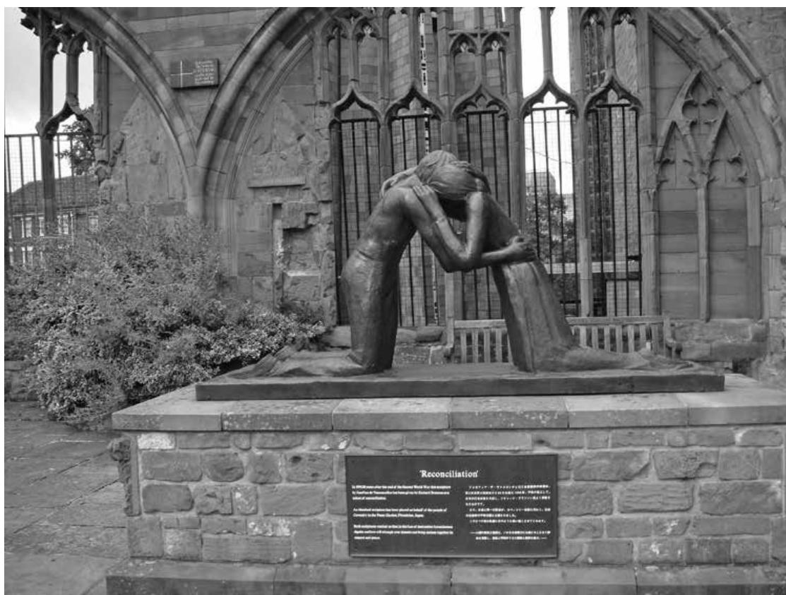
3. Josefinê de Vasconcellos, „Pojednanie”, Coventry

skiego, Josephine de Vasconcellos (1904–2005). Praca powstała w roku 1977, restaurowana była w 1994, a rok później, w 50. rocznicę zakończenia II wojny światowej, dwa odlewy z brązu zostały umieszczone w ruinach katedry Coventry 10 i w Parku Pokoju w Hiroszynie. Przedstawia dwie klęczące naprzeciw siebie postacie z brązu, męską i kobiecą, złączone głowami i ramionami w uścisku pojednania. Ich głowy tworzą szczytowy punkt kompozycji rzeźbiarskiej, współgrającej z ostrołukami gotyckich ruin, przy których spoczywa. Bazę pomnika stanowi długi, prostokątny postument z czerwonego piaskowca. Rzeźba, przemawiająca realistyczną, sentymentalną figuracją i gestem zrozumiałym dla masowego odbiorcy, ma symbolizować akt przebaczenia i pojednania. Wzbudza uznanie tych zwiedzających, którym idea rekoncylacji jest bliska, niezależnie od wyznawanej wiary czy orientacji ideologicznej.