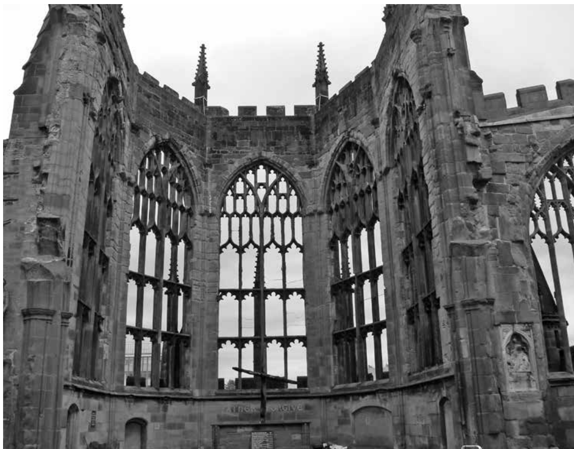
1. Wypalone mury sanktuarium katedry św. Michała, Coventry

dowanego w XIV wieku sanktuarium. Drugi krzyż utworzył ksiądz Arthur Wales, wikary lokalnego kościoła, łącząc drutem w jedną całość trzy wielkie gwoździe, których sporo leżało na rumowisku. Ów krzyż z gwoździ stał się znakiem wojennego Coventry, a także symbolem Kościoła anglikańskiego działającego na rzecz wybaczenia, pokoju i pojednania narodów 5 .