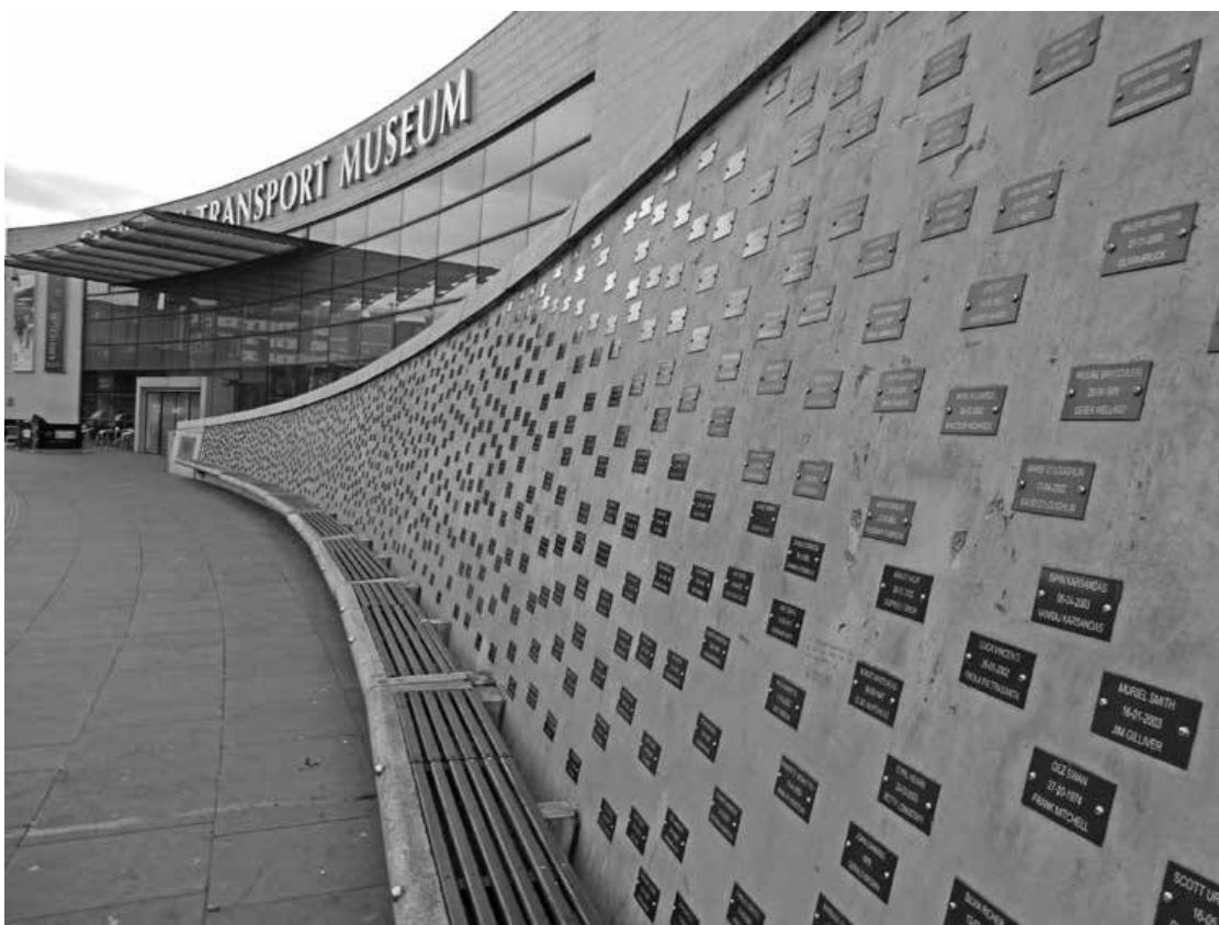
5. Jochen Gertz, „Publiczna ławka”, Coventry

dry obok ruin jej zbombardowanej, średniowiecznej poprzedniczki, a strategię dla sztuki publicznej sformułowała Vivien Lovell, światowy autorytet w tej dziedzinie, proponując jako podstawę projektu