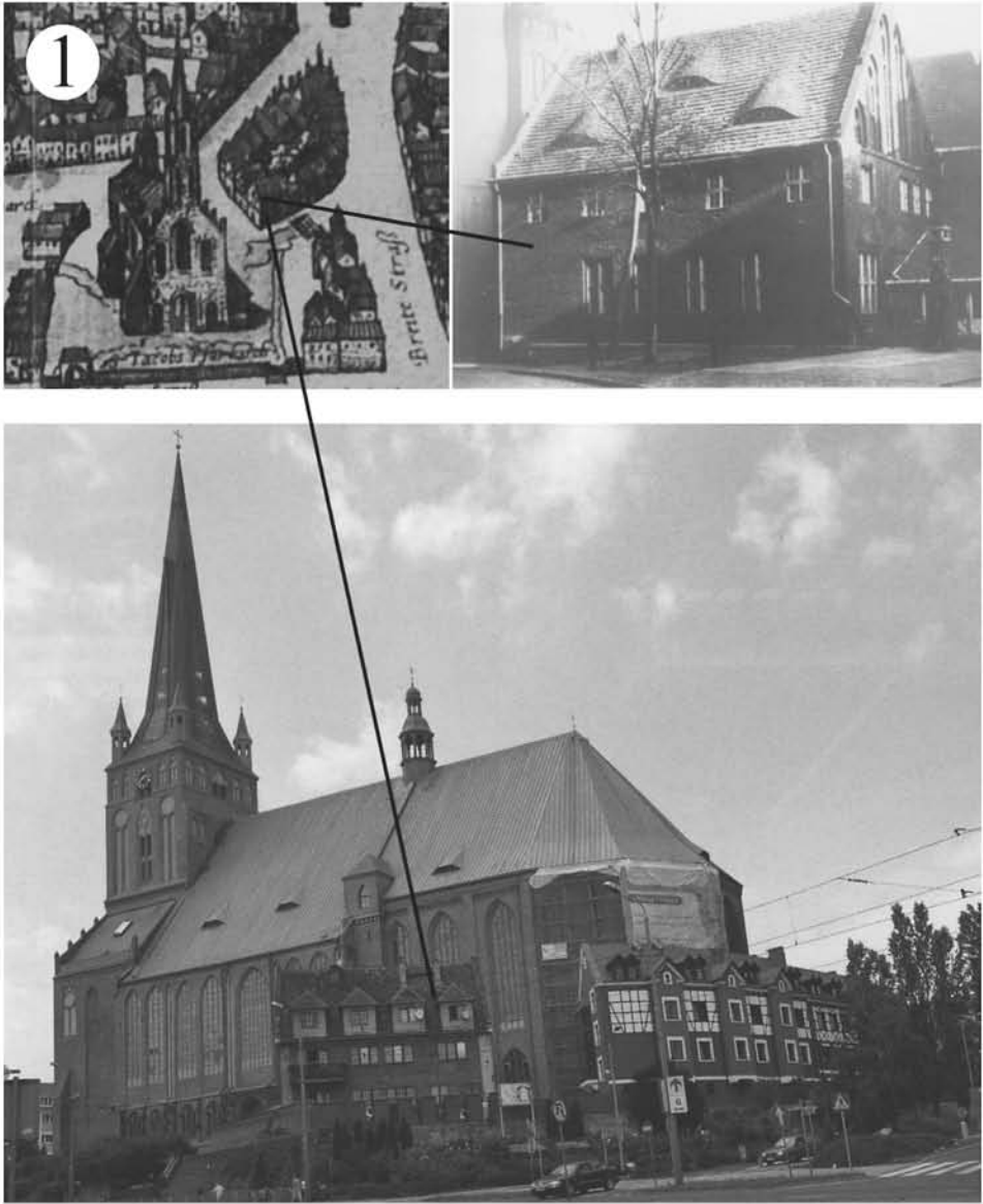
Ryc. 3. Kościół św. Jakuba od strony południowej, widok obecny, u góry Dom Przeora Fig. 3. St James' church from the south side, current view, at the top Prior's House