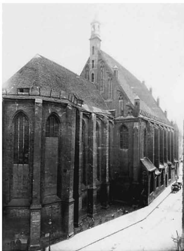
Ryc. 4. Kościół św. Jana Ewangelisty (dawniej św. Jana Chrzciciela) w 1905 roku. Zbiory Muzeum Narodowego w Szczecinie (Foto/4918)