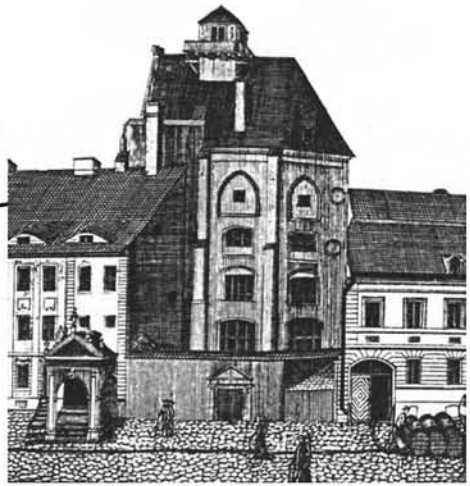
Ryc. 6. Budynek liceum miejskiego w początkach XIX wieku w dawnej siedzibie zakonu karmelitów na sztychu F.L. Kirchhofa. Zbiory Muzeum Narodowego w Szczecinie Fig. 6. Building of the municipal high school in the early 19th century in the former seat of the Order of Carmelites on the etching by F.L. Kirchhof. Collection of the National Museum in Szczecin