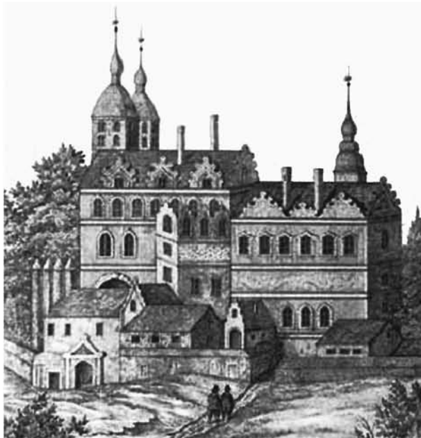
Ryc. 7. Siedziba księżęcia w Oderburgu, dawny klasztor kartuzów z Grabowa, makieta Carla Benjamina Kruse, 1835. Zbiory Muzeum Narodowego w Szczecinie Fig. 7. Ducal residence in Oderburg, former Carthusian monastery in Grabów, a model by Carl Benjamin Kruse, 1835. National Museum in Szczecin