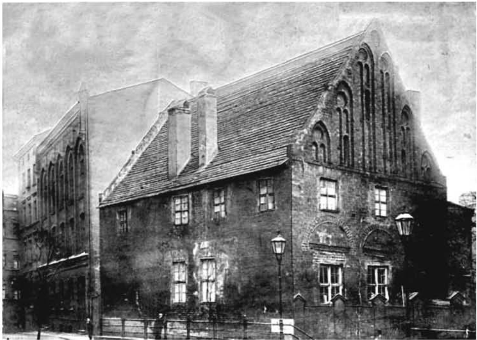
Ryc. 2. Dom Przeora przy kościele św. Jakuba. (PLG-12/1/2578)