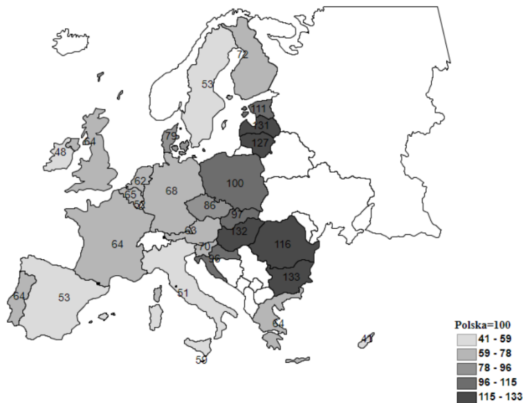
Rysunek 1. Wskaźnik liczby utraconych lat życia w wyniku przedwczesnej śmierci (YLL) na 1 tys. osób w wieku 15-69 lat, 2012 rok, Polska=100