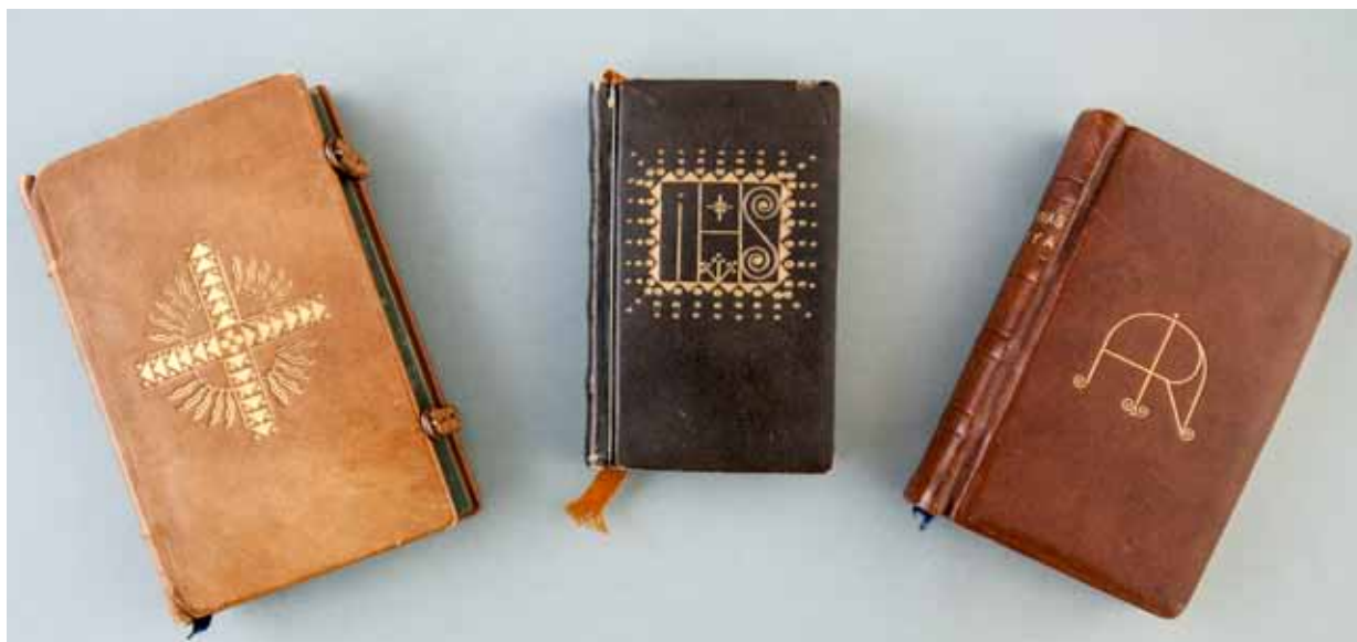
3. Oprawy modlitewników wykonane na kursie dla introligatorów w Muzeum Techniczno-Przemysłowym w Krakowie w 1911 roku: Gertruda Wielka, Bóg moją miłością [...], nr inw. MNK IV-MO-254; Adam Morawski, Anioł Stróż [...], nr inw. MNK IV-MO-265; Józefa Kamocka, Zdrowaś Marya [...], nr inw. MNK IV-MO-256.

3. The covers of the prayer books made at the bookbinding course at the Museum of Technology and Industry in Kraków in 1911: Gertrude the Great, Bóg moją miłością [...] [ God Is My Love... ], inv. no. MNK IV-MO-254; Adam Morawski, Anioł Stróż [...] [ The Guardian Angel... ], inv. no. MNK IV-MO-265; Józefa Kamocka, Zdrowaś Marya [...] [ Hail Mary... ], inv. no. MNK IV-MO-256.