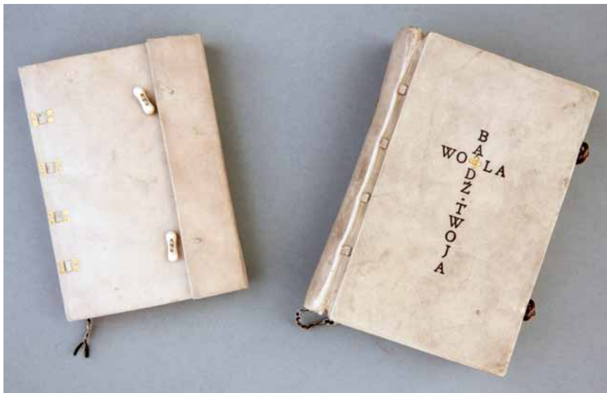
6. Oprawy modlitewników wykonane na kursie dla introligatorów w Muzeum Techniczno-Przemysłowym w Krakowie w 1911 roku: Tomasz à Kempis, O naśladowaniu Jezusa Chrystusa ksiąg czworo [...], nr inw. MNK IV-MO-260; Józefa Kamocka, Bądź wola Twoja [...], nr inw. MNK IV-MO-261; fot. Pracownia Fotograficzna MNK

6. The prayer books made at the bookbinding course at the Museum of Technology and Industry in Kraków in 1911: Thomas à Kempis, O naśladowaniu Jezusa Chrystusa ksiąg czworo [...] [ The Imitation of Christ in Four Books... ], inv. no. MNK IV-MO-260; Józefa Kamocka, Bądź wola Twoja [...] [ Thy Will Be Done... ], inv. no. MNK IV-MO-261; phot. The Photographic Laboratory of the National Museum in Kraków