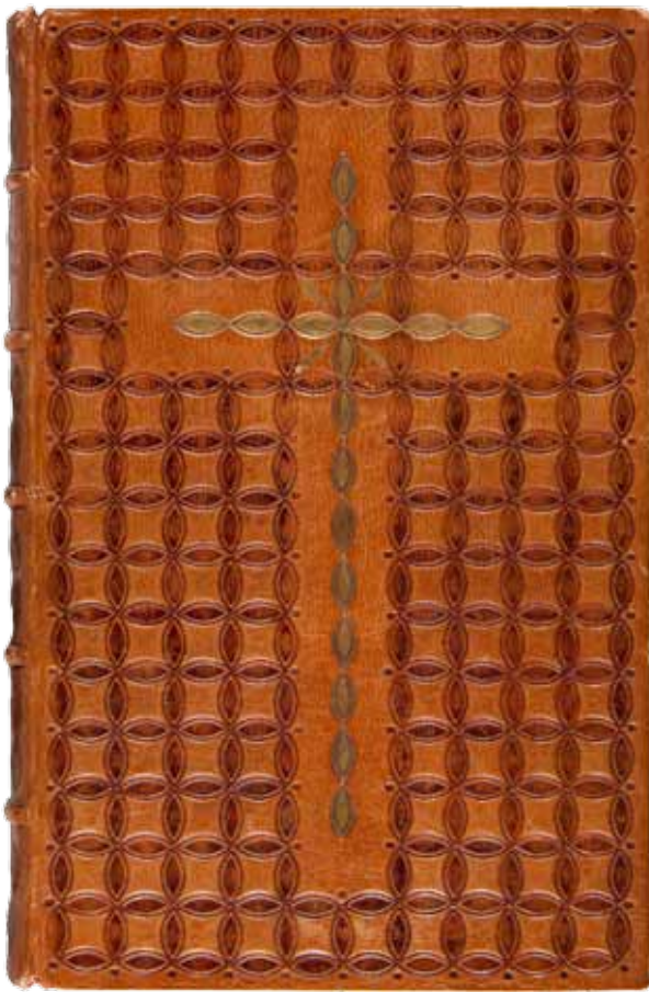
1. Oprawa modlitewnika wykonana na kursie dla introligatorów w Muzeum Techniczno-Przemysłowym w Krakowie w 1911 roku: Klementyna Hoffmanowa, Książka do nabożeństwa dla Polek [...], nr inw. MNK IV-MO-258; fot. Pracownia Fotograficzna MNK

1. The cover of the prayer book made at the bookbinding course at the Museum of Technology and Industry in Kraków in 1911: Klementyna Hoffmanowa, Książka do nabożeństwa dla Polek [...] { A Prayer Book for Polish Women ...}, inv.no. MNK IV-MO-258; phot. The Photographic Laboratory of the National Museum in Kraków