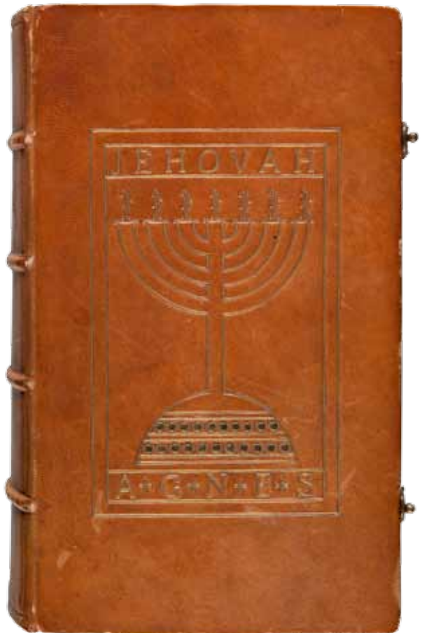
2. Oprawa Biblii wykonana na kursie dla introligatorów w Muzeum Techniczno-Przemysłowym w Krakowie w 1911 roku: Biblia to jest Księgi Starego y Nowego Testamentu [...], Wrocław 1740; nr inw. MNK IV-MO-257, fot. Pracownia Fotograficzna MNK

2. The cover of the Bible made at the bookbinding course at the Museum of Technology and Industry in Kraków in 1911: Biblia to jest Księgi Starego y Nowego Testamentu [...], [The Bible, or the Books of the Old and New Testament...] Wrocław 1740; inv. no. MNK IV-MO-257, phot. The Photographic Laboratory of the National Museum in Kraków