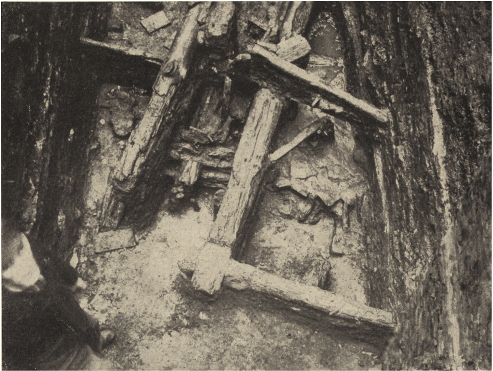
Ryc. 48. Gniezno. Resztki drewnianych budowli z okresu wczesnohistorycznego.

W Kruszwicy odnaleziono ślady grodu piastowskiego na Górze Zamkowej i na przyległym wzgórzu. Początki grodu tego sięgają mogą VIII w. (na razie tylko poszlaki). Najwięcej zabytków pochodzi z XI i XII wieku (ceramika ze znakami garncarskimi). Odślonięto również gotycki budynek i resztki średniowiecznych umocnień podstawy Góry Zamkowej.