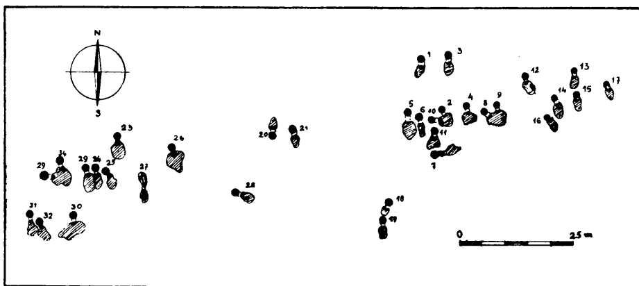
Ryc. 45. Zofipole, pow. Miechów. Rozmieszczenie pieców i jam przypieczowych.

Na Ostrowie Lednickim, pow. Gniezno, stwierdzono w wyniku prac ślady zamieszkiwania w okresie wczesnohistorycznym całej przestrzeni wyspy. Prócz fundamentów świątyni i zamku romańskiego odkopano tu duży wał obronny, zamykający 1/3 jej powierzchni, oraz drugi, silny wał wcześniejszego grodu. Oba wały posiadały tę samą konstrukcję — rusztową. Nad brzegiem jeziora naprzeciw mniejszej wyspy „Ledniczki“, odkryto resztki konstrukcji drewnianych, być może przybrzeżnego wału (ryc. 49).