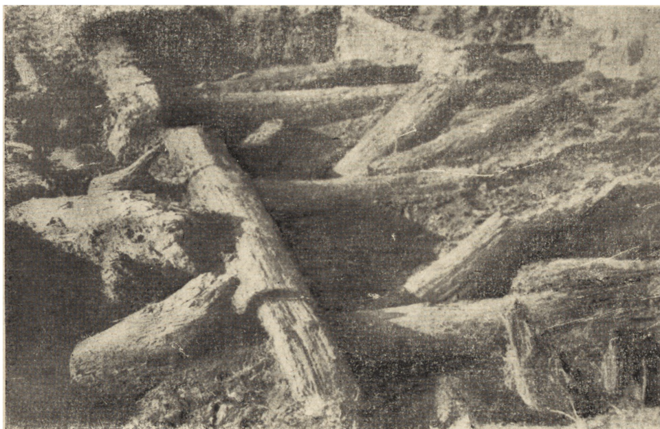
Ryc. 49. Ostrów Lednicki. Drewniana konstrukcja przy brzegu jeziora.

ślady budynku czworobocznego, który został zniwelowany pod budowę innego budynku o konstrukcji plecionkowej, odpowiadającego chronologicznie warstwie młodszej. Znalezione w warstwach zabytki pozwalają datować ten gród na XI i XII wiek.