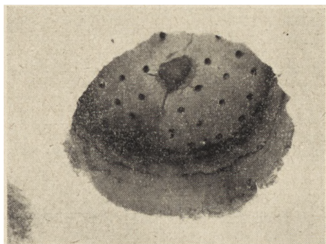
Ryc. 40. Zofipole, pow. Miechów. Ścięta przez orkę kopuła pieca garncarskiego po odpreparowaniu.