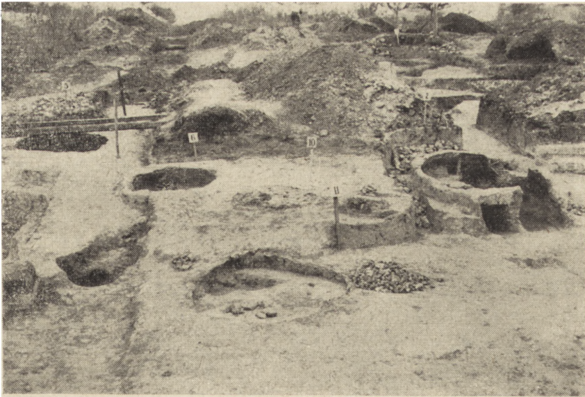
Ryc. 44. Zofipole, pow. Miechów. Widok kilku pieców wielkiej osady garncarskiej z ok. IV—V w. po Chr. w trakcie prac wykopaliskowych

Najbardziej znanym, a bez wątpienia ogromnie dla nauki ważnym stanowiskiem z wczesnej epoki żelaza jest Biskupin w pow. żnińskim. W rezultacie powojennych wykopalisk odkryto na półwyspie Jeziora Biskupińskiego dalszą część zatopionej warowni ludności kultury łużyckiej. Stwierdzono, że w grodzie było 11 ulic poprzecznych i jedna ulica okrężna, potężny wał o konstrukcji skrzyńcowej, częstokół, falochron, droga dojazdowa i brama (w innym miejscu, niż dotychczas przypuszczano). Wzdłuż ulic stały domy drewniane ze ścianami konstrukcji sumikowo-łatkowej, ściśle przylegające do siebie i okryte jednym długim dachem (ryc. 43). Postępujące zawilgocenie zmusiło mieszkańców parokrotnie do podwyższania podłóg domostw, ulic i wału. Uzyskany z badań olbrzymi materiał zabytkowy (kilkaset tysięcy okazów!) pozwala na dokładne odtworzenia