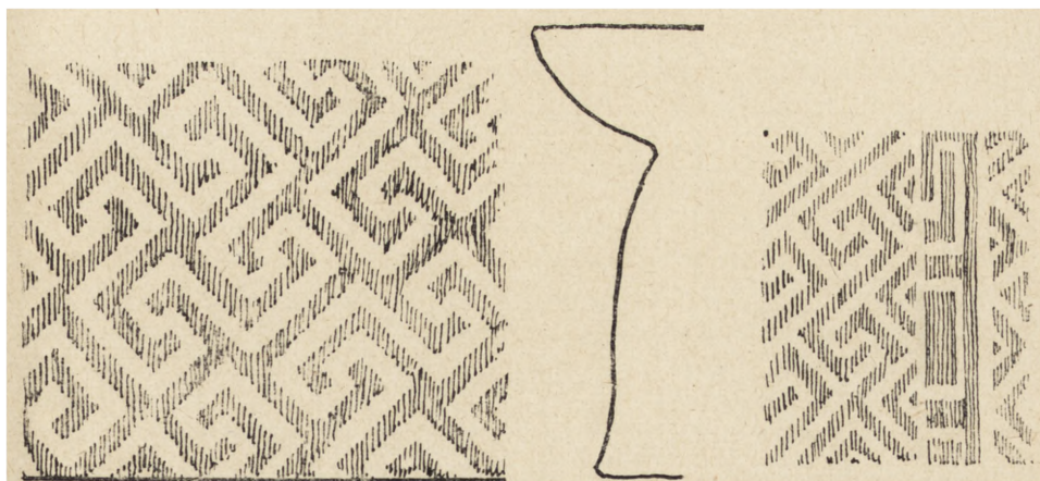
Ryc. 46 i 47. Zofipole. Rozwinięte i częściowo zrekonstruowane motywy zdobnicze na naczyniach neolitycznych.

W Poznaniu, na Ostrowie Tumskim, badania odsłoniły fragmenty grodu z drugiej połowy X wieku. Gród ten posiadał kształt owalny, obwiedziony był wałem drewnianym o konstrukcji przekładkowej i kamienną „ławą“ o szerokości 6 m. Obejmował on niewielką przestrzeń mieszkalną (100 > 60 m), natomiast podgrodzie było znacznie większe. Znalaziono wiele różnorodnych zabytków, szczególnie ceramiki, narzędzi kościanych, ozdób z szkliska itp.