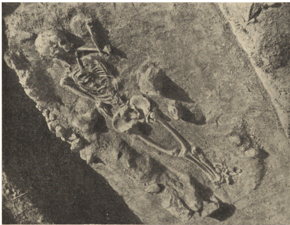
Ryc. 42. Las Stocki, pow. Puławy. Grób szkieletowy kultury pucharów lejowatych. (Fot. S. Nosek).

W Ćmielowie, pow. Opatów, w sąsiedztwie wielkiej neolitycznej kopalni krzemienia, leżącej na terenie wsi Krzemionki, rozkopana została osada