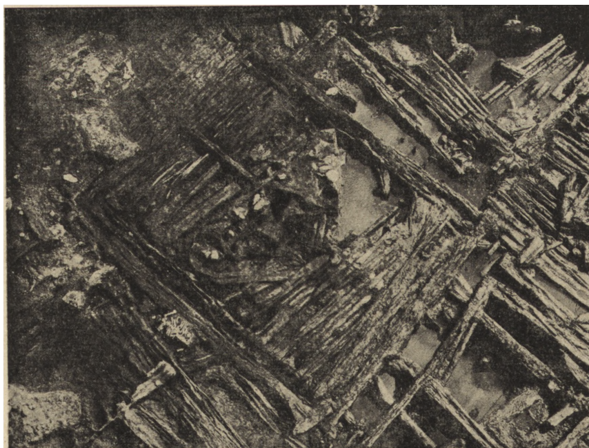
Ryc. 50. Gdańsk. Fragment odsłoniętych resztek domostw osady wczesnohistorycznej.

W Sobótce, na Śląsku, we wnętrzu dawnego kościoła parafialnego odkryto fundamenty założenia kościoła romańskiego i gotyckiego oraz wątków