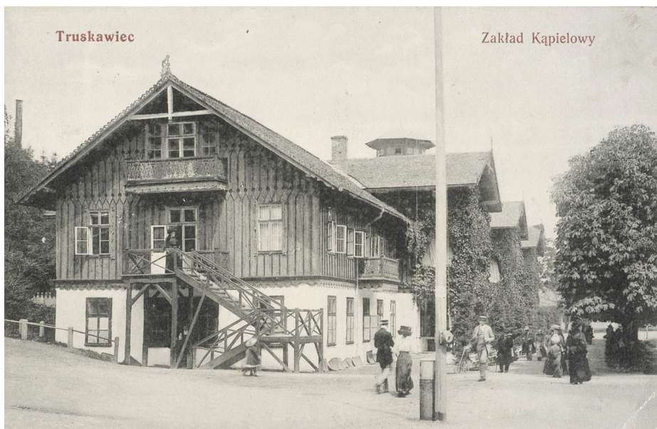
Fot. 3. Truskawiec