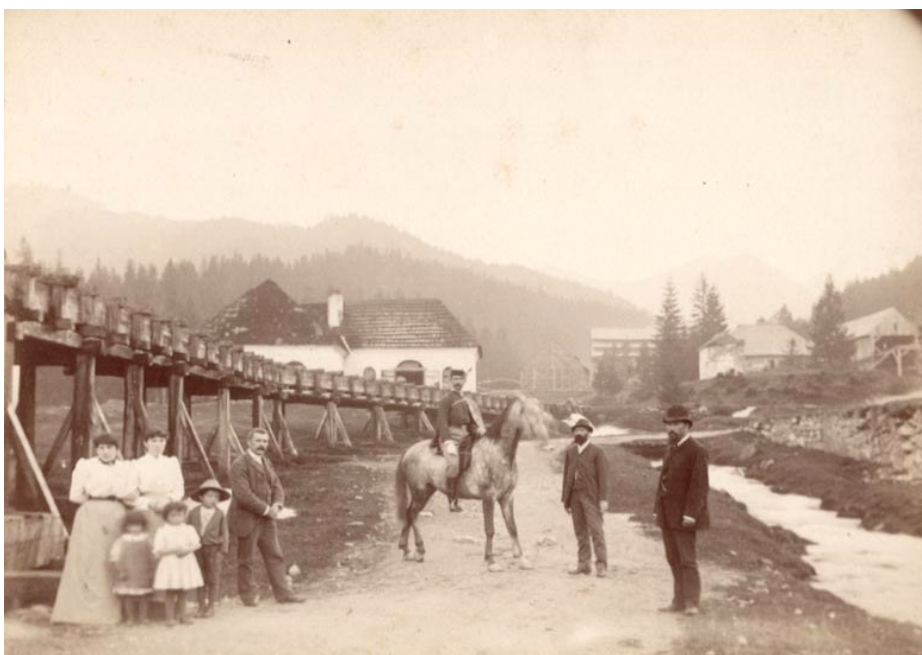
Fot. 4. Przechadzka do kuźnic