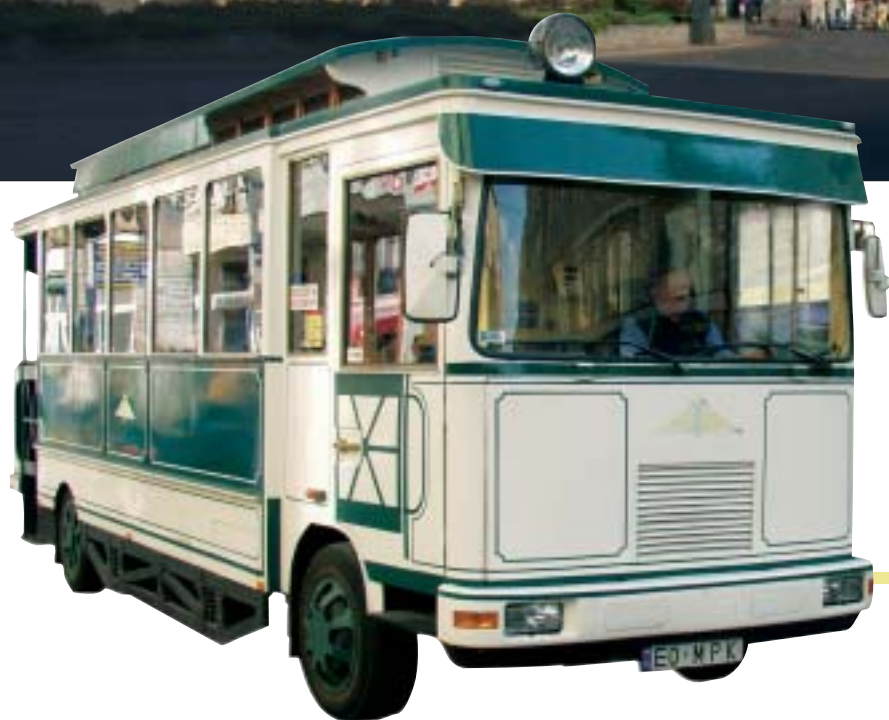
12. Specjalny autobus ułatwiający zwiedzanie miasta.