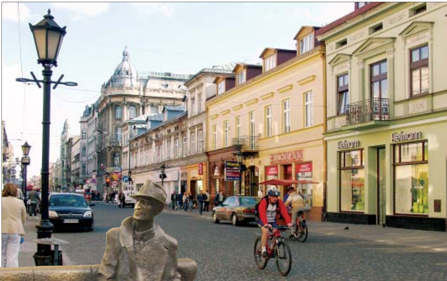
1. Ulica Piotrkowska.

wszystkim pamiątka po dawnych mieszkańcach i ich kulturze” 1 . Miasto, po którym dziś poruszają się ludzie, różni się od miasta wczorajszego; jego elementy nie mają stałego położenia – przesuwały się, chowały, znów się pokazują. Oto gdzieś wyrasta cerkiew z kopułą; pewnego dnia z szyldów znika cyrylica i ukazuje się alfabet łaciński; oto katolicy przejmują kościół zbudowany przed wielu laty wysiłkiem protestanckiej społeczności; oto na miejscu żydowskiego cmentarza postawiono bloki mieszkalne i wytyczono ulice. Z cokołu na rynku zrzucano figurę i znów, już po raz trzeci w ciągu dekady, zmieniono nazwy kilku ulic; z powodu poszerzania jezdni i budowania przejścia podziemnego zburzono stojące od ponad stu lat