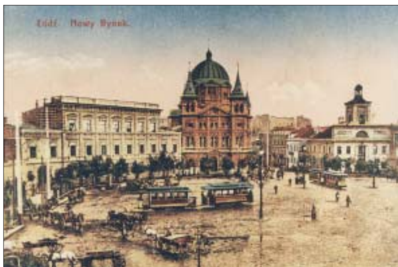
9. Rynek Nowego Miasta. 9. New Town Market Square.

linii frontu II wojny światowej. Miastu obce są zatem – tak charakterystyczne dla Warszawy czy Berlina – ruiny, zgliszcza, rumowiska potwierdzające stan rozkładu, destrukcję. Historycy przypuszczają, że Niemcy obawiali się zniszczenia miasta, które – wraz ze znajdującymi się tu fabrykami i zapasami surowców – miało stać się cennym łupem wojennym 8 . Niemcy poważnie zmienili wygląd Bałut, dzielnicy robotniczej i żydowskiej biedoty, urządzając na jej obszarze getto o powierzchni 4 km 2 . Zarówno przy budowie getta, jak i podczas jego likwidacji, wiele budynków wyburzyli, dużo też uległo zniszczeniu 9 .