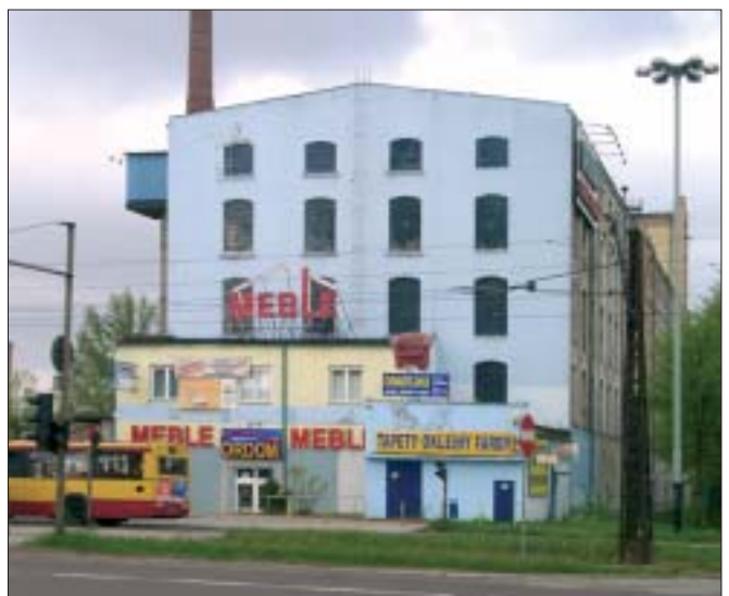
19. Prywatne firmy w fabryce Teodora Steigerta. Fot. G. E. Karpińska, 2005 r.

18. The K. Scheibler factory, porter's house at the New Weaving Mill in Kilińskiego Street. Photo: G. E. Karpińska, 2005.