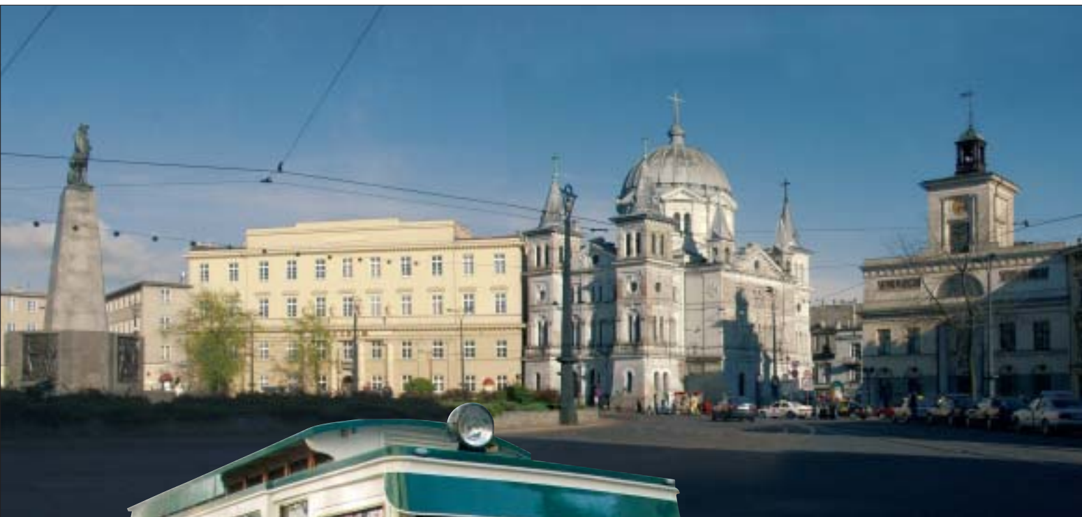
11. Plac Wolności, dawniej Rynek Nowego Miasta.