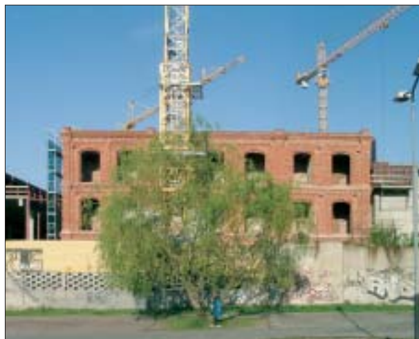
23. Fabryka I. Poznańskiego. Wykańczalnia w czasie renowacji. 2005 r.

W efekcie właśnie takie adaptacje utrzymują intymną więź z historią i chronią wielokulturowość miasta. Po pierwsze, pomagają „odzyskać” jego głębsze warstwy. Budowle poprzez odnowione fasady i ich detale nawiązują do dawnych form architektury, a ludzka pamięć i wyobraźnia wspierają i wiążą „porozrzucane w realnej przestrzeni elementy świata, który na powierzchni przestał istnieć” 23 . Po drugie, umacniają więź mieszkańców nie tylko z miejscem, ale i z miastem. Po trzecie wreszcie, w takim