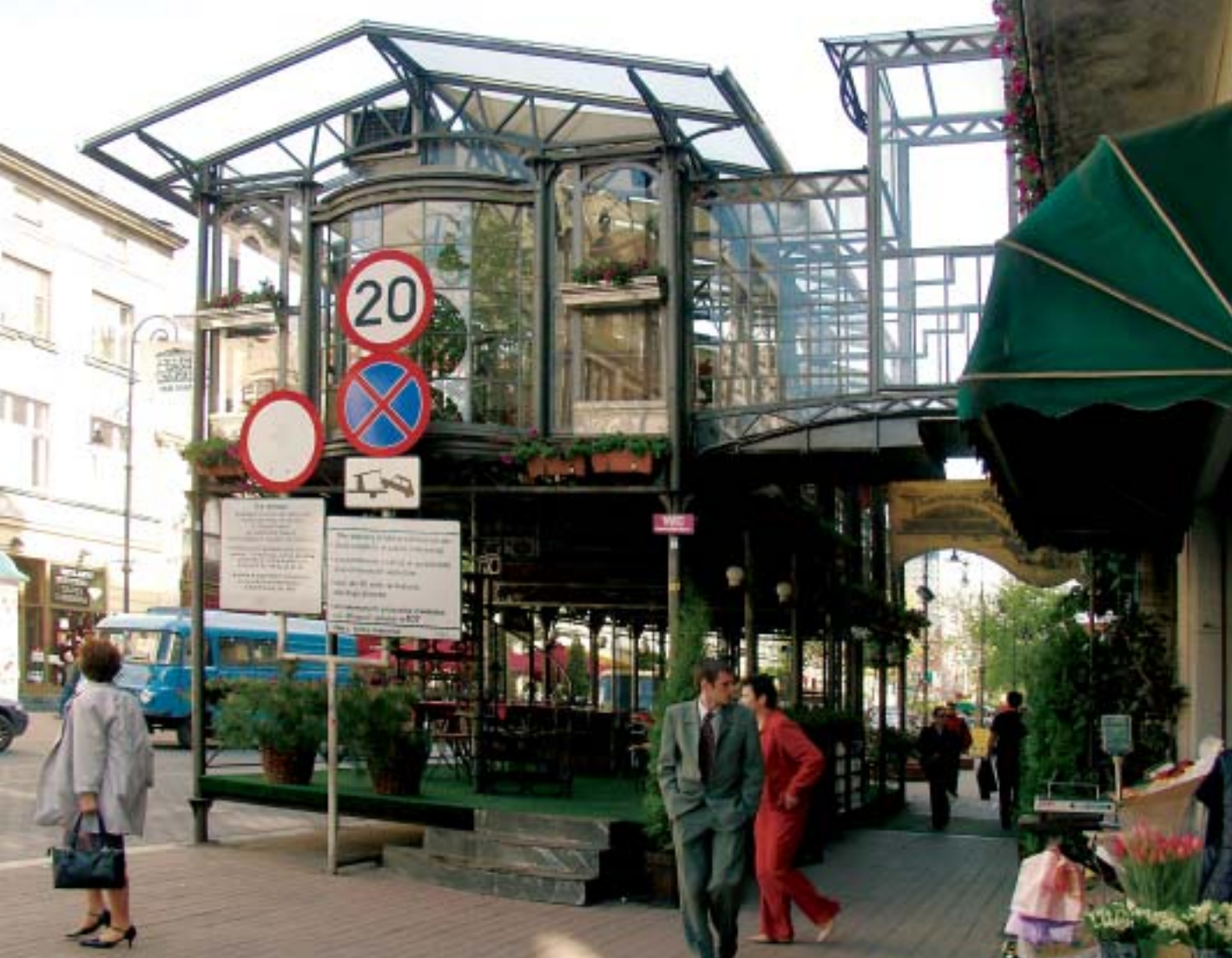
13. Ogródek restauracji i pabu Piotrkowska-Klub 97 na ul. Piotrkowskiej. 13. Garden of the Piotrkowska-Klub 97 restaurant and pub in Piotrkowska Street.

ale nacisk kładziono na tradycje robotnicze miasta i chętnie nawiązywano do jego „rewolucyjnych tradycji proletariackich”.