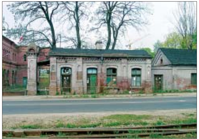
18. Fabryka K. Scheiblera, portiernia Nowej Tkalni przy ul. Kilińskiego. Fot. G. E. Karpińska, 2005 r.

przez człowieka, bowiem to, czego jeszcze nie zdołała przeobrazić natura, rozkradają i niszczą ludzie 18 . Wieloma łódzkimi fabrykami zainteresowali się prywatni przedsiębiorcy, którzy – nie zapewniając ochrony konserwatorskiej – wynajmują fabryczne wnętrza właścicielom firm czy hurtowni. W budynkach tych handluje się meblami, tekstyliami, artykułami budowlanymi, papierniczymi; znajdują się tu biura rachunkowe i projektowe; mieszczą się firmy naprawiające komputery czy sprzęt gospodarstwa domowego, otwierane są także bary. Takie działania tylko wydłużają kres ponad stuletniej historii fabryk, które – zanurzając się w natarczywej teraźniejszości – utraciły architektoniczny detal, a ich wnętrza