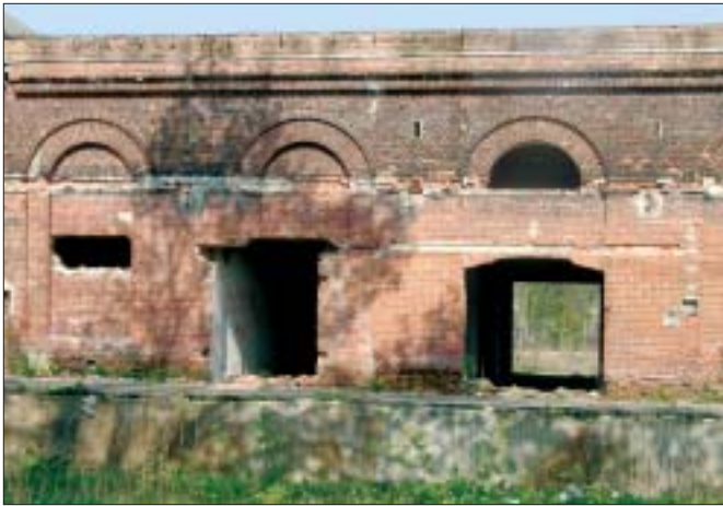
16. Magazyny przy Zjednoczonych Zakładach Scheiblera i Grohmana. Fot. G. E. Karpińska, 2005 r.

16. Storehouses of the Scheibler and Grohman United Works. Photo: G. E. Karpińska, 2005.