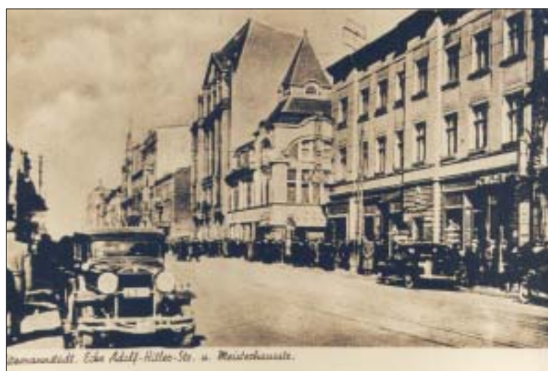
10. Łódź w czasie okupacji. 10. Łódź during Nazi occupation.

Dekretami i zarządzeniami wprowadzili Niemcy w Łódź nowy porządek i zmienili jej wygląd 10 . Działania te były wizualnym świadectwem ich panowania w mieście i miały mu nadać niemiecki