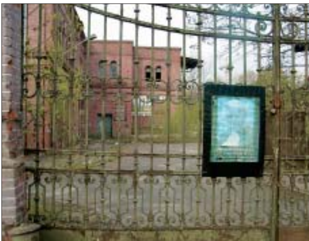
17. Fabryka K. Scheiblera, główna brama Nowej Tkalni przy ul. Kilińskiego. To miejsce odwiedził Jan Paweł II w czerwcu 1987 r.

Jednakże budowa nowoczesnego centrum (czytaj: nowoczesnej ulicy), pełniącego funkcje handlowo-usługowe, skazała na zagładę fabryki – trwały model przestrzenny dziewiętnastowiecznego miasta 17 , materialny znak potęgi Łodzi przemysłowej. Opuszczone, pozbawione jakichkolwiek działań konserwatorskich, zabezpieczających czy adaptacyjnych, stały się miejscami, „z których uszło życie”, a powybijane szyby i dziury po oderwanych kawałkach muru straszą i przytłaczają na tle pejzażu żyjącego miasta. Z jednej strony budowle, które wznosił człowiek, zostały oddane pod władanie natury i ulegają jej brutalnej sile, z drugiej strony zaś są niszczone