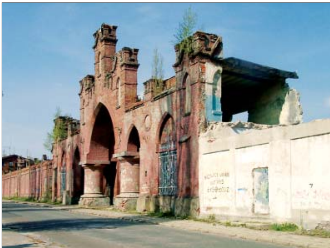
15. Fabryka Grohmana, główna brama. Fot. G. E. Karpińska, 2005 r.

Po 1989 r. Piotrkowska otrzymała nową nawierzchnię i stylowe latarnie, oświetlono odnowione fasady kamienic, wstrzymano na niej ruch kołowy i zamieniono ulicę w promenadę, otwarto ogromną ilość restauracji i pubów, przy których w sezonie rozstawiane są na jezdni ogródki. Od 1992 r. zaczęto na Piotrkowskiej organizować: święto Łodzi, o którym coraz głośniej w całej Polsce, Paradę Techno, wystawy plastyczne i festyny, happeningi. W ten oto sposób dzisiejsi decydenci, projektanci i budowniczowie miasta przywracają świetność ulicy i nawiązują do epoki, w której w kawiarniach i restauracjach przesiadywali właściciele olbrzymich fortun, do czasów miasta otwartego na świat, chłonnego różnorodnej mody i prądy. Nowe czasy i nowe władze przywróciły na Piotrkowską życie. Ulica, jak na prawdziwe centrum miasta przystało, stała się fascynującym i przyciągającym miejscem spotkań ludzi w różnym wieku, miejscem wypełnionym gwarem i dostarczającym szczególnego dreszczu płynącego z zagęszczenia tłumu realizującego w jej przestrzeni swe różnorodne interesy i fascynacje.