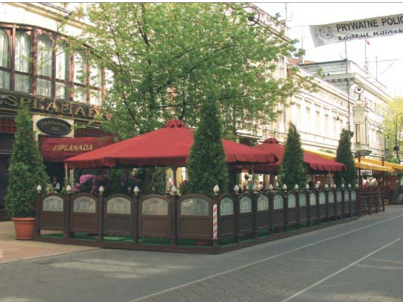
25. Ogródek restauracji Esplanada na ul. Piotrkowskiej. 25. Garden of the Esplanada na ul. Piotrkowskiej restaurant.