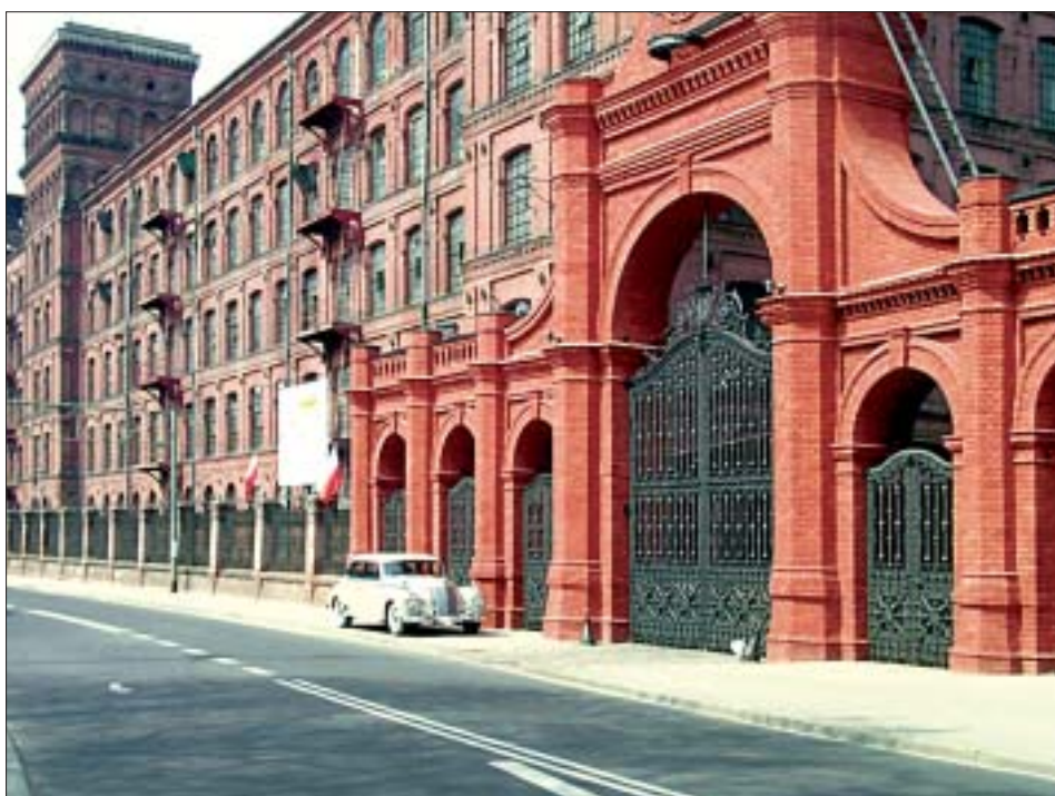
21. Main gate of the I. Poznański factory after renovation.

m.in. wspólnota przeszłych doświadczeń oraz wspólna pamięć. „Materializują się” one w idealizujących utraconą przeszłość opowieściach o tworzeniu się wielkich fortun, o pracowitości i uczciwości fabrykantów, ich trosce o byt i zdrowie robotników oraz ich rodzin, o ciężkiej i szanowanej pracy w fabryce i o robotniczej solidarności. To także historie z życia w „naszej” kamienicy, na „naszej” ulicy i w „naszej” dzielnicy: o tym, jak każdy znał się z każdym i sobie pomagał, o zawodach w strzelaniu z kalichloru pod komórkami i śmietnikiem, spotkaniach sąsiadek w maglu; o tym, że każdy chłopak znał grę w kłipę i chodził kąpać się w gliniankach przy cegielniach na Dąbrowie czy Zarzewie; jak leczono choroby płuc i zapalenie gardła; o dobrych i złych Niemcach, o Żydach handlujących na Bałutach. Uporczywość, z jaką łodzianie podążają myślami w stronę nieobecnego