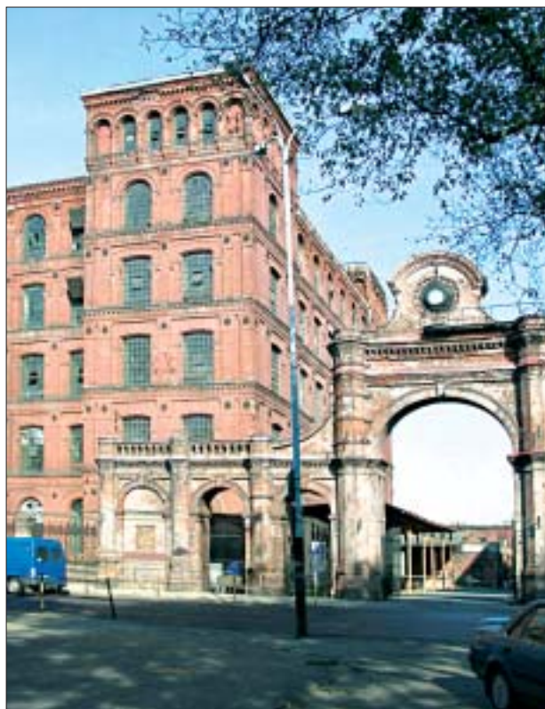
20. Brama główna fabryki I. Poznańskiego przed renowacją. Fot. G. E. Karpińska, 2003 r.