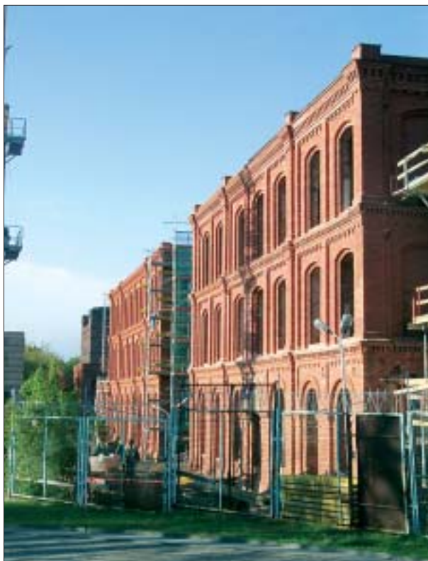
24. Fabryka I. Poznańskiego. Bielnik i wykańczalnia w czasie renowacji. Fot. G. E. Karpińska, 2005 r.

działaniu nie chodzi tylko o przywoływanie przeszłości, lecz również o to, by przeszłość współistniała z „teraz”. Przemysłowe formy architektoniczne nie są przecież już „teraz” „tamtymi” budowlami, zresztą miasta nie są też już „tamtymi” miastami, bo „tamte” miasta przestały istnieć na powierzchni – są na nowo ustanawiane, odkrywane, są wskrzeszonymi ruinami