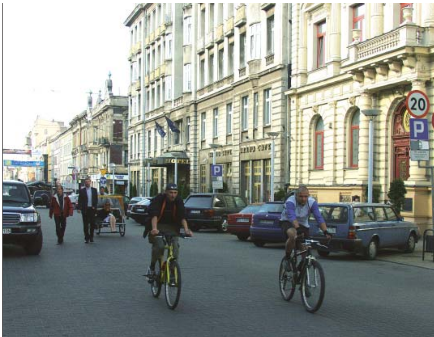
26. Ulica Piotrkowska. 26. Piotrkowska Street.