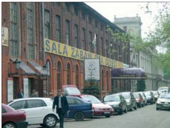
22. Prywatne firmy w pierwszej fabryce K. Scheiblera przy placu Zwycięstwa.

Widoczne w krajobrazie Łodzi fabryki, obok osiedli przyfabrycznych, fabrykanckich rezydencji i willi, to pozostałość „realnego” wymiaru przemysłowego miasta. Ich sylwety odsyłają do innego wymiaru przemysłowej Łodzi, niewidocznego, stworzonego przez zwyczajnych ludzi, na który składają się