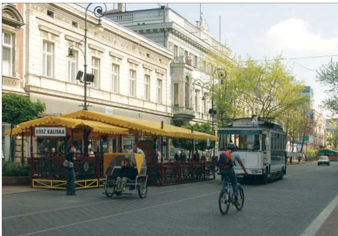
14. Ogródek pubu Łódź Kaliska na ul. Piotrkowskiej. Fot. W. Stępień.

Jak ustaliłam na wstępie, miasto-palimpsest to twór niedokończony, w którym stale nakładają się na siebie nowe warstwy w różnych planach i na różnych poziomach. Na warstwy Łodzi przemysłowej z okresu socjalizmu musiały zatem nałożyć się inne; kolejni „właściciele” Łodzi utwierdzają swoje prawa własności głosząc ideę miasta ulicy Piotrkowskiej – ulicy