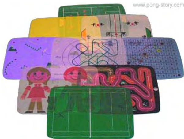
Rysunek 3. Nakładki na telewizor do Magnavox Odyssey

Magnavox Odyssey (1972) Ralpha Baera to w zasadzie pierwsza konsola do gier przeznaczona dla licznego grona odbiorców, bo podłączana do telewizora. Biorąc pod uwagę rosnącą popularność telewizji w USA, a także telewizyjne początki Baera 9 – jak wieść niesie, ponoć o konsoli myślał już w początku lat 50. XX wieku – jest to w zasadzie ścisły początek gier komputerowych znanych obecnie. Do Magnavox Odyssey dodawane są interesujące nakładki na telewizor, w różnych rozmiarach i kolorach. Oto do gry w strzelanie (imitacja prawdziwej strzelby, podłączana do konsoli) dołączona zostaje nakładka w formie nawiedzonego domu (w okienkach pojawiają się duchy), z którymi walczy gracz. Do gry w tenisa, protoplasty klasycznego już Ponga Nolana Bushnella, mamy na przykład nakładkę na telewizor imitującą kort tenisowy. Jeśli spojrzeć na zasadność dodawania takich elementów z perspektywy narracyjnej, widać wyraźnie, że chodzi nie tylko o „zwiększenie realizmu”, ale także wzbudzenie u odbiorców konkretnych,