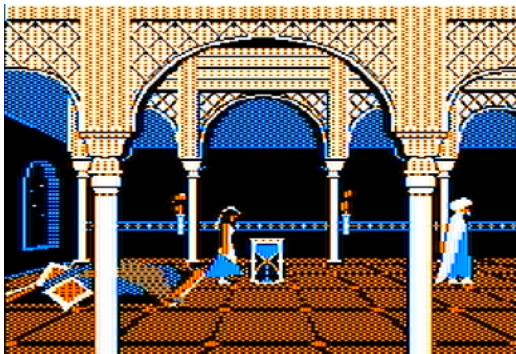
Rysunek 4. Prince of Persia (1989)

Choć w tej początkowej fazie rozwoju gier zwycięstwo odgrywa nadal ważną rolę (zliczanie punktów, możliwość pojedynkowania się z innym graczem), równolegle, bardzo powoli, na znaczeniu zyskuje także aspekt narracyjny. Twórcy coraz więcej pracy wkładają w odтворzenie jakiejś sytuacji na ekranie, stworzenie ułudy rzeczywistości, danie graczowi poczucia, że bierze udział w jakiejś wyjątkowej historii. Ma to znaczenie tym większe, że owe „gry” pierwociny są najczęściej niezbyt atrakcyjne wizualnie, nie porywają odbiorców. Ot, zlepek kilku kwadratów i prostokątów na ekranie. Oczywiście wciąż w tym początkowym okresie rozwoju znajdziemy mnóstwo przykładów rywalizacyjnych, a więc typowych dla gier znanych z ich bardziej tradycyjnych form – mamy więc zwycięzcę i przegranego, a w wypadku porażki jedyne, co możemy zrobić, to uruchomić grę od nowa. Niemniej jednak stopniowo, acz systematycznie gry rozwiną się na tyle, że odejdą od tego klasycznego modelu i staną się czymś pomiędzy grą, a bardziej wyrafinowaną twórczością, gdzie oprócz zwycięstwa czy porażki liczy się także fabuła, opowieść, którą „sprzedają” nam twórcy.