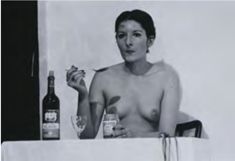
Rysunek 8. Marina Abramović podczas performansu Lips of Thomas

wydarzeń, który ma kolosalny (choć w dalszym ciągu zaprojektowany wcześniej) wpływ na przedstawiane wydarzenia.