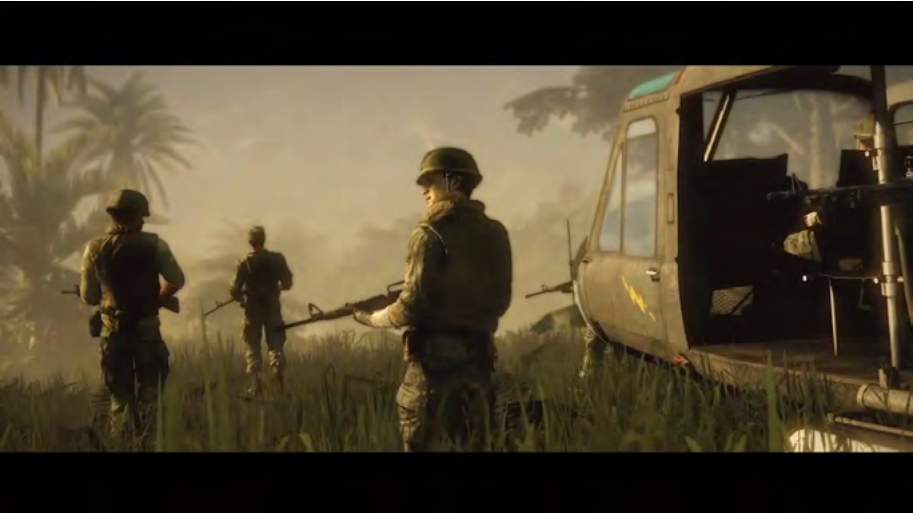
Rysunek 7. Battlefield Bad Company 2 Vietnam – kadr ze zwiastuna gry, nawiązujący do filmów wojennych o konflikcie w Wietnamie

W teorię Baudrillarda doskonale wpisują się współczesne gry wideo. Wejście w świat gry jest o wiele silniejszym doświadczeniem niż oglądanie filmu. Uczestnicząc w rozgrywce, gracz musi całą uwagę skupić na wydarzeniach w grze, w przeciwnym razie granie będzie niemożliwe. To zaangażowanie jest tak silne, że ciężko je zrozumieć komuś, kto nigdy w gry nie grał. Obserwując rozgrywkę z boku, znad ramienia osoby grającej, widzimy jedynie mniej lub bardziej odrażający brutalnością czy też zupełnie nużący spektakl, taki nieudolnie zrobiony film. Dopiero jeśli sami zagramy, dostrzeżemy tę kolosalną różnicę między filmem a grą.