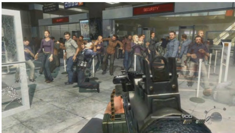
Rysunek 11. Call of Duty: Modern Warfare 2 – misja No Russian

w ciemności) naszego zwierzchnika – terrorysty. Następnie rozświetlenie, winda się zatrzymuje, otwierają się drzwi. Towarzyszy nam czterech terrorystów, wszyscy ubrani w kamizelki, z potężnymi karabinami. I teraz wchodzą w przestrzeń lotniska w Moskwie. Widzimy dziesiątki pasażerów, z głośników zaczyna dobiegać nerwowa muzyka. Nasi towarzysze specjalnie się nie ociągają, unoszą karabiny i zaczynają na oczach gracza (który w tym momencie może już swobodnie się poruszać i również strzelać) „pruć” do wszystkiego, co się rusza. Ludzie padają, ktoś się czołga ranny, zostawiając za sobą szkarłatny ślad krwi itd. Gracz jest świadkiem tej dantejskiej sceny, rzezi niewiniątek – co może zrobić? Może tylko przyłączyć się do oprawców, nie może ich zastrzelić (choć przecież byłoby to możliwe, ale twórcy nie dają nam takiej opcji). Możemy ewentualnie iść i nie strzelać, biernie się przyglądając. Scena słusznie budzi wiele kontrowersji. Mamy możliwość wyłączyć grę lub w opcjach zaznaczyć, że tej akurat misji nie chcemy rozgrywać. Zasób danych nam możliwości jest tu skończony i bardzo mocno ograniczony. Paradoksalnie, scena ta pokazuje pewną ułudę nieliniowości gier komputerowych. Zawsze będziemy bowiem poruszali się po ścieżkach