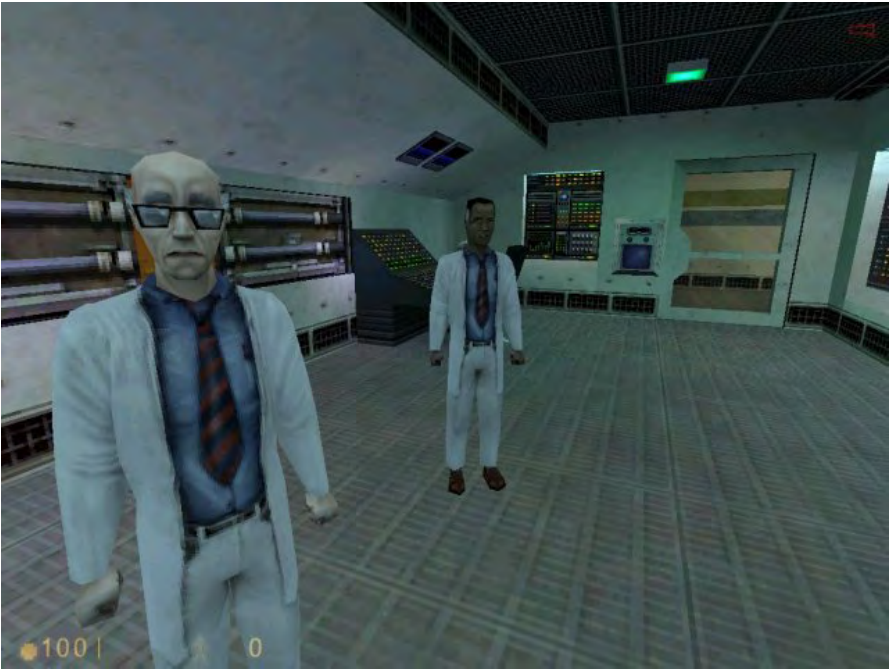
Rysunek 9. Half-Life

Tymczasem twórcy Half-Life zaproponowali coś zupełnie innego. Nie tylko bardzo wyraźnie i zarazem finezyjnie podzielili całą opowieść na poszczególne etapy (wstęp, rozwinięcie, zakończenie), lecz także zastosowali kilka bardzo interesujących chwytów w samym sposobie opowiadania, wykorzystując jakże oczywisty fakt, że w centrum wydarzeń znajduje się gracz i niemal w fizyczny sposób eksploruje świat.