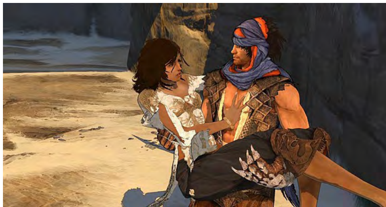
Rysunek 6. Prince of Persia (2008)

Przyjrzyjmy się zatem wydanej w 2008 roku nowej odsłonie Prince of Persia , by pokazać, że zjawisko, o którym piszę, a więc dominacyjna rola narracji, która stopniowo przez lata rozwoju gier nabierała coraz większego znaczenia, nie jest jedynie wymysłem autora.