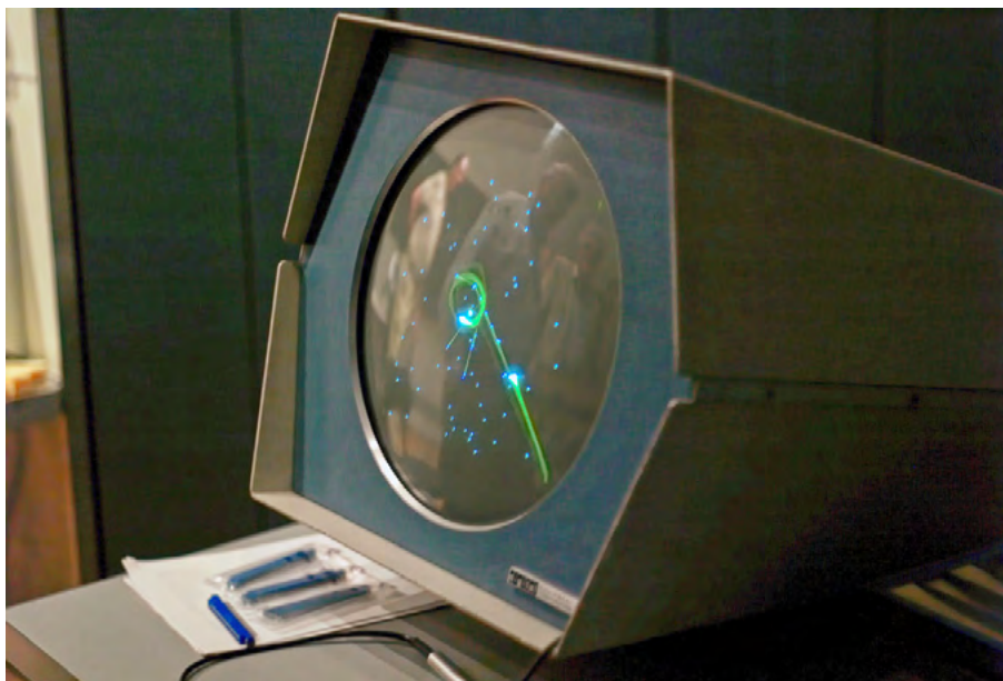
Rysunek 2. Spacewar! (1961)

Weźmy Spacewar! z 1961 roku. Już w samym tytule kryje się obietnica niesamowitej przygody – wojny w kosmosie, między dwoma statkami. Podobnie jak w Tennis for Two o żadnym liczniku punktów zwycięstwa nie ma mowy. Dlatego, mimo że dość szybko zaczynają powstawać gry, w których, tak jak w niewirtualnym pierwowzorze, rywalizacja odgrywa kluczowe znaczenie (jak w szachach, warcabach czy nawet później w tenisie za sprawą Ponga ), równie ważne stają się opowieści i wprowadzenie gracza w historię, wytworzenie w jego umyśle narracji, którą on sam będzie dalej budował.