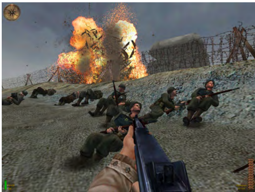
Rysunek 10. Medal of Honor: Allied Assault - lądowanie na plaży Omaha

w film””, a więc pokierowanie losami szeregowca, który w huku strzałów i wśród świszających dookoła pocisków uczestniczy w desancie wojsk alianckich w czasie II wojny światowej. Scena w grze została zrealizowana tak jak w filmie. Jeden z żołnierzy coś wykrzykuje, zagrzewając nas do walki, inny się modli, powoli w oddali wyłania się plaża, zaczynają swój koncert działa przeciwdesantowe itd. A gracz jest w samym centrum tego kotła; nie możemy wprawdzie poruszać się po łodzi transportowej, ale możemy swobodnie ruszać głową, obserwując to, co dzieje się dookoła. W końcu łódź dobija do brzegu i wchodzimy na pole walki już z pełną kontrolą postaci. Biegniemy przed siebie, kucamy za zasiekami ustawionymi na plaży, widzimy, jak obok ktoś pada, ktoś biegnie dalej, wszędzie świst pocisków i terkot