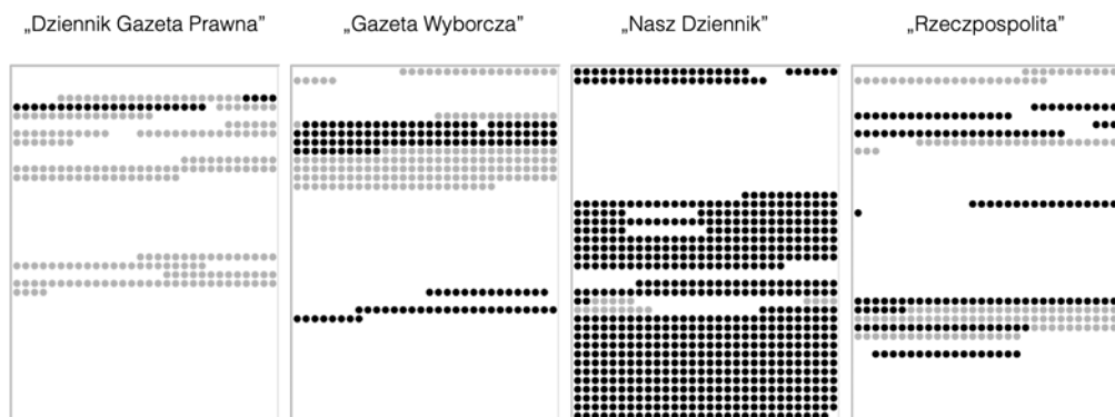
Rysunek 1. Portrety tekstów – lokalizacje ramy PO (kolor szary) i ramy PiS (kolor czarny) w strukturze analizowanych tekstów.

Ilustracji tego zjawiska dostarczają portrety dokumentów analizowanych tekstów. Rysunek 1 ukazuje lokalizację dwóch głównych ram w strukturze analizowanych tekstów. W przypadku „Gazety Wyborczej” i „Naszego Dziennika” wyraźnie widać, jak elementy dominującej ilościowo ramy (por. tabela 2) nie tylko poprzedzają ekspozycję ramy zdominowanej, ale także następują zaraz po niej. Inaczej mówiąc, jedna rama jest niejako „opakowana” czy też znaczeniowo „brana w nawias” przez drugą. Jedynym medium, w którym nie występuje to zjawisko, jest „Rzeczpospolita”, co koresponduje z najbardziej zrównoważoną prezentacją konkurujących ram w tym dzienniku (por. tabela 2).