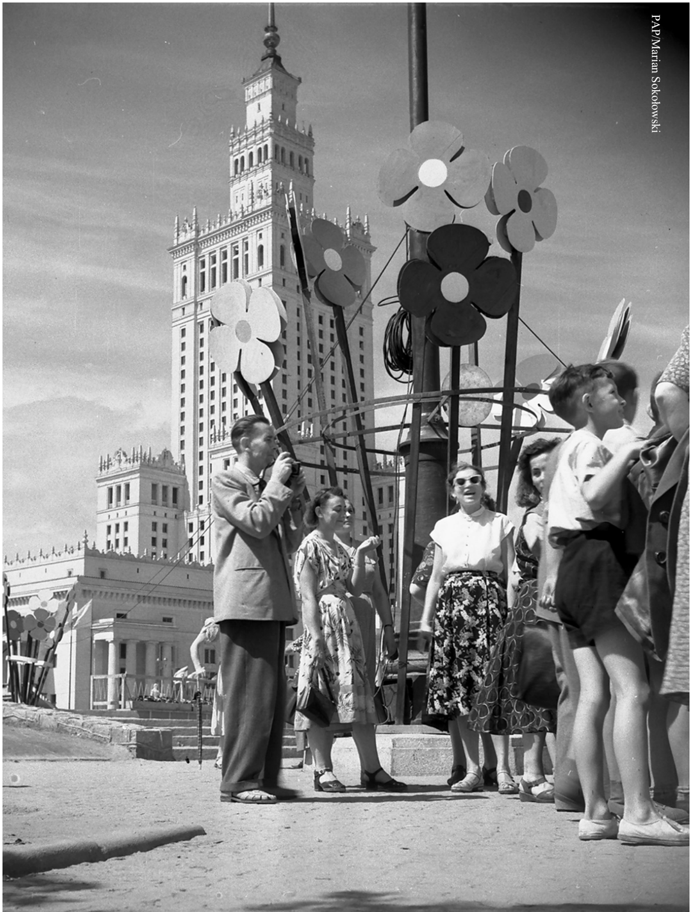
V Światowy Festiwal Młodzieży i Studentów, Warszawa 1955 r.