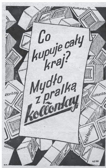
Rys. 5. Reklama mydła Kołłontaj

Na tle innych reklam wyróżniały się reklamy mydła Kołłontaj. Każda składała się z ilustracji, często zawierały też różne hasła promujące produkt (rysunek 5 i 6). Reklamę odmienną od pozostałych zaprezentował będziński Browar Gambrinus (rysunek 7). Poza nazwą browaru nie zawierała ona żadnych informacji, a zamiast tekstu w prostokątnej ramce umieszczono nazwę w okręgu, wewnątrz którego widniał wizerunek legendarnego Gambrinusa, który miał być wynalazcą piwa.