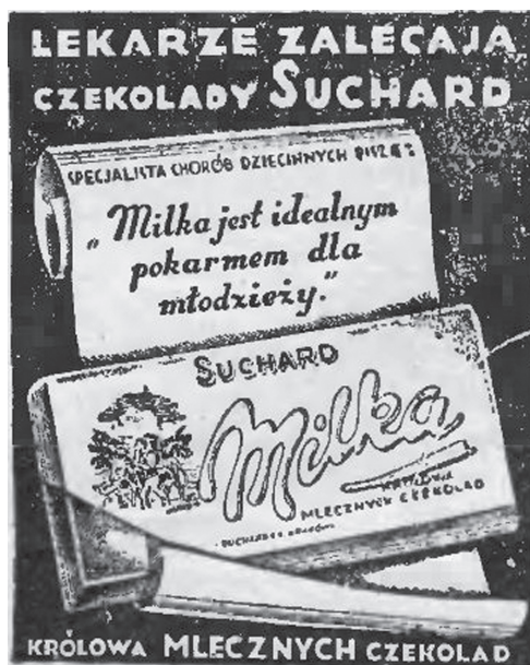
Rys. 8. Reklama czekolady Milka

Najbardziej interesujące reklamy umieszczała podkrakowska Fabryka Czekolady Suchard (rysunek 8 i 9). Była to jedna z fabryk szwajcarskiej firmy (w Polsce od 1925 r.), którą założył, Philippe Suchard, producent czekolady Milka.