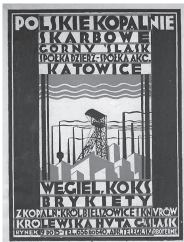
Rys. 2. Reklama Polskich Kopalni Skarbowych