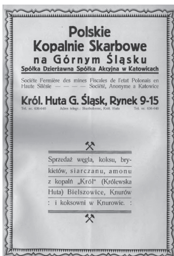
Rys. 1. Reklama Polskich Kopalni Skarbowych

bardzo często zajmowała całą stronę, mimo stosunkowo niewielu treści (pełna nazwa, adres, telefon i informacja, co dokładnie sprzedają). Wykorzystano również godło górnicze (rysunek 1). Zdecydowanie ładniejszą reklamę tych samych kopalń umieszczono w Skorowidzu branż przemysłu... (1929) (rysunek 2).