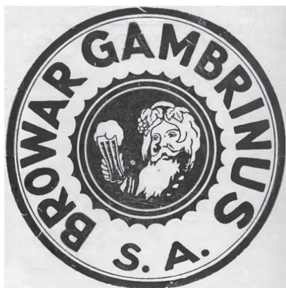
Rys. 7. Reklama Browaru Gambrinus