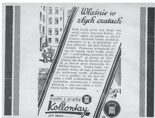
Rys. 6. Reklama mydła Kołłontaj