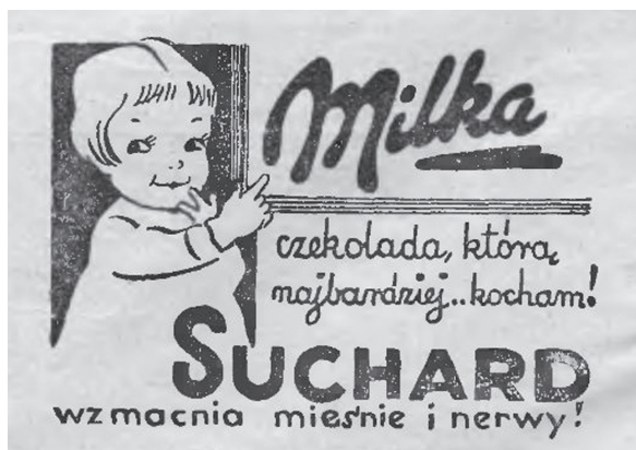
Rys. 9. Reklama czekolady Milka