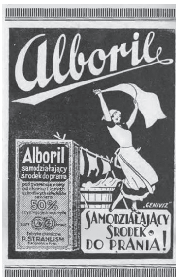
Rys. 4. Reklama środka do prania Alboril

Z tego powodu firmy, które zdecydowały się na grafikę lub jakiegokolwiek hasła reklamowe, wyróżniały się na łamach „PŚ”, co niewątpliwie mogło wpłynąć na skuteczność reklamy. Jedną z takich reklam był środek do prania Alboril (rysunek 4). Grafikę wykonała firma Geniusz zajmująca się reklamą artystyczną. Firma ta trzykrotnie zamieściła własne reklamy w „PŚ”, ponadto była odpowiedzialna za szatę graficzną okładki czasopisma.