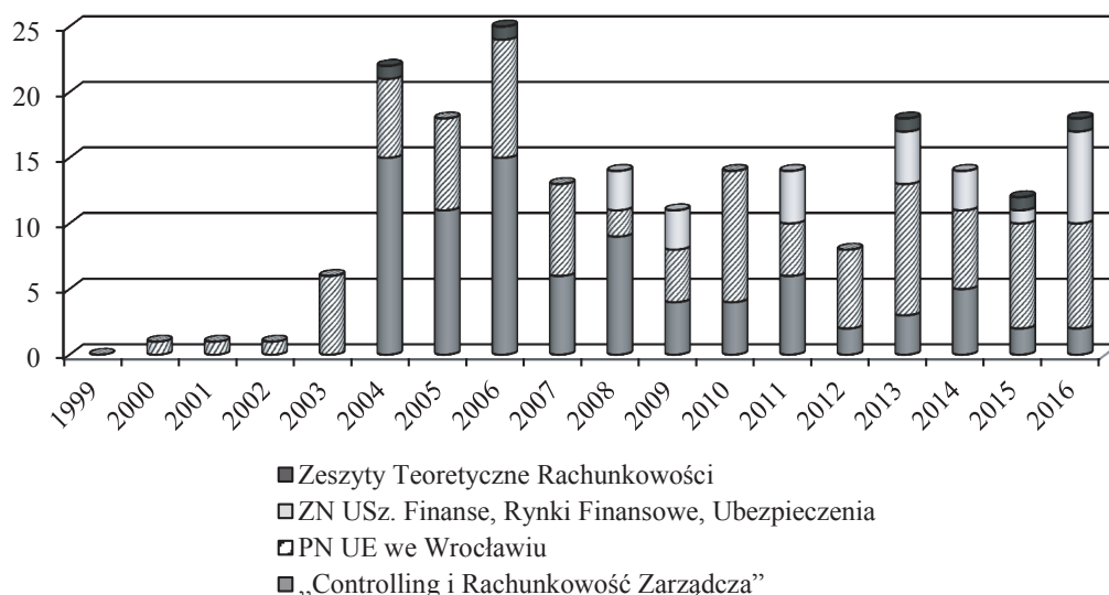
Rys. 2. Liczba artykułów opublikowanych w badanych periodykach