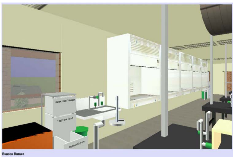
Obr. 1. Prostredie virtuálneho chemického laboratória z pohľadu žiaka/študenta (Dalgarno et al., 2009)

Dalgarno a kolektív (2009) zostavili kompletný virtuálny 3D model chemického laboratória (Charles Sturt University), Obr.1. Tento model bol vytvorený pomocou Virtual Reality Modeling Language (VRML) a aplikácie Blaxxun Contact VRML Browser 1 . Model spolu s potrebnými aplikáciami dostali študenti na inštalačnom CD. Vďaka tomu sa študenti mohli doma zoznámiť s vybavením a štruktúrou laboratória. Do reálneho laboratória potom prichádzali už s potrebnými vedomosťami o laboratórnom vybavení.