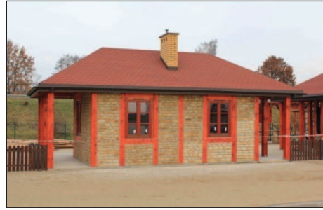
Fot. 8. Nowy obiekt usługowy zbudowany z tradycyjnego materiału kamiennego