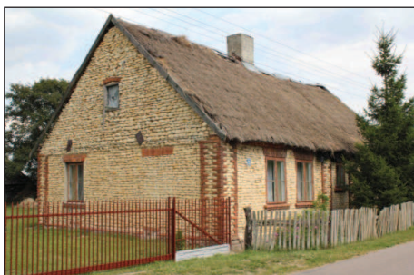
Fot. 1. Ostatni na terenie gminy budynek mieszkalny kryty strzechą (wieś Felicjanów)

Dopełnieniem zabudowy w obrębie gospodarstwa była stodoła, najczęściej obiekt wielkokubaturowy, nakryty dachem dwuspadowym. Częstą praktyką, zwłaszcza w przypadku budynków typowo produkcyjnych, było umieszczanie na ich ścianach szczytowych inskrypcji, dat budowy oraz symboli religijnych 8 .