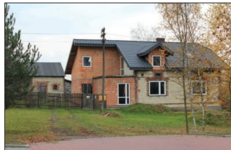
Fot. 11–12. Coraz częściej jednak tradycyjny materiał jest ukrywany pod warstwą ocieplenia i tynku