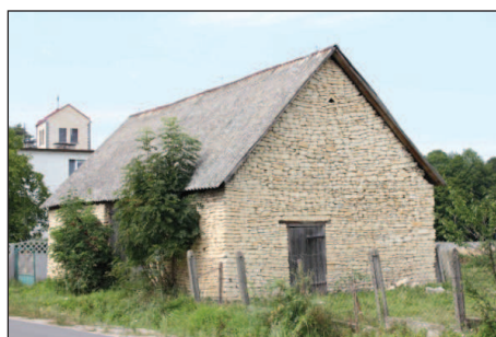
Fot. 6. Stodoła we wsi Wielenin jako przykład obiektu w całości wzniesionego z kamienia. Po lewej stronie widoczny fragment wieży kościoła

Reasumując, przy zastosowaniu prostych w sumie środków otrzymywano bardzo oryginalny efekt architektoniczny i estetyczny. Kontrast, jaki uzyskiwano poprzez zestawienie jasnokremowego kamienia i czerwonej cegły, był i jest nader czytelny w krajobrazie wsi, nawet z dużej odległości. Z bliska przyciąga uwagę naturalnie bogaty rysunek, urozmaicony załamaniem na powierzchni, będącymi śladem ręcznej obróbki surowca, dający wrażenie zupełnie odmienne niż materiały współcześnie stosowane w budownictwie. Odbiór koloru ściany wykonanej z opok jest silnie uzależniony kąta padania promieni słonecznych i od ich intensywności. W pełnym słońcu kolor ścian odbierany jest jako zbliżony do białego, natomiast pod koniec dnia wydaje się żółty. Duża staranność obróbki i dopasowania elementów z kamienia świadczy o świadomym działaniu wykonawców, którego efektem miało być wyeksponowanie naturalnego materiału konstrukcyjnego tworzącego mury.