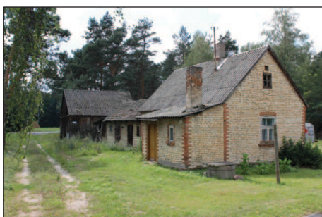
Fot. 5. Przykład małej zagrody zespolonej (wieś Człopy)