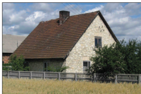
Fot. 2. Charakterystyczny budynek mieszkalny o niewielkiej powierzchni, wysokim dachu i mozaikowych murach. Wybudowano ich jedynie kilkanaście – wszystkie w gminie Uniejów