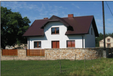
Fot. 9. Przykład udanego zastosowania tradycyjnego kamienia we współczesnych obiektach małej architektury