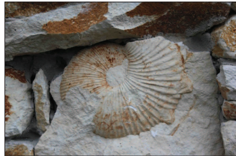
Fot. 10. W złożach opok z Roźniatowie zachowały się liczne skamieniałości fauny górnokredowej, co może stanowić sporą atrakcję dla turystów