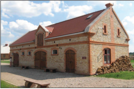
Fot. 7. Replika najciekawszego pod względem architektonicznym budynku inwentarskiego w Uniejowie