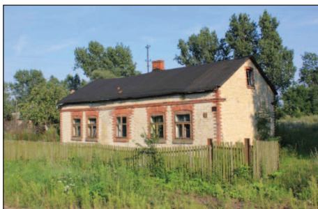
Fot. 3. Typowy budynek mieszkalny z końca lat 30. wieku XX (wieś Ostrowsko)