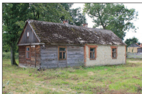
Fot. 4. Budynek o konstrukcji mieszanej, częściowo wzniesiony z drewna, częściowo murowany z opok (wieś Wielenin)