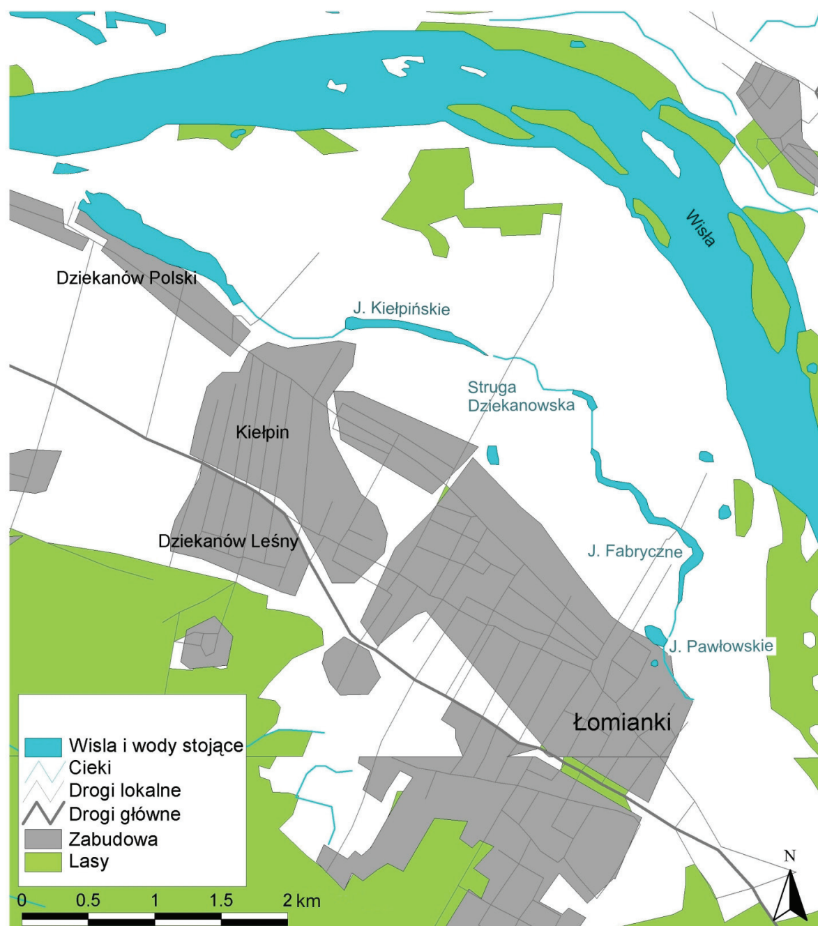
Rys. 1 Teren badań ze wskazaniem lokalizacji J. Kiełpińskiego i głównych jezior o charakterze storzeczy w ciągu Strugi Dziekanowskiej.

W celu waloryzacji szaty roślinnej poszukiwano chronionych i zagrożonych oraz rzadkich gatunków roślin rosnących w cieku wodnym i ciągu starorzeczy. Wstępnie rozpoznano ważniejsze zbiorowiska roślinne.