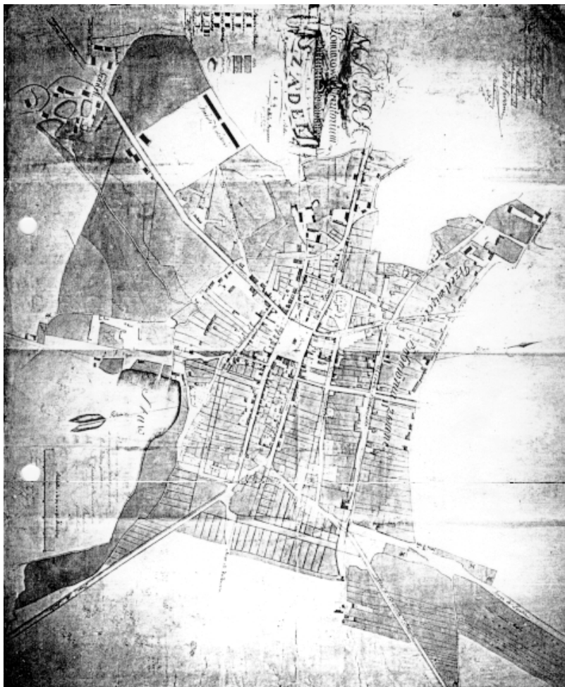
Rys. 1. Szadek, plan miasta z 1824 r.

samym charakterystyczne cechy danemu ośrodkowi i często wpływały na ich oblicze (małe miasta rolnicze).