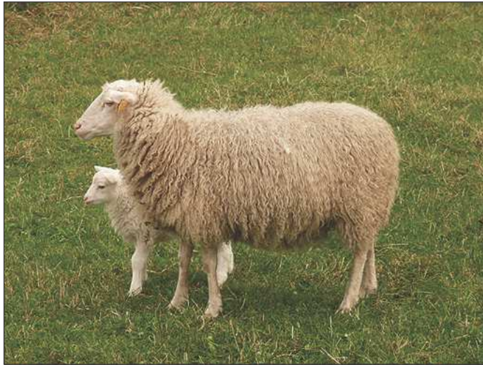
Fot. 1. Maciora (samica) świniarki z jagnakiem

Hodowli owiec, która na ziemiach polskich towarzyszyła powszechnej uprawie zboża, poświęcono w literaturze historycznej stosunkowo mało uwagi 2 , uboga jest też literatura odnosząca się do rozwoju owczarstwa w regionie otaczającym Szadek.