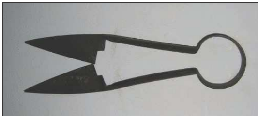
Fot. 2. Nożyce do strzyżenia owiec

Strzyżenie (po uprzednim myciu owiec) odbywało się dwa razy do roku (przeważnie na początku maja oraz we wrześniu, ewentualnie na początku października), przy użyciu specjalnie do tego celu skonstruowanych nożyc (fot. 2). Strzyżenie owiec w gospodarstwie chłopskim należało do obowiązków kobiet, owce folwarczne strzygły chłopki w ramach pańszczyzny.