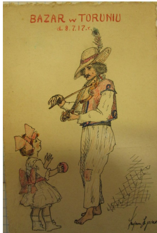
Rysunek przeznaczony na Bazar Gwiazdkowy.

Wincentego à Paulo powstało w 1869 r. Za cel obrało sobie szeroko zakrojoną pomoc ubogim. Kilkanaście lat później, 11 czerwca 1885 r., w zakrystii kościoła św. Jana toruńskie katoliczki założyły prężnie działające Towarzystwo Pań św. Wincentego à Paulo 52 . Rozbudowaną działalność wspomina także proboszcz parafii św. Jana, a jednocześnie