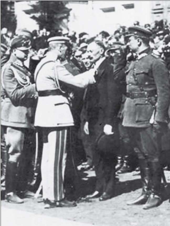
Fot. 1. J. Piłsudski odznacza cywila 10 kwietnia 1921 r. w Płocku. Czy jest to Tadeusz Włoczkowski?

tj. w szeregu lub jako bezpośredni D-cy, wchodzący w skład 206 p. p. i obrońcy Płocka, bądź też w wyraźny i wybitny sposób z nimi współdziałali”.