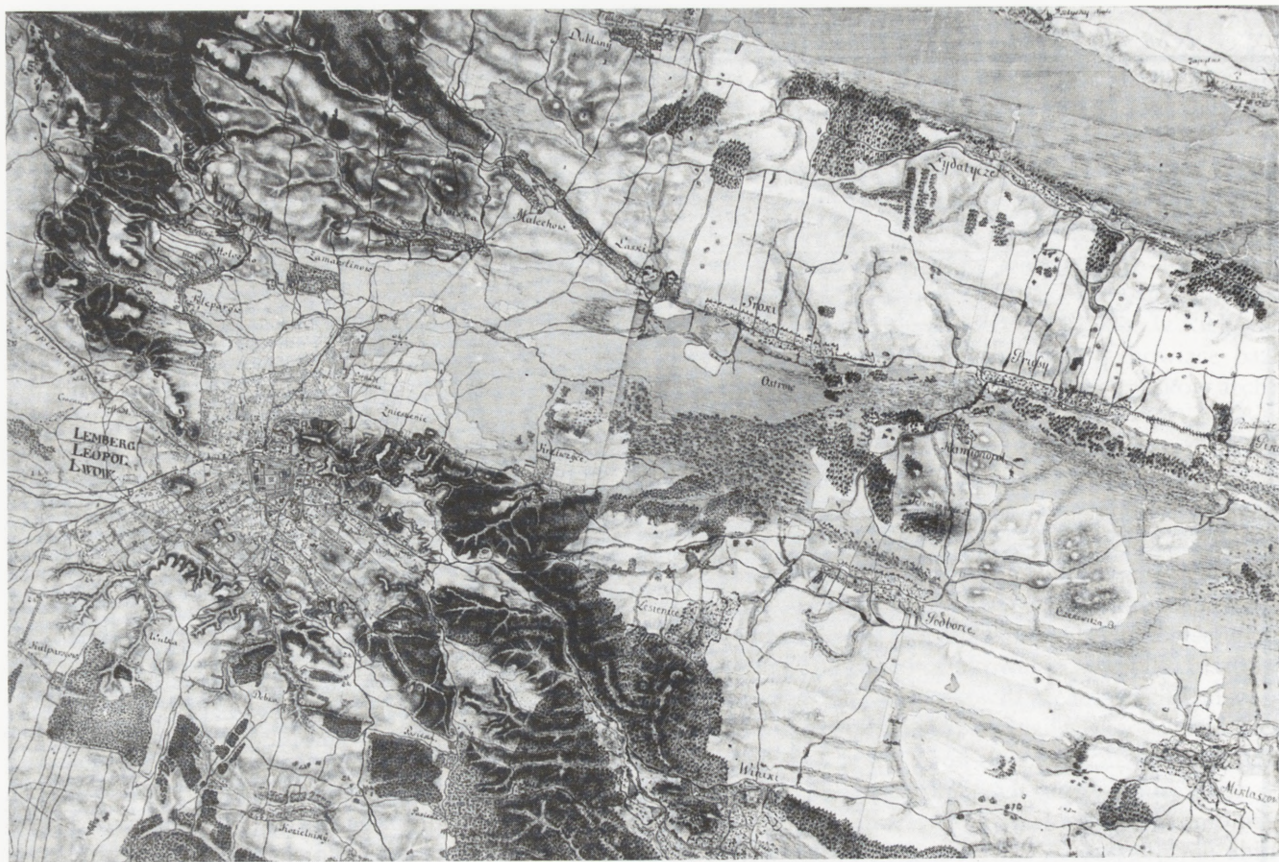
Fragment Mapy Miegi — okolice Lwowa, sekcja XXI 262. Fot. Z. Dubiel, 1985. Dział Archiwaliów i Zbiorów Naukowych ODZ

Fragment of the Mieg Map — environs of Lwów, section XXI 262. Photo: Z. Dubiel, 1985, Department of Archival Material and Scientific Collections ODZ