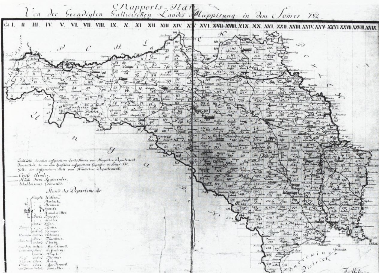
Raport planu sekcji ze „Zdjęcia obszaru Galicji za lat 1775–1783”, zwany też Mapą Miegi lub Zająciem Józefińskim, Dział Archiwalistów i Zbiorów Naukowych ODZ, Mapa Miegi, arkusz bez numeru. Fot. Z. Dubiel, 1985