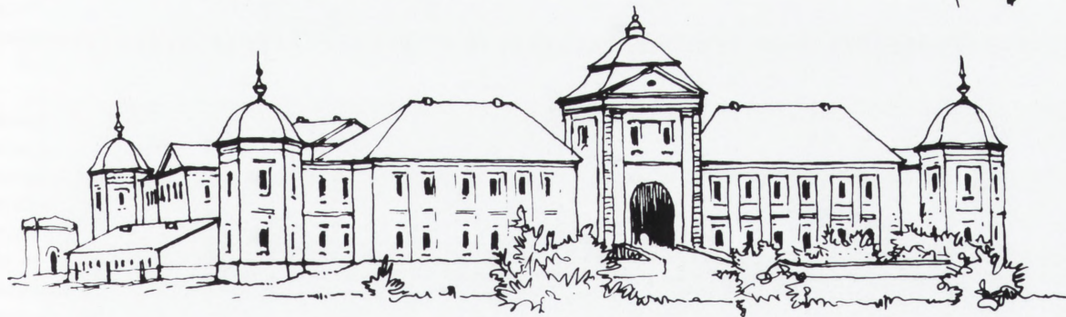
Pałac w Szpikowie na Podolu z XVIII. w.

Widoki zabytków architektonicznych na Podolu — w Zinkowie, Kamieńcu Podolskim i Szpikowie, ze Zbioru rysunków Czesława Thulliego z lat 1912–1915 (plansza 61), Dział Archiwaliów i Zbiorów Naukowych ODZ, neg. nr 1916/4.