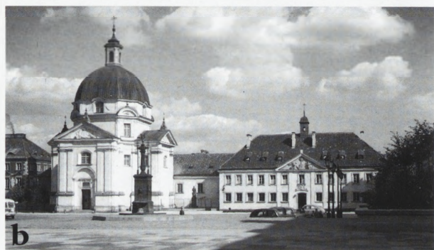
Warszawa — kościół ss. sakramentek na Nowym Mieście: a — zniszczony; b — po odbudowie.

Warsaw — the Sacramentine church in New Town: a — damaged; b — after reconstruction.