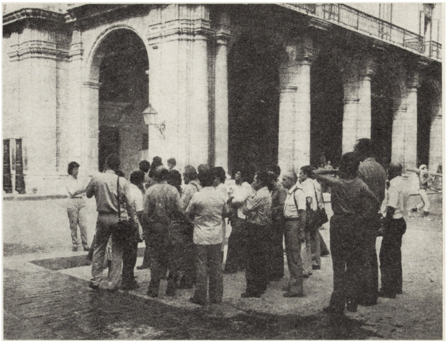
3. Uczestnicy narady zwiedzają Starą Hawanę

W trakcie obrad — oprócz spraw związanych z wewnętrzną organizacją GR — uchwalono na wniosek Sekretarza Generalnego dwa akty. Pierwszy dotyczy wszechstronnego poparcia dla apelu UNESCO z 24. III. 1982 r. w sprawie ratowania Stariej Hawany. Grupa Robocza zobowiązała się do udzielenia pomocy m. in. przy: skompletowaniu sprzętu i materiałów, pracach konserwatorskich w klasztorze Santa Clara (przyszła siedziba Narodowego Centrum Konserwacji, Restauracji i Muzeologii Republiki Kuby) oraz w szkoleniu kubańskich kadr konserwatorskich. Drugi akt, w formie apelu konserwatorów krajów socjalistycznych o zachowanie pokoju, wystosowany został do wszystkich konserwatorów zabytków na świecie i ich głównych organizacji: ICOM, ICOMOS, ICCROM.