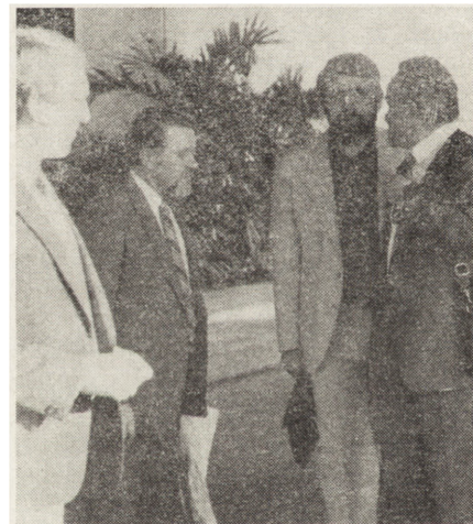
2. Rozmowy w kularach

Należy dodać, że od 1979 r. w ramach GR ukazują się różne wy-