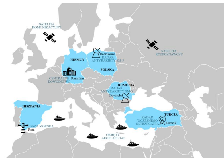
Rysunek 2. Rozmieszczenie komponentów systemu EPAA

W październiku 2009 r. administracja Baracka Obamy ogłosiła rozmieszczenie systemu obrony przeciwrakietowej – European Phased Adaptive Approach (EPAA), opartego na rakietach SM-3 w wariantach IB, IIA i IIB rozmieszczonych w ramach Aegis Afloat na statkach obrony przeciwrakietowej na Morzu Śródziemnym oraz na terenach lądowych w ramach Aegis Ashore: w rumuńskim Deveselu oraz polskim Redzikowie. System EPAA został opracowany w celu obrony przed obecnymi i przyszłymi zagrożeniami raketowymi dla amerykańskich baz w Europie i terytorium członków NATO.