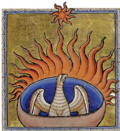
Il. 1. Śmierć Feniksa gorejącego w płomieniach, Bestiariusz z Aberdeen (ok. 1200 r., Anglia, autor nieznany)

feniks całego świata') (Kopaliński 1990: 90–91), w 1926 ustanowiono Królewski Order Feniksa, będący odznaczeniem republiki i królestwa Grecji, imieniem mitycznego stworzenia określono również gwiazdozbiór nieba południowego.