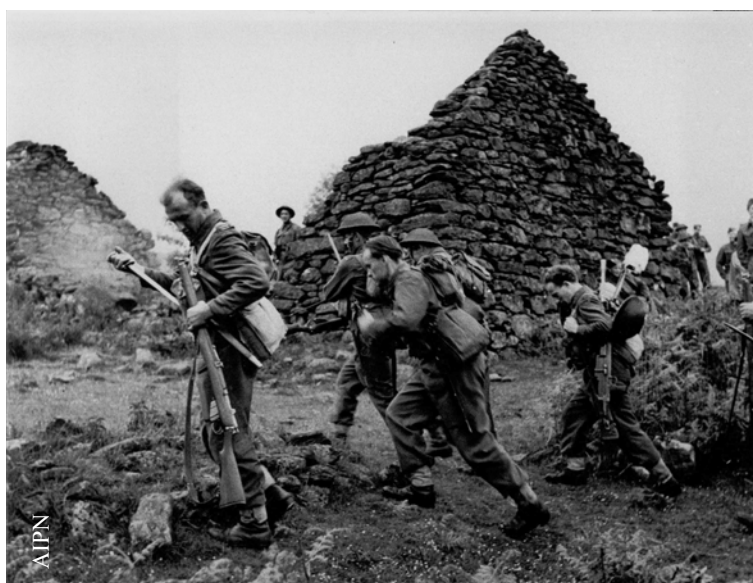
Ćwiczenia polowe polskiej piechoty w Szkocji

Należy podkreślić, że w materiałach dotyczących PSZ, które znajdują się w zasobie BUiAD IPN w Warszawie, odnaleziono jeszcze wiele pojedynczych dokumentów na temat dowódców i wyższych wojskowych służących na Zachodzie. Omówienie wszystkich wymagałoby jednak napisania odrębnego artykułu. Z tego względu wymienione zostały tylko te pozycje, które wydają się najbardziej interesujące.