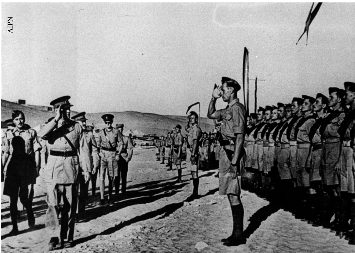
Przyjazd żołnierzy polskich z ZSRR do Palestyny