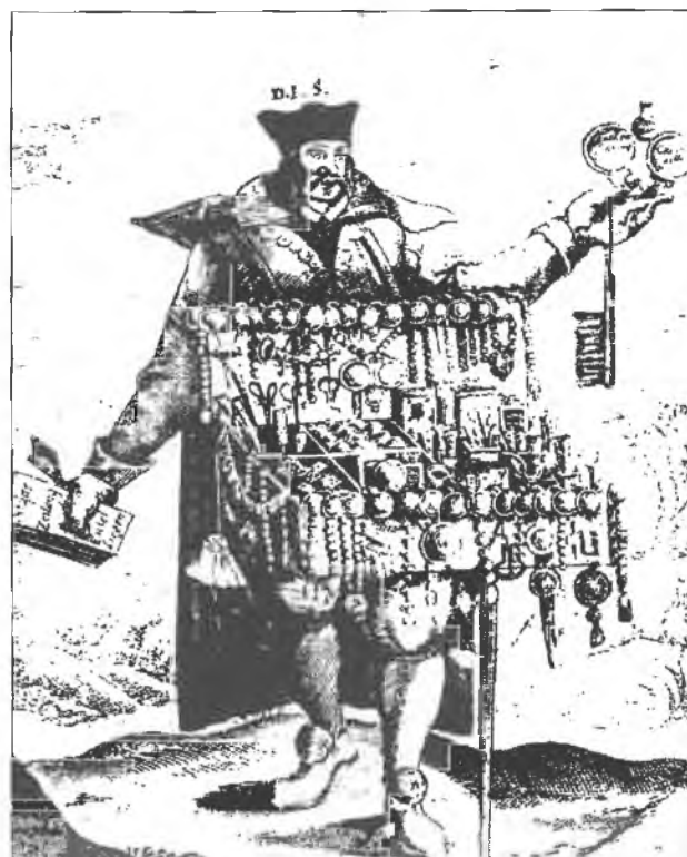
RYC. 1. Angelus Silesius: Handlarz „norymberszczyzną” — 1664 rok

Torunia, Pragi, Norymbergii czy Lubeki. Było to spowodowane przyjęciem zasady, „że w wydawnictwie zostaną zamieszczone wszystkie inwentarze tych osób, które przebywały i posiadały spisany majątek w Poznaniu, bez względu na ich pochodzenie i przynależność społeczną” 6 .