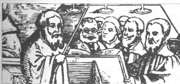
RYC. 2. Drzeworyt ze strony tytułowej kancjonału Pisnie Chwal Bozkych — drukarnia Jana Auguźdeckiego, Szamotuły, 1561 rok. Poniżej detal z ryc. 2.

4 tuziny Feltbrillen o wartości 1 florena i 8 groszy oraz 8 skrzyń zyneczek z okularami ( kestell mitt brillen ) o wartości 4 florenów, a także 13 tuzinów futerałów do okularów ( brillenfutter ) o wartości 2 florenów 9 ;