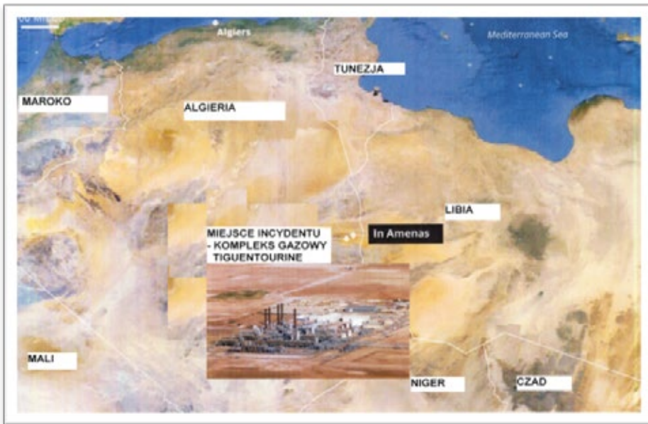
Rys. 1. Położenie kompleksu gazowego Tiguentourine 6 .

Tiguentourine jest międzynarodowym projektem, który stanowi jedną z największych instalacji do przetwarzania tzw. gazu mokrego w Algierii. Fabryka rozpoczęła funkcjonowanie w 2006 r. i przetwarza ok. 9 mld m 3 surowca rocznie. Zakład zatrudnia ok. 700 pracowników. Wśród załogi obecnej na miejscu w dniu zamachu było ponad 130 obcokrajowców: m.in. z Japonii, Norwegii, Wielkiej Brytanii i USA 7 .