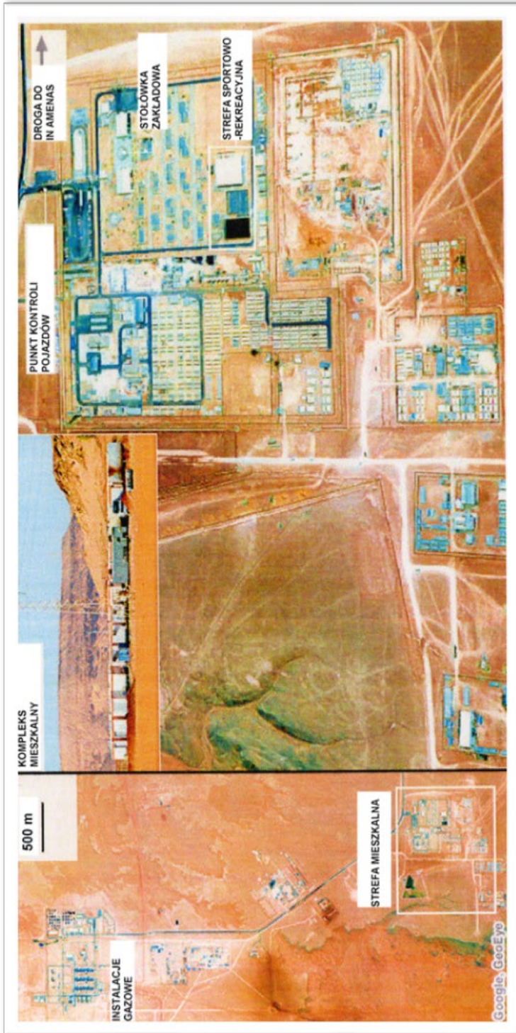
Rys. 2. Mapa sytuacyjna – część mieszkalna i kompleks gazowy Tigentourine (Opracowano na podstawie: http://graphics8.nytimes.com/packages/images/newgraphics/2013/0118-algeria/0119-algeria.jpg [dostęp: 18 VI 2013]).