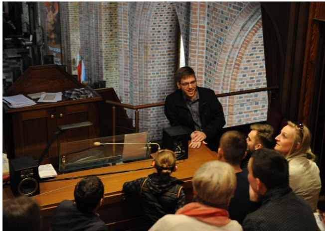
Ryc. 5. Spotkanie z organistą na prospekcie i prezentacja instrumentu

Tekst promujący wydarzenie: Od siły ich brzmienia drżą mury katedry. Jak funkcjonują? Ile mają piszczałek? Spojrzenie na organy z punktu widzenia organisty. Na wydarzenie składały się wejście na prospekt organowy, prelekcja organisty dotycząca zasad działania organów oraz muzyczna prezentacja organów (ryc. 5).