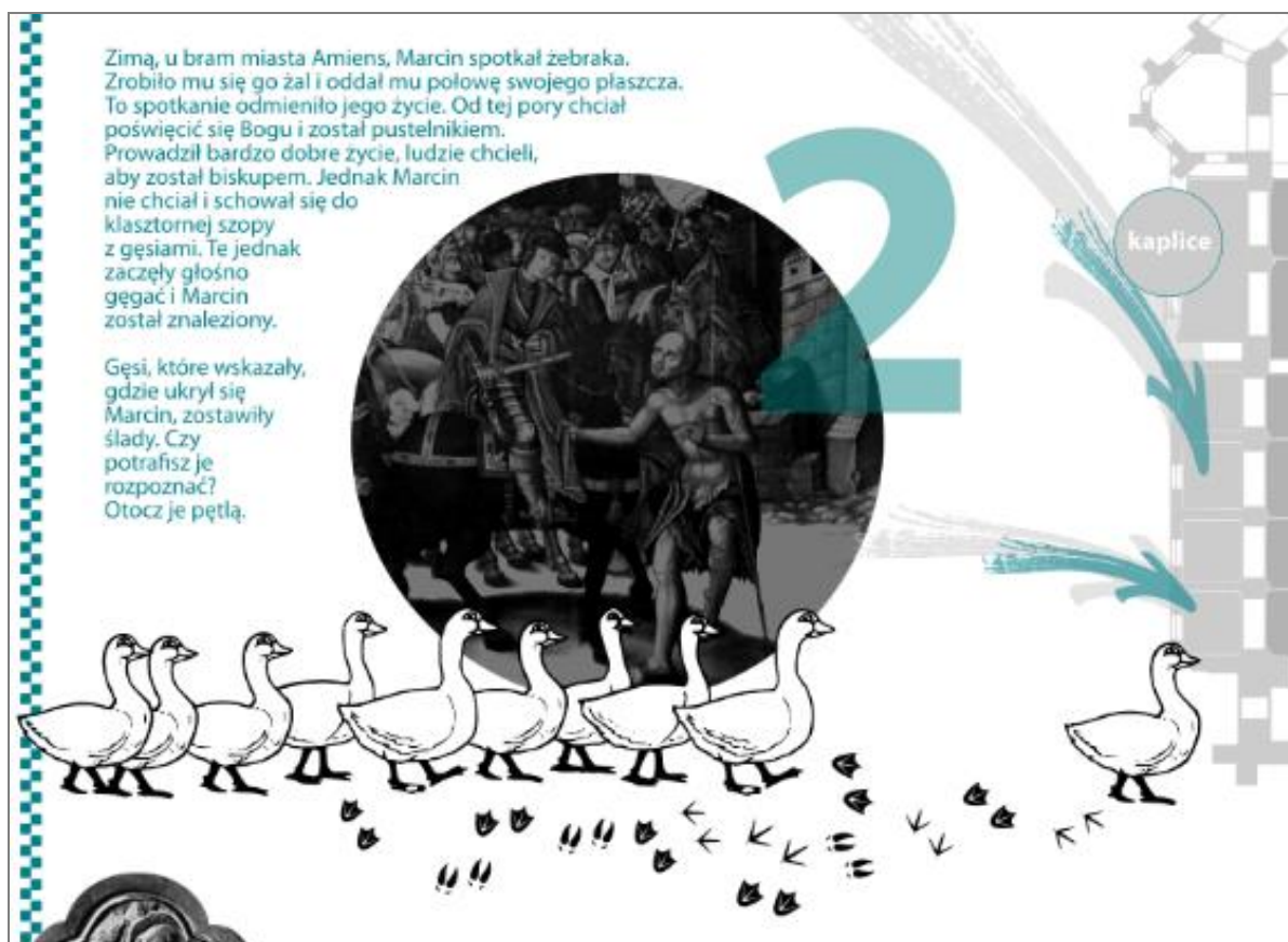
Ryc. 12. Jakie ślady zostawiają gęsi? Fragment karty pracy Tajemnice katedry

Karta pracy aktywizuje zatem dzieci podczas wizyty w katedrze, a zawarte w niej ciekawostki przybliżają informacje dotyczące dzieł sztuki. Edukator, oprowadzając grupę po katedrze, prowadzi narrację ułatwiającą wypełnienie karty oraz wzbogaca ją o ciekawostki związane z zabytkami sztuki. Zadania wskazane w karcie pracy łączą opowieści, legendy czy hagiografie, czyli bogactwo dziedzictwa niematerialnego, z dziedzictwem materialnym widocznym w dziełach sztuki poznańskiej katedry. Przestrzeń sakralna jest tym samym doskonałym miejscem do realizowania szeroko rozumianej edukacji.