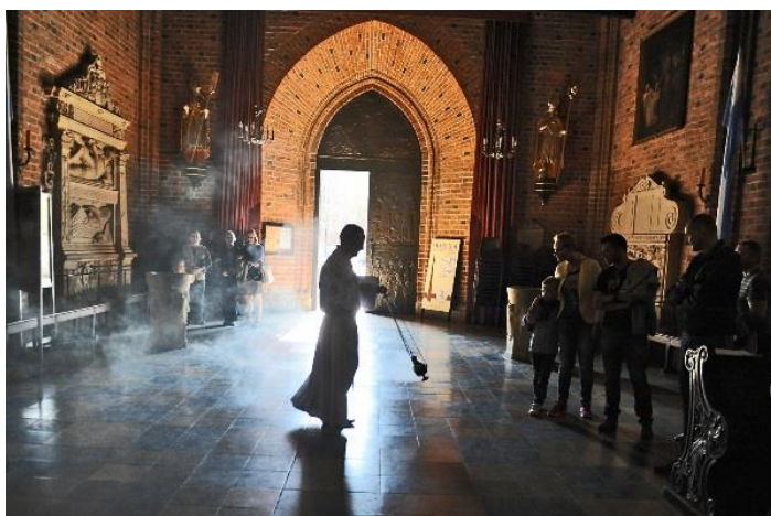
Ryc. 7. Prezentacja kadzideł

Tekst promujący wydarzenie: Zachwyca swoją wonią i sposobem celebrowania. Z jakich ziół powstaje? Jaka jest jego tradycja? Opowieść o kadzidle oraz prezentacja naczyń liturgicznych. Na wydarzenie składały się prelekcja dotycząca znaczenia kadzidła w kulturze chrześcijańskiej oraz prezentacja różnych rodzajów kadzideł, w której czynnie