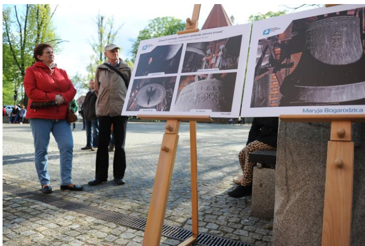
Ryc. 6. Wystawa zdjęć dzwonów katedralnych

Tekst promujący wydarzenie: Słyszymy je, lecz ich nie widzimy. Jak mają na imię? Ile ważą? Ile mają lat? Muzyczna prezentacja dzwonów katedralnych. Na wydarzenie składały się wystawa plasz z fotografiami dzwonów katedralnych znajdujących się w południowej, niedostępnej dla zwiedzających wieży (ryc. 6), prelekcja dotycząca z prezentacją dźwięku każdego