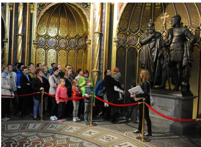
Ryc. 9. Zwiedzanie Złotej Kaplicy

Tekst promujący wydarzenie: Po wejściu do katedry otaczają nas zewsząd. Ile trudu i zapału włożył w nie artysta? Z jakich materiałów powstały? Spacer po katedrze i namacalne obcowanie z dziełami sztuki. Na wydarzenie składała się wycieczka z prezentacją wybranych zabytków katedralnych oraz wejściem do Złotej Kaplicy (ryc. 9).