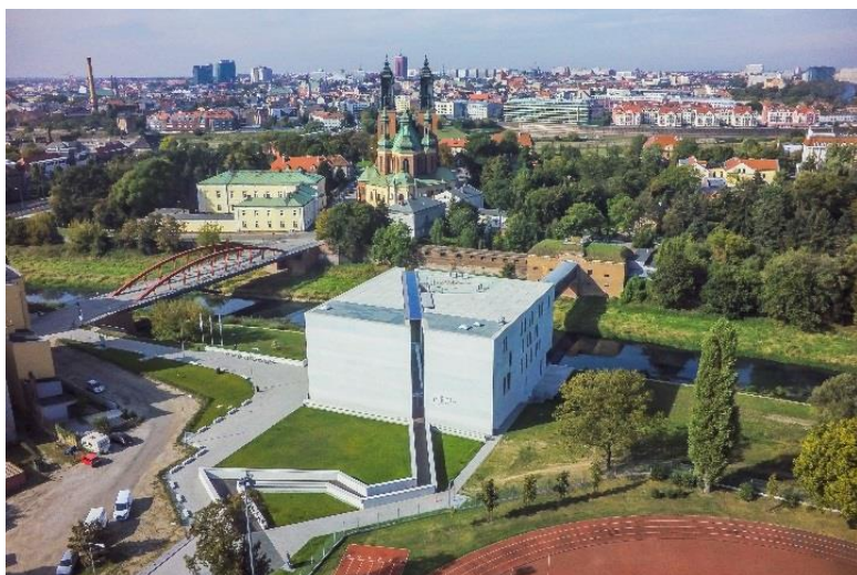
Ryc. 3. Brama Poznania i Ostrów Tumski