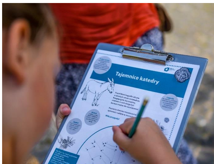
Ryc. 11. Pierwsze zadanie podczas poznawania tajemnic katedry