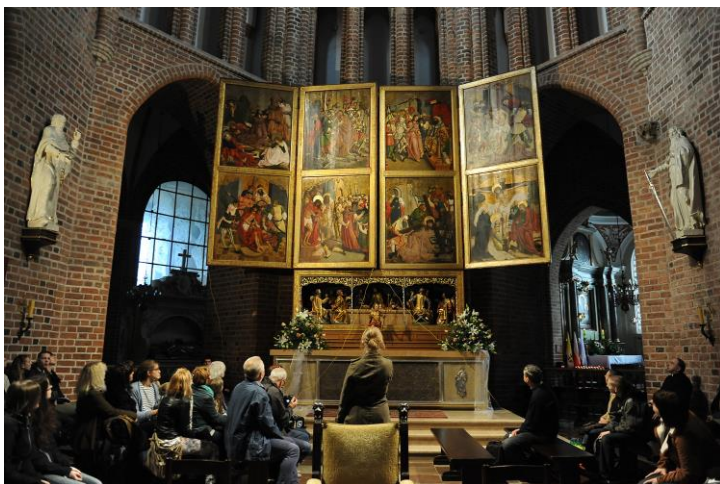
Ryc. 8. Prezentacja ołtarza głównego

Tekst promujący wydarzenie: Skupiają na sobie wzrok już od wejścia do katedry. Jak powstały? Co przedstawiają? Prezentacja otwarcia i zamknięcia ołtarza oraz obserwacja witraży. Na wydarzenie składała się wycieczka z prezentacją witraży oraz demonstracją otwierania i zamykania skrzydeł ołtarza (ryc. 8).