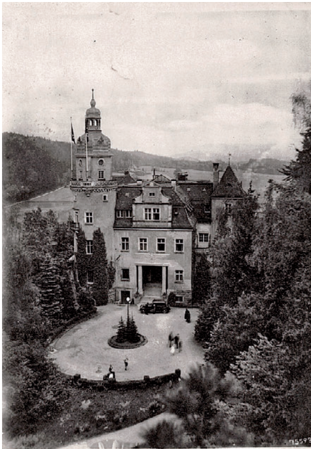
Hirschberg im Riesengebirge - Reichsschulungsburg