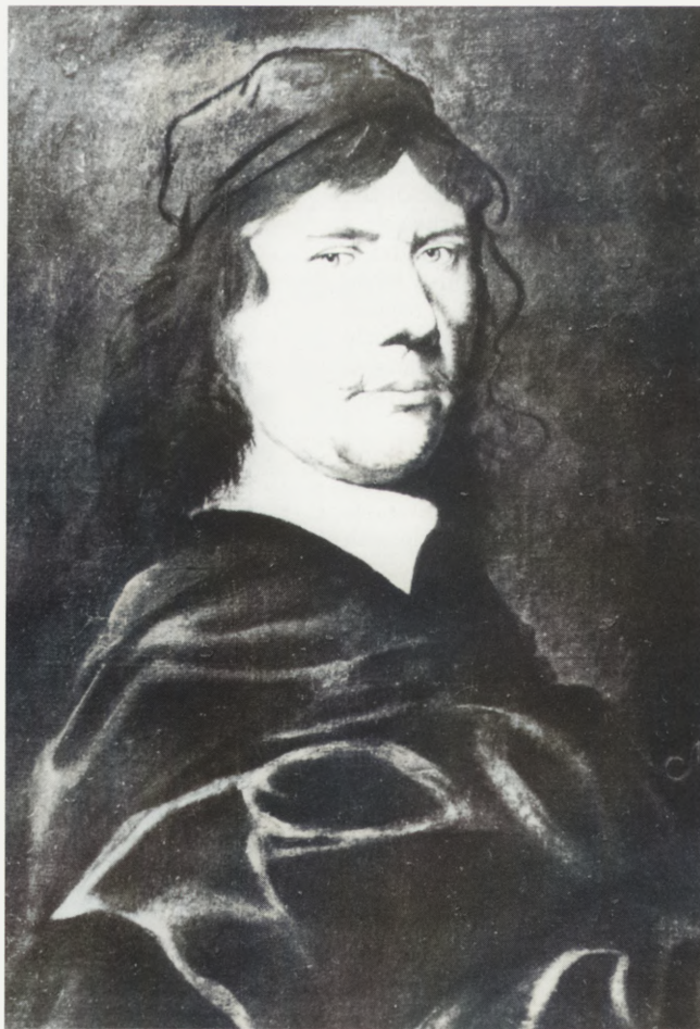
Autoportret Michaela Willmanna z 1682 r. Wg E. Kloss, Michael Willmann. Leben und Werke eines deutschen Barockmalers , Breslau 1934

Zakończenie konserwacji obrazów z Lubiąża jest okazją aby serdecznie podziękować wszystkim zespołom konserwatorskim, które w ciągu minionych kilkunastu lat przywróciły piękno arcydziełom Willmanna w kościołach warszawskich.