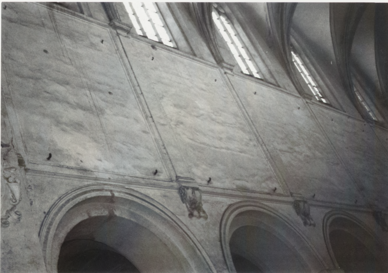
3. Ściana nawy głównej kościoła klasztorowego w Lubiążu, stan w 1998 r. Widoczne haki mocujące wiszące tu dawniej obrazy. 3. Wall of the main nave in the abbey church in Lubiąż, state in 1998. Visible hooks formerly used for hanging canvases.

— W kościele p.w. Wszystkich Świętych (pl. Grzybowski) — Męczeństwo św. Filipa , Męczeństwo św. Jakuba Starszego , Męczeństwo św. Macieja , Męczeń-