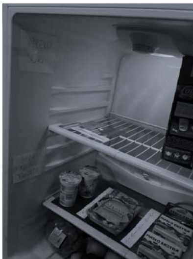
Rysunek 4. Rozmieszczenie produktów w lodówce