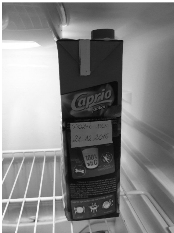
Rysunek 5. Przykładowa etykieta z datą ważności