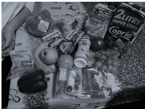
Rysunek 3. Selekcja produktów