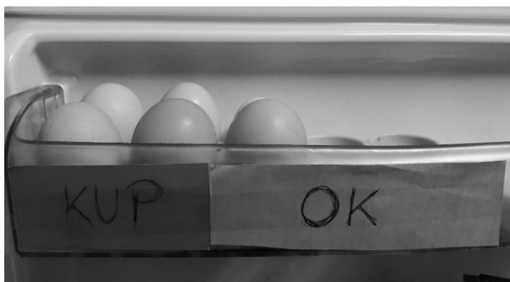
Rysunek 6. Dwupojemnikowy system Kanban