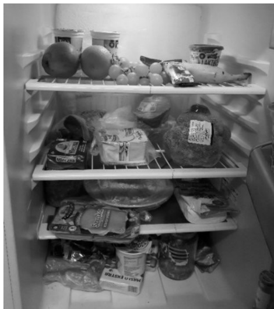
Rysunek 2. Lodówka przed wdrożeniem 5S