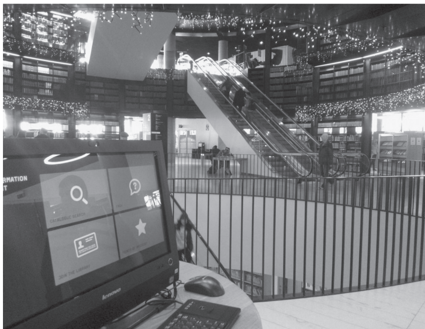
Fot. 4. Rotunda książek w The Library of Birmingham

W samym sercu The Library of Birmingham znajduje się rotunda z regałami wypełnionymi 400 tys. książek (fot. 4). Skalę wielkości i bogactwa wiedzy tego miejsca można określić, przytaczając słowa Jana Wiktora: „Biblioteka gromadzi bogactwa wieków i pokoleń, mogą z nich czerpać bez miary nieprzeliczone tłumy, a nigdy nam nie poskąpi ani mądrości, ani światła”.