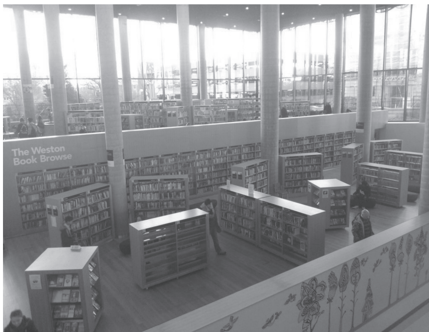
Fot. 2. Wypożyczalnia główna w The Library of Birmingham

Book Browse, czyli wypożyczalnia główna (fot. 2), znajduje się na podwyższeniu parteru, a można się tam dostać za pomocą ruchomych schodów. W całej bibliotece obowiązuje wolny dostęp do półek. Zbiory oznaczone żółtą metką mogą być wypożyczone, a z pozostałych można korzystać jedynie na miejscu.