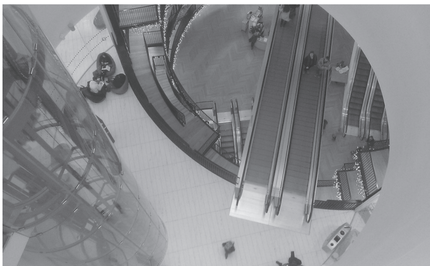
Fot. 5. Szklana winda w The Library of Birmingham

Z czwartego na siódme piętro można dostać się klatką schodową lub skorzystać ze specjalnej przeszklonej windy przypominającej kapsułę czasu (fot. 5). Piętra piąte, szóste i ósme są niedostępne dla czytelników. Wstęp do nich mają jedynie bibliotekarze i inni pracownicy biblioteki. Na trzech zamkniętych kondygnacjach znajdują się magazyny i pomieszczenia służbowe.