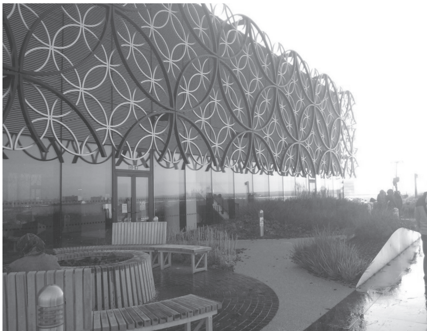
Fot. 6. Tajemniczy ogród w The Library of Birmingham