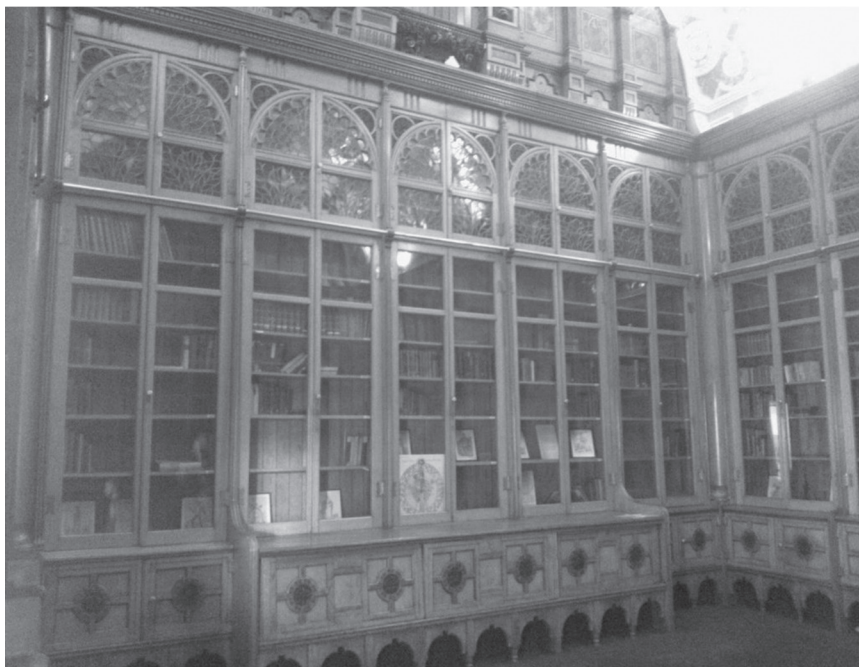
Fot. 7. Shakespeare Memorial Room w The Library of Birmingham