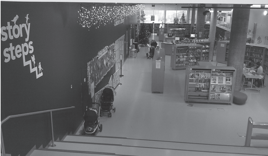
Fot. 3. Schody historii w The Library of Birmingham