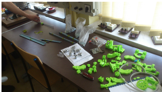
Fot. 1. Elementy potrzebne do złożenia drukarki 3D

Aby rozpocząć budowę, potrzebowaliśmy wydrukowanych na innej drukarce plastikowych elementów ramy, dodatkowych silników krokowych, dyszę ekstrudera, elektronikę sterującą, dodatkowych rezystorów podgrzewających blat roboczy, paski oraz elementy metalowe. Większość wymienionych przedmiotów można zakupić w lokalnych sklepach z materiałami budowlanymi, pozostałych należy szukać u osób, które same tworzą drukarki przestrzenne i chętnie udzielają pomocy.