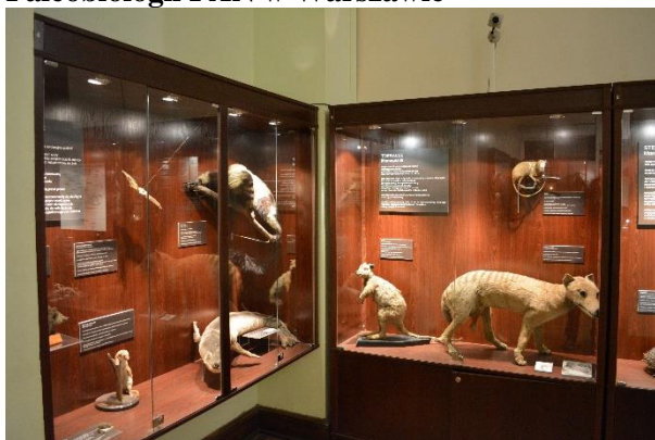
Ryc. 3. Eksponaty umieszczone w szklanych gablotach w Muzeum Ewolucji Instytutu Paleobiologii PAN w Warszawie