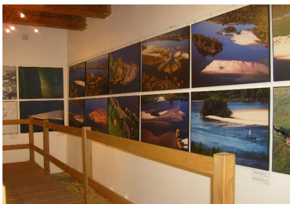
Ryc. 7. Czasowa wystawa fotograficzna w Muzeum Przyrodniczym w Kazimierzu Dolnym