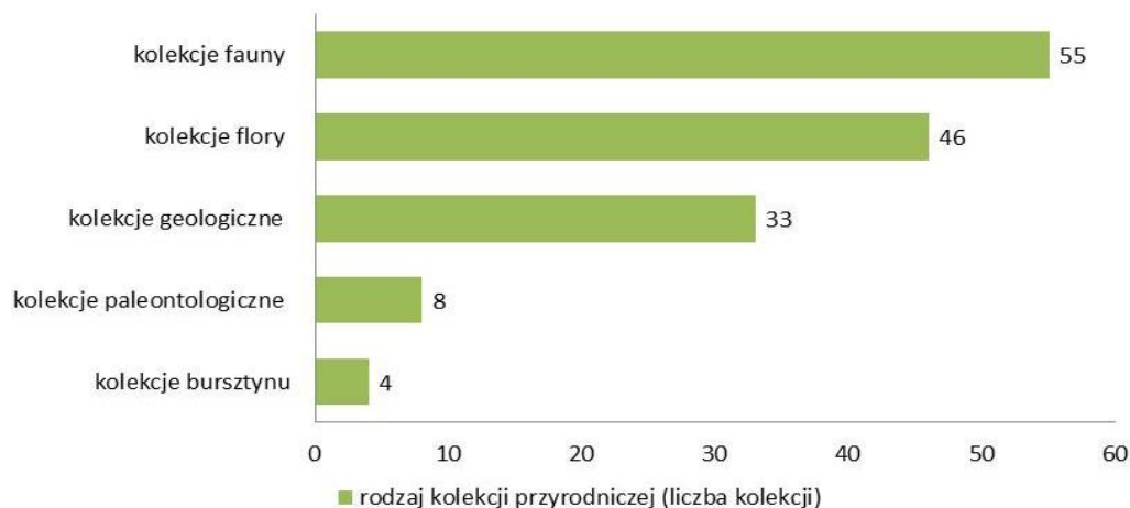
Ryc. 2. Popularność rodzajów kolekcji przyrodniczych w muzeach przyrodniczych

Muzea przyrodnicze różnią się między sobą pod wieloma względami. Największe różnice obserwowano w rodzajach kolekcji przyrodniczych, ich wielkości, oryginalności oraz sposobach ich prezentacji. W muzeach wyróżniono pięć rodzajów kolekcji przyrodniczych, obejmujących okazy: fauny, flory, geologiczne, paleontologiczne i bursztynu. Rycina 2 prezentuje popularność poszczególnych grup.