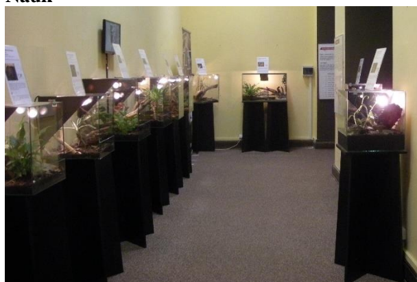
Ryc. 8. Wystawa czasowa „Fascynujący świat pajaków i skorupiaków” w Muzeum Ewolucji Instytutu Paleobiologii Polskiej Akademii Nauk