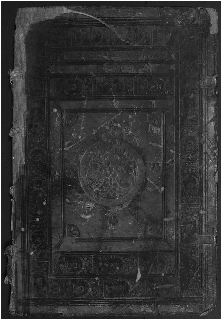
Il. 1. Oprawa starodruku z 1518 r. (górna okładzina), tzw. drugi introligator wileński, Wilno, 1560 r.; Archiwum Archidiecezjalne w Gnieźnie