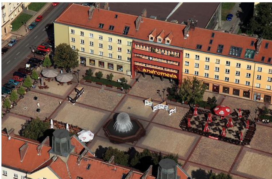
Ryc. 2. Plac Baczyńskiego w Tychach

W rezultacie „nowy” pl. Baczyńskiego stał się jednym z najbardziej reprezentacyjnych miejsc w mieście (ryc. 2). Od maja do września odbywają się tutaj niedzielne imprezy kulturalne, a w grudniu plac jest miejscem kilkudniowego Jarmarku Bożonarodzeniowego.