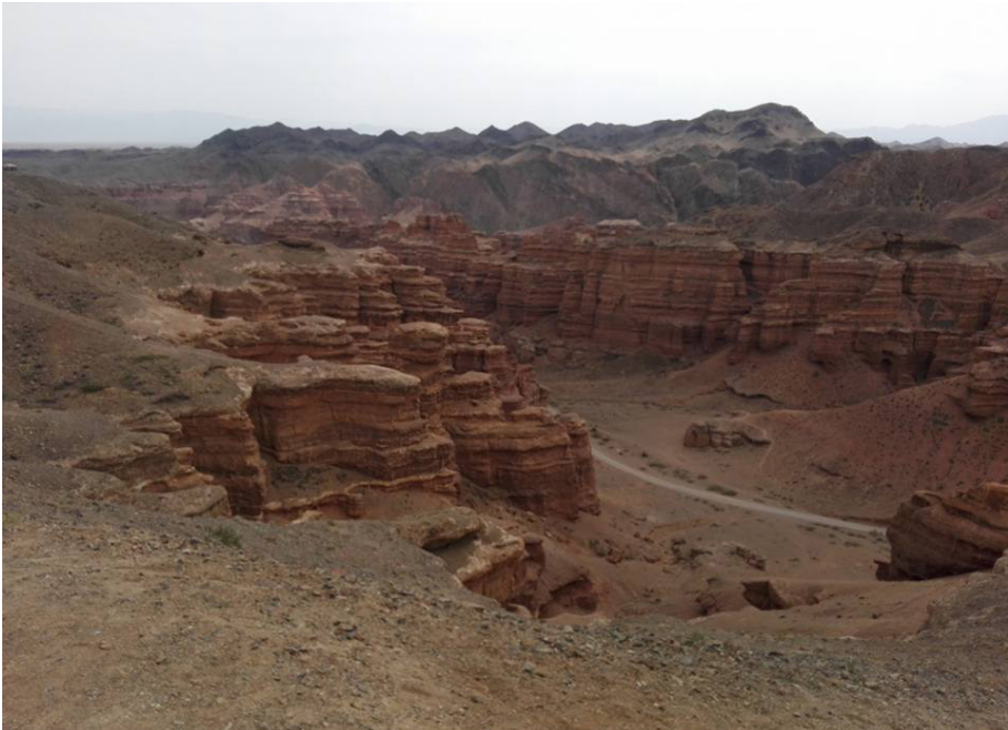
Fot. 3. Kanion Czaryński w Kazachstanie.