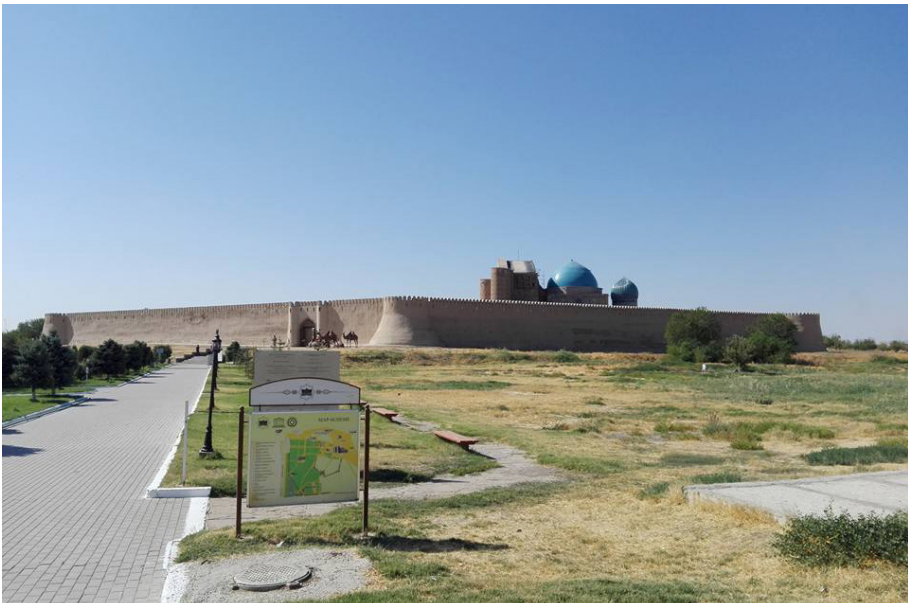
Fot. 4. Turkiestan.