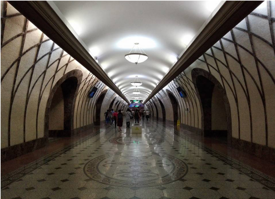
Fot. 1. Wnętrze metra w Ałmaty.