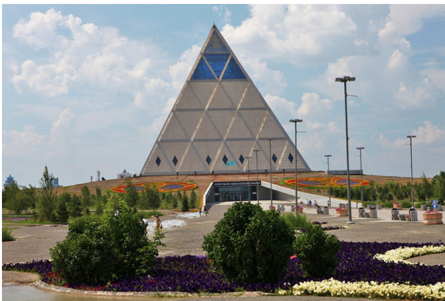
Fot. 8. Piramida Pokoju i Pojednania.