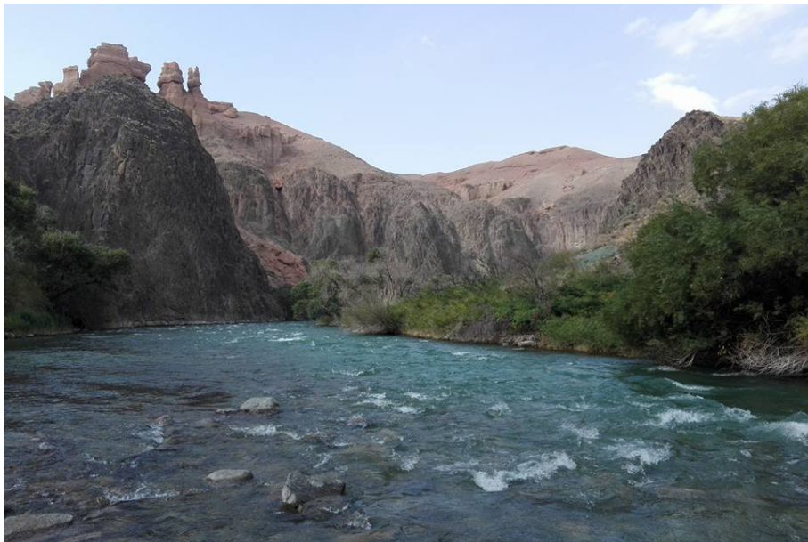
Fot. 2. Jezioro w Kanionie Czaryńskim w Kazachstanie.