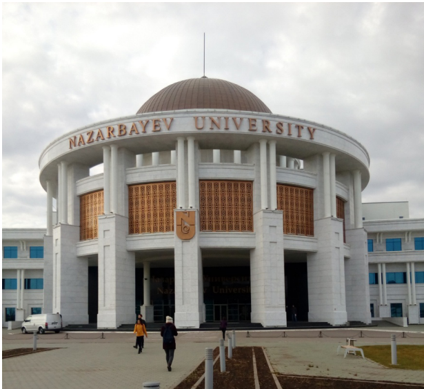
Fot. 5. Budynek główny Uniwersytetu im. Nursułtana Nazarbajewa w Astanie.