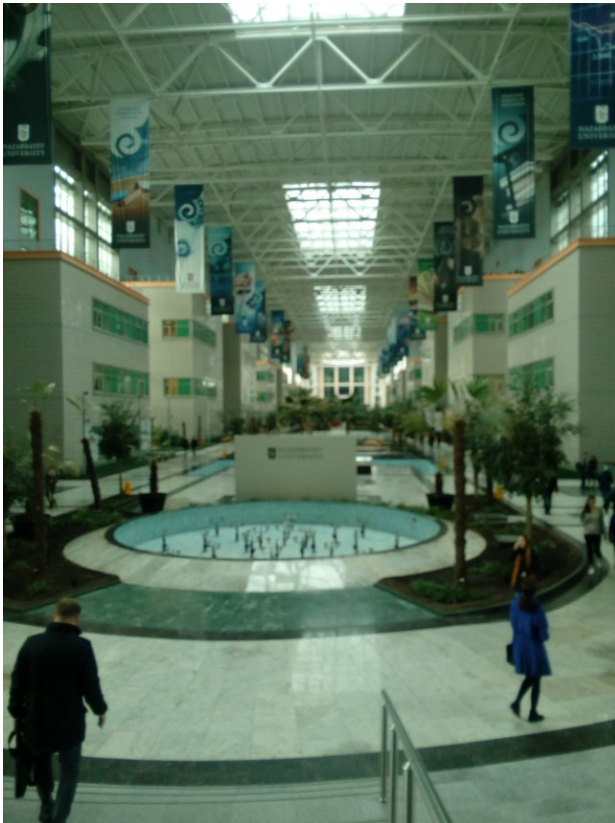
Fot. 6. Holl główny Uniwersytetu im. N. Nazarbajewa, prowadzący m.in. do Biblioteki i Czyteln. Źródło: archiwum prywatne autorki (październik 2017 r.).