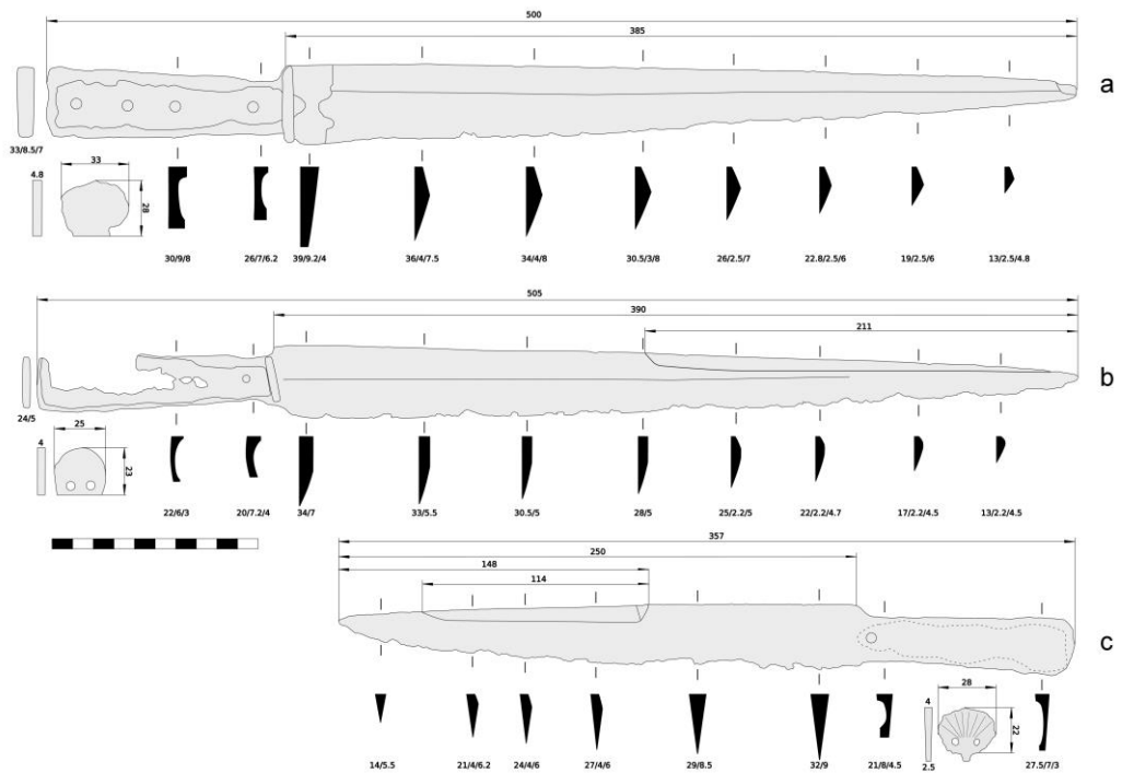
Fig. 1. General view and basic geometric parameters of the kords I (a), II (b) and III (c).

P. Žákovský's classification, it can be attributed to Type A 2 , Ia 4 , -, -, t 6 . Geometric dimensions and cross-section of the kord are shown in the figure (Fig. 1, c). Its weight is 238 g (9 g without the nagel weight). The total length is 357 mm, of which the blade is 250 mm, being knife-shaped with a wedge-shaped cross-section (type A 2 ). The blade width at the nagel is 32 mm, and the spine thickness varies from 9 mm near the nagel to 5.5 mm at the tip. A bayonet edge begins at 148 mm from the tip on the left side of the blade, which, however, does not extend up to the end and disappears after 114 mm of its length. The transition from the spine to the handle is made with a “step” (type D), with the handle slightly expanding (Version a) from the nagel (21 mm) to the rounded back part (28 mm) (Version 4) and having a 7-8 mm thick spine. On its right side, there is a depression extending almost throughout the entire length, where remains of the rivets should be located; the location of the rivets, however, has not been found. The kord has an almost round nagel (28x22x4 mm in size) and two decorative holes (Version t 6 ). On its surface, straight radial lines can be discerned, which are typical for wavy-edged nagels.