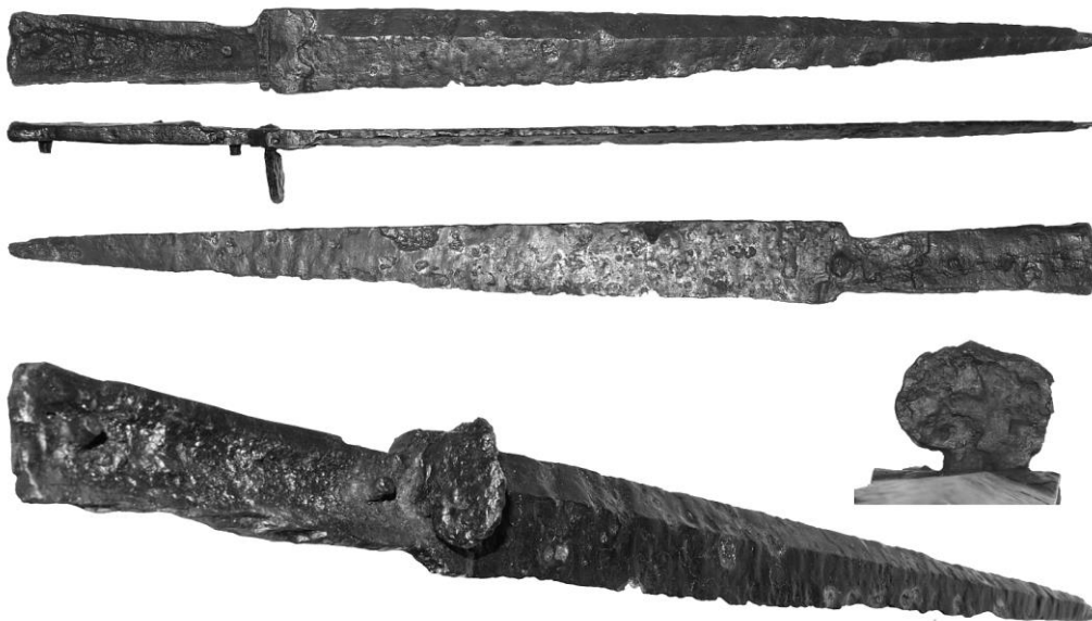
Fig. 2. General view of Kord No. 1 (inv. no. TKB - 19445/2).

analogues with a clear dating complicates the chronological placement of the kords described; however, we can date them from the period between the 15 th to the early 16 th century in the first approximation.