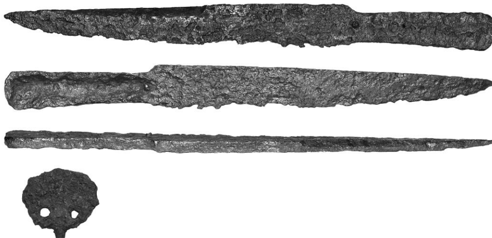
Fig. 4. General view of Kord No. 3 (inv. no. ТKB - 19445/1).