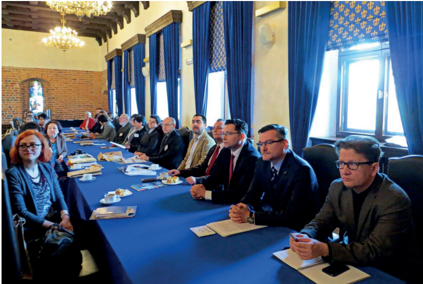
Ryc. 5. Zaproszeni goście na uniejowski sejmik, 16.04.2016