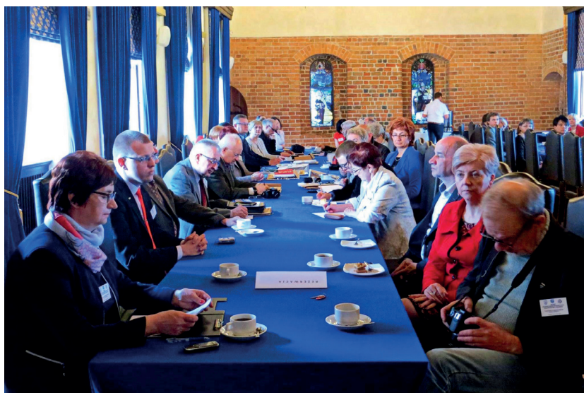
Ryc. 6. Przedstawiciele towarzystw regionalnych z terenu województwa łódzkiego podczas obrad sejmikowych, 16.04.2016