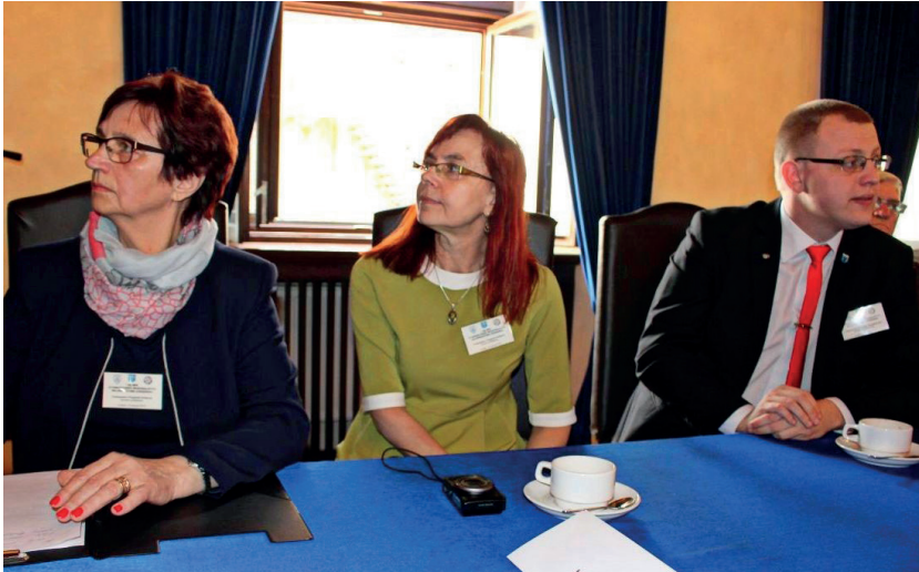
Ryc. 1. Organizatorzy I Sejmiku Stowarzyszeń Regionalnych Województwa Łódzkiego w Uniejowie, 16.04.2016

wojewódzkiej w Uniejowie. Trud organizacyjny wzięły na siebie Towarzystwo Przyjaciół Uniejowa i Towarzystwo Przyjaciół Zduńskiej Woli (ryc. 1) 3 .