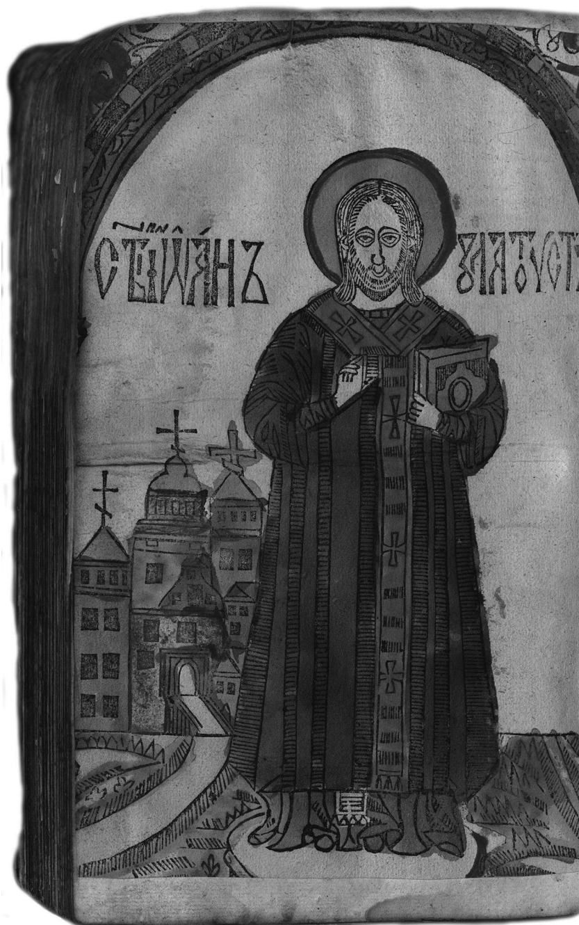
Иллюстрация 2. Гравюра (вставная), после столбцов 2737-2740 (экземпляр К16-18/Ср161). Иоанн Златоуст. Беседы на 14 посланий апостола Павла. Киев, 1623