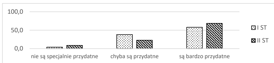
Rysunek 2. Opinia respondentów na temat: Czy prezentacje studenckie są potrzebne w toku studiów, aby dobrze przygotować się do przyszłej pracy zawodowej?