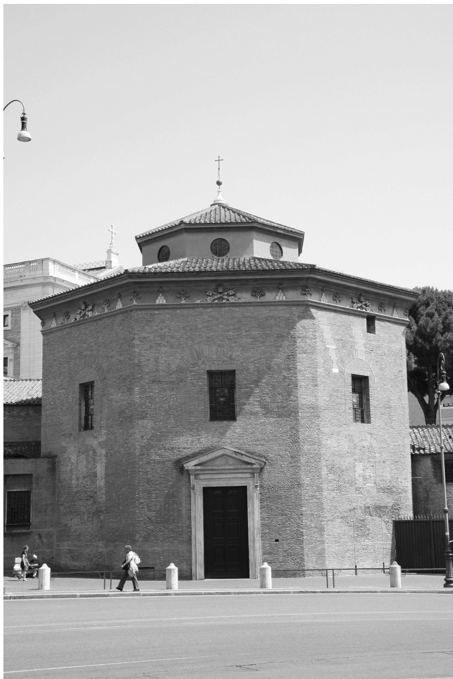
II. 2. Baptysterium laterańskie od strony północno-zachodniej, fot. M. Ozóg