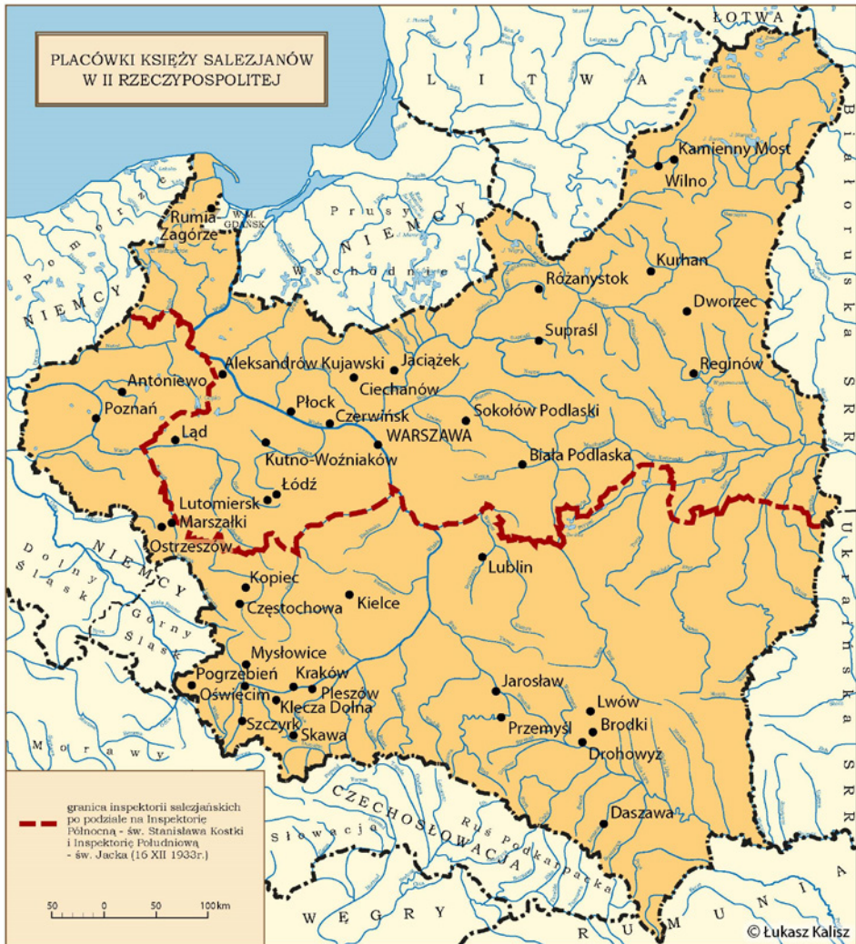
Mapa 1. Placówki salezjańskie w okresie II Rzeczypospolitej.