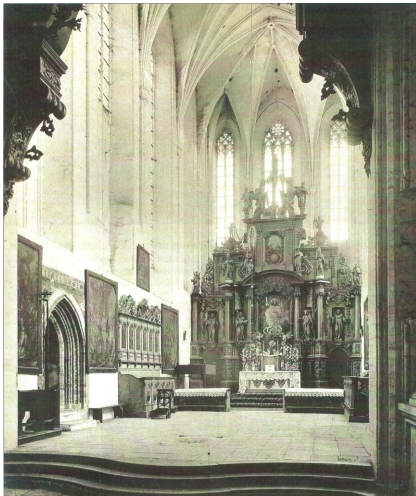
Il. 2. Wnętrze prezbiterium kościoła pw. św. Jakuba, 1887 r. – A. Soćko, Trzy etapy budowy , s. 57