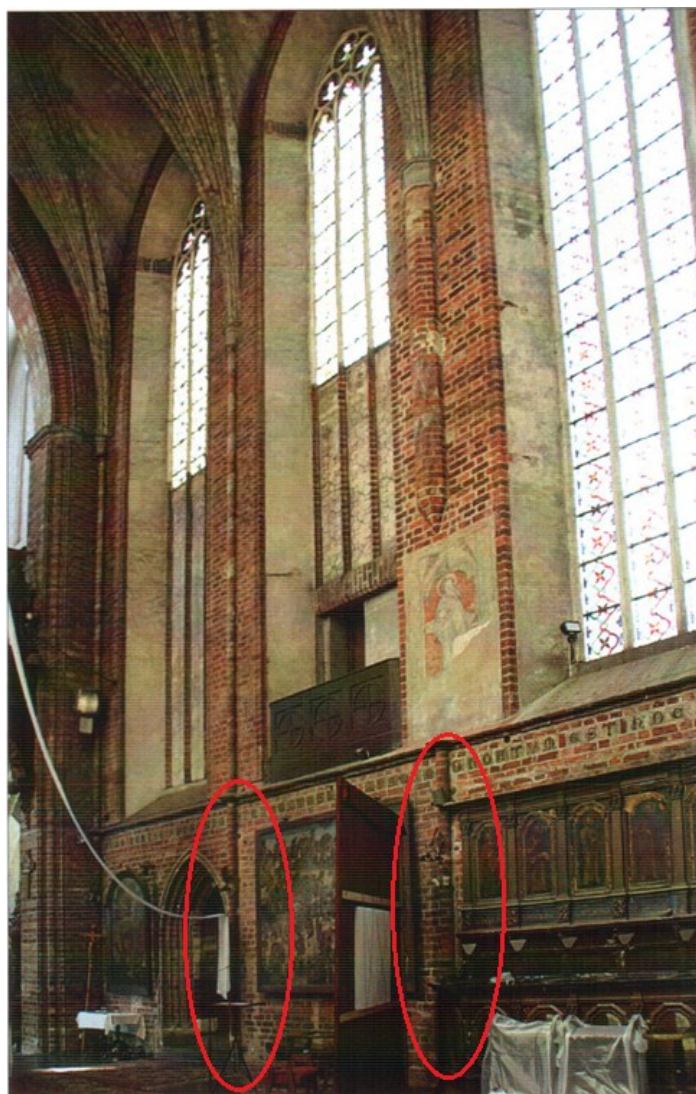
Il. 3. Współczesne wnętrze chóru kościoła św. Jakuba; kółka wskazują na słuzki, których na fotografii z 1887 r. nie widać – A. Soćko, Trzy etapy budowy , s. 57