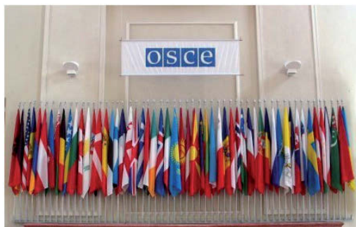
Ryc. 4. Organizacja Bezpieczeństwa i Współpracy w Europie.

W przyjętym w roku 1975 w Helsinkach akcie końcowym Konferencji Bezpieczeństwa i Współpracy w Europie (KBWE) nie było jednak żadnego odniesienia do problemów mniejszości w państwach europejskich. Ochrona praw mniejszości narodowych była i jest traktowana jako część ochrony praw człowieka.