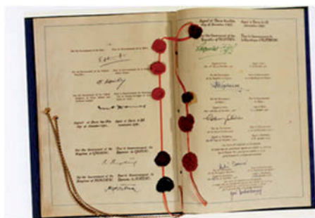
Ryc. 1. Europejska Konwencja Praw Człowieka

Wśród przedstawicieli państw uczestniczących w negocjowaniu tekstu Konwencji nie było zgody co do jednej wspólnej definicji i koncepcji mniejszości narodowych. Dlatego przyjęto rozwiązanie pragmatyczne – aby zagwarantować określone prawa osobom należącym do mniejszości narodowych. Natomiast państwom, które przystąpią do Konwencji, należy pozostawić swobodę w zakresie uznawania określonych grup zamieszkujących ich terytorium za mniejszości narodowe. Od samego państwa zależy więc, czy uznaje ono określoną mniejszość narodową, co osłabia wymowę Konwencji i jej funkcję zagwarantowania praw osobom należącym do mniejszości narodowych. Suwerenność państwa odgrywa w tym wypadku decydującą rolę, natomiast reguły i ustalenia prawa międzynarodowego mają jedynie charakter fakultatywny.