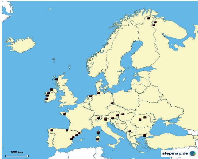
Ryc. 5. Mniejszości narodowe w Europie.

1 grudnia 2009 roku Traktat o Unii Europejskiej, zmodyfikowany przez Traktat lizboński, wymienia „prawa osób należących do mniejszości” wśród wartości UE (art. 2 Traktatu), które każde państwo kandydujące powinno szanować (art. 49 Traktatu).