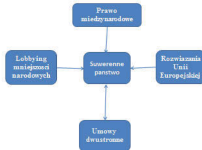
Ryc. 6. Suwerenne państwo w ramach międzynarodowej i europejskiej polityki dotyczącej ochrony mniejszości narodowych (opracowanie autora).

Lobbying mniejszości narodowych w poszczególnych krajach jest zbyt słaby, aby móc decydująco wpłynąć na kierunek polityki mniejszościowej w obrębie zamieszkiwanych przez te mniejszości krajów.