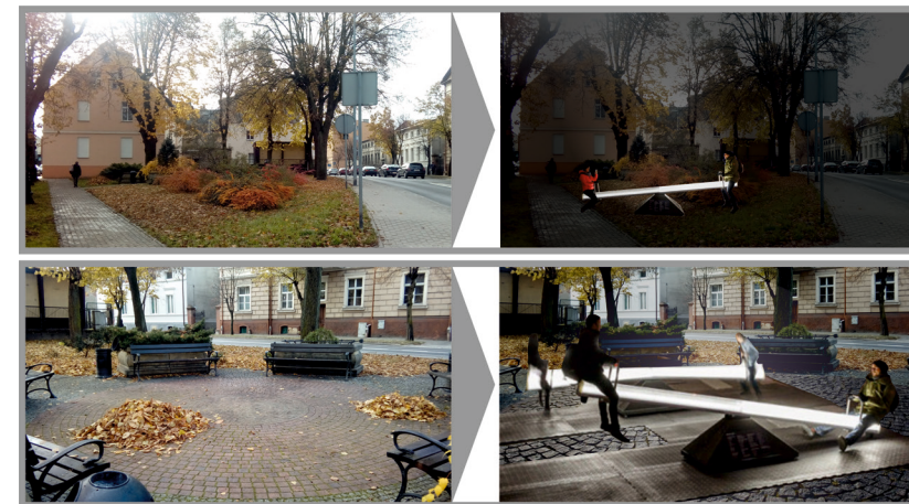
Ryc. 5. Wizualizacje możliwych zmian przestrzeni sportowo-rekreacyjnych.