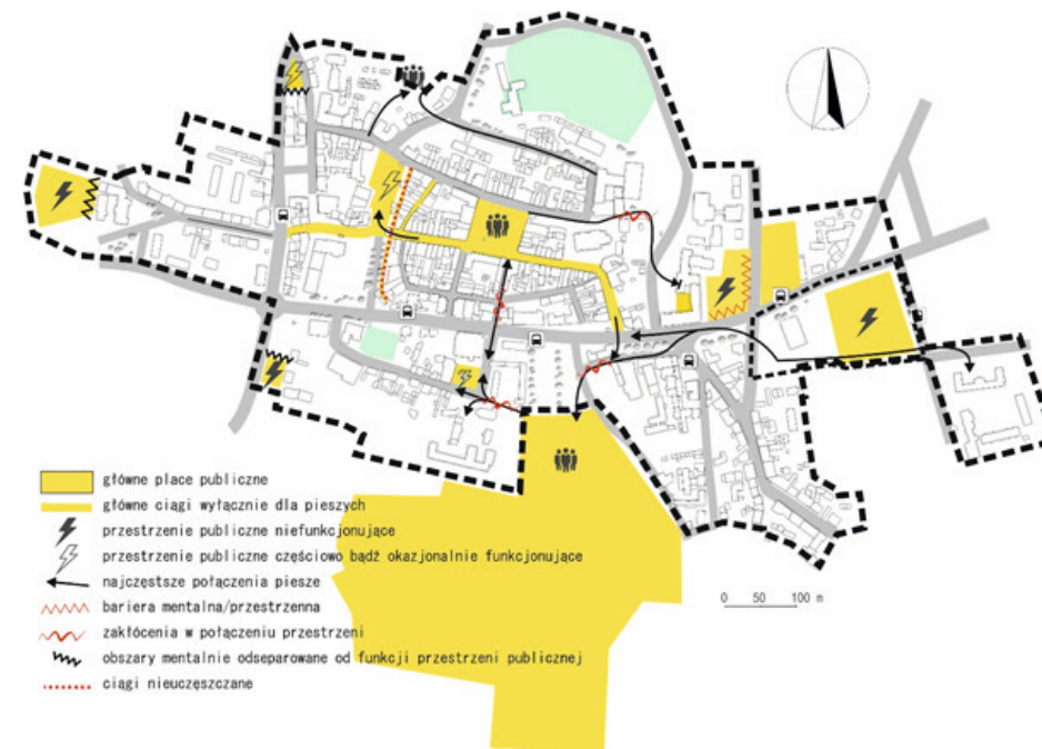
Ryc. 1. Analiza powiązań i funkcjonowania przestrzeni miejskich w śródmieściu Chojnic.

Wpisywanie się i włączanie sztuki w obszar oznacza oczywiste więzy – fizyczne i widzialne oraz więzy niewidzialne. Do tych ostatnich należą m. in. przywołanie historii przestrzeni i pobudzenie pamięci o niej. To te dzieła, które nawiązują do dziedzictwa danego miejsca są nośnikami tożsamości, a przez to proces ich wrastania w tkanę miasta staje się bardziej naturalny niż w przypadku elementu obcego, osadzonego bez kontekstu 14 .