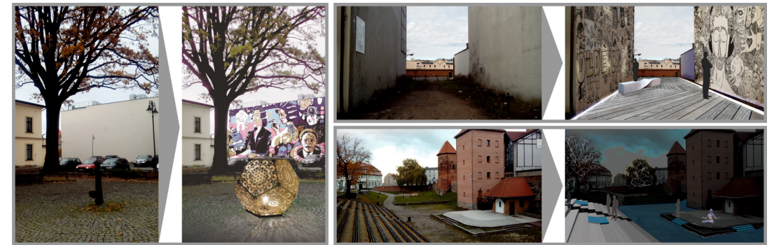
Ryc. 4. Wizualizacje koncepcji dla artystycznych przestrzeni publicznych

Opracowanie własne na podstawie mapy zasadniczej