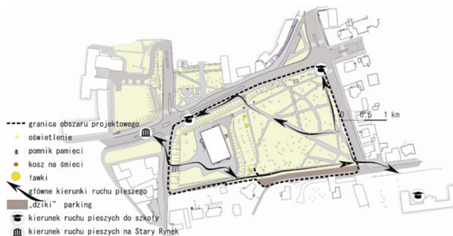
Ryc. 2. Analiza stanu zagospodarowania obszaru projektowego