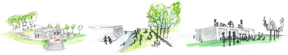
Ryc. 6. Nowe aktywności na obszarze projektowym Wzgórza Ewangelickiego