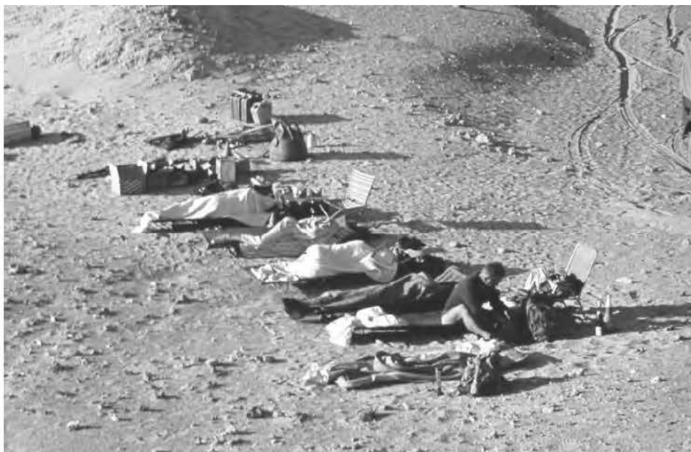
Obr. 6 Táboření ve Východní poušti při jednom z přesunů mezi Káhirou a Núbíí

ležité pro období pobytu expedice mimo kontakt s osídlenými oblastmi. 23