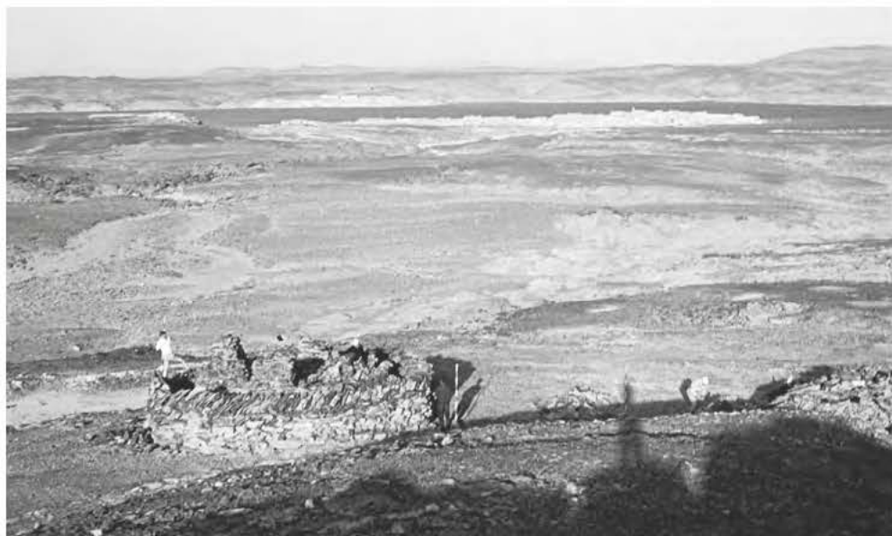
Obr. 7 Výzkum lokality Wádí Kitna v roce 1965

Dobová dokumentace obsahuje mnoho podrobností, které se týkají přípravy lodi a jejího vybavení, náčrty plavidla a další detaily. Nejintenzivnější stavební práce probíhaly v prosinci 1960 a lednu 1961. Materiál (součásti trupu, trubkový materiál, plachty pro krytí ubikací, ale také lodní lampy, prkna na paluby, kormidelní zařízení, kotvy) bylo nutno objednávat, zařizovat dodání, dohlížet na montáž atd. Konstatování „Vzhledem k tomu, že veškeré řemeslné práce jsou zadávány socialistickému sektoru (jak jinak není možné) a každé pracoviště má nyní vlastní maximální plán – je nutné věnovat nákupům či obstarání úzkoprofilového materiálu a prosazením provedení neplánovaných prací maximální úsilí...“ 27 hovoří za mnohé a mimo jiné dokládá, že i když státní moc rozvoji egyptologie v 60. letech díky úsilí profesora Žáby nebránila, rozhodně také nešlo o státem protežovaný či chráněný projekt. Velkou roli v jeho úspěšné realizaci sehrálo osobní nasazení členů Žábova týmu na různých úrovních a Žábova schopnost najít řešení – a to včetně využití některých aspektů dobové politické rétoriky, pokud to bylo nutné.