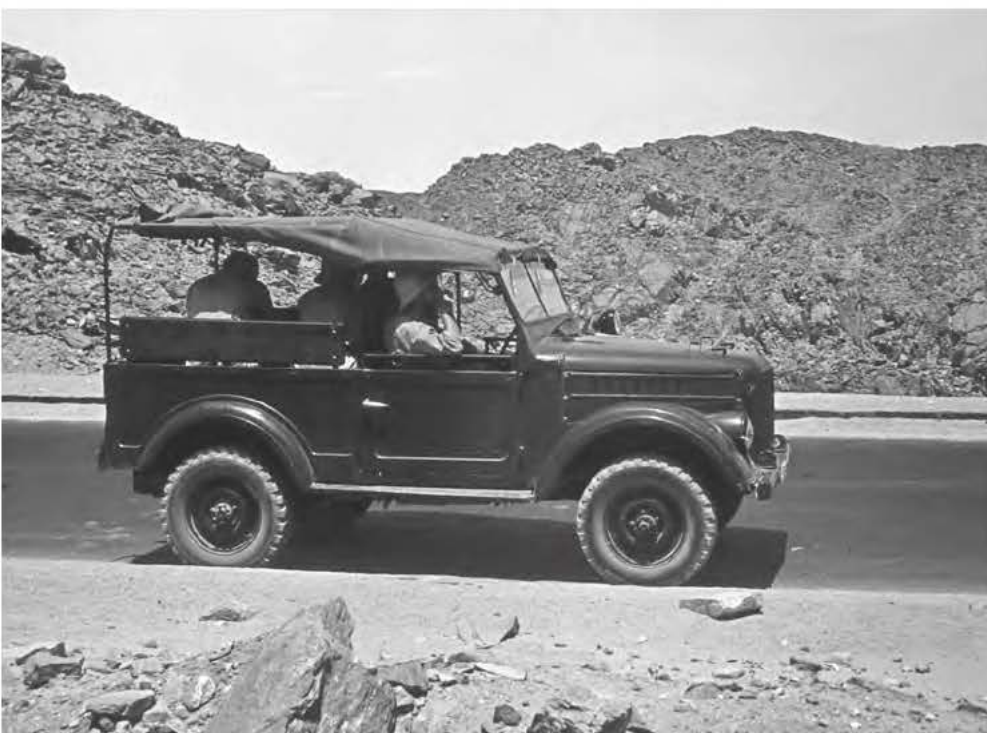
Obr. 4 Terénní vozidlo Čs. egyptologického ústavu