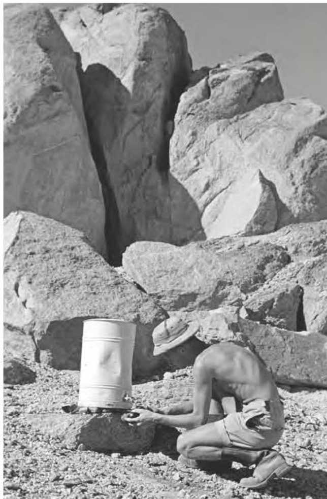
Obr. 5 Jaromír Málek u zásobnice s pitnou vodou během zastávky v poušti

Písemné prameny k první expedici do Núbie jsou klíčové pro poznání zázemí a materiální připravenosti československých egyptologů. Než se mohli vydat do vzdálené a poměrně těžko dostupné Núbie a začít svou vědeckou činnost v terénu, bylo třeba vykonat mnoho práce. Výprava uskutečněná v roce 1961 již měla připravené zázemí v Káhiře, ale její hlavní úkol měl těžiště mimo lidské osídlení (Núbijci již své vesnice a města opouštěli). Bylo nutné vytvořit přijatelné zázemí pro velmi mobilní expedici, a tak bylo rozhodnuto opatřit za tímto účelem vlastní plavidlo. Pobyt v Egyptě a v Núbii zahrnoval několik měsíců, od dubna do prosince, a na tuto dobu bylo potřeba sehnat odpovídající vybavení od lodních součástí a lodního příslušenství (lana, skládací lůžka, vařiče, lednice atd.) přes přístroje, oblečení a séra proti uštknutí jedovatými hady a štíry po trvanlivé potraviny, které byly dů-