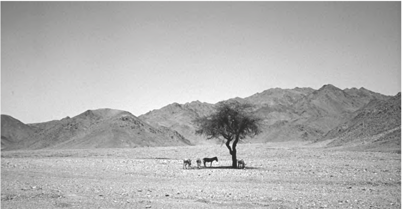
Obr. 1 Fauna a flóra ve Východní poušti