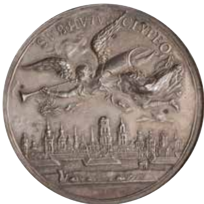
Il. 1 Medal przedstawiający we właściwym świetle osiągnięcia polityczno-militarne Jana III Sobieskiego, zawierający wyobrażenie famy głoszącej sławę królewskiego imienia (na rewersie), Luis Varou, Gdańsk, 1677 (?), srebro, śr. 39,4 mm, bity, Kraków, Muzeum Narodowe, nr inw. MNK VII-Md-474.

medalu przesunęli na ok. 1693 rok i powiązali z dziesiątą rocznicą odsieczy wiedeńskiej 7 . W rzeczywistości powyższą kwestię nie sposób jednoznacznie rozstrzygnąć. Autor niniejszego artykułu jest zdania, iż istnieją analogie pomiędzy kompozycją rewersu medalu autorstwa Luisa Varou a wcześniejszą o dziewięć lat winietą dzieła Jana Heweliusza, Cometographia... (Gdańsk 1688), opisaną szczegółowo w części artykułu dotyczącej analizy ikonograficznej medalu. Opowieścią o Famie inspirował się również anonimowy autor rewersu żetonu dedykowanego Michałowi Korybutowi Wiśniowieckiemu, uświetniającego jego koronację w Krakowie, 29 września 1669 roku 8 . Data 1677 jest więc możliwa do zaakceptowania. Pewne wątpliwości budzi jednak sam fakt wyboru wykonawcy przez władze Gdańska. W latach 70. XVII wieku autorem większości zamówień gdańskich władarzy, zwłaszcza tych gloryfikujących Jana III Sobieskiego, był Jan Höhn (Hoehn) mł. (zmarły w 1693 roku). W latach 80. XVII wieku poświęcił się całkowicie pracy na potrzeby dworu pruskiego. Wyjątek stanowił m.in. medal z 1683 roku upamiętniający udział Jana III Sobieskiego w odsieczy wiedeńskiej. Wkrótce po śmierci Höhna mł. stanowisko rytownika stempli do monet