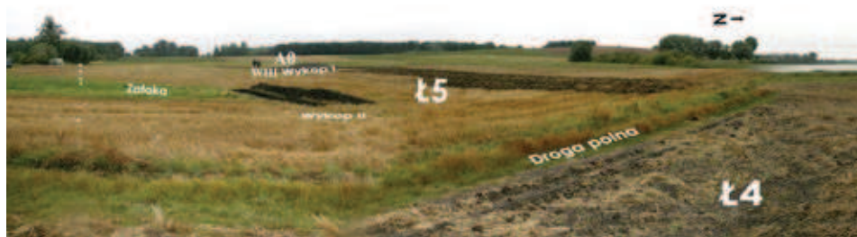
Ryc. 6. Fragment stan. Ł5 Fig. 6. Fragment of Site Ł5

ilości znalezisk z 2004 roku i nie ma pewności, czy posiadamy wyczerpujące dane co do znalezisk związanych ze skarbem z 1861 roku. Uogólniając jednak, uznać można, że skarb z Tarnowa (Łekna) — łącznie część I, II i III — należy do skarbów dużych.