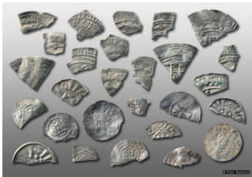
Ryc. 7. Wybór monet III części skarbu (dirhemy i monety zachodnioeuropejskie) z Tarnowa (Łekna); fot. P. Namiota

Fig. 7. Selection of coins from Part III of the hoard (dirhams and West European coins) from Tarnowo (Łekno); photog. P. Namiota