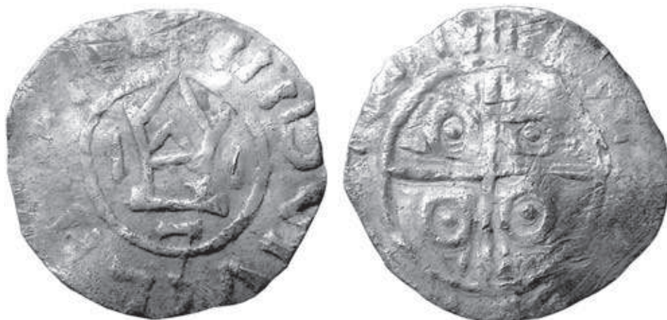
Ryc. 3. Denar Bolesława Chrobrego z Tarnowa Pałuckiego. Powiększenie — średnica oryginału 18,5–19,5 mm; za BOGUCKI 2006b, ryc. 1 i tab.1

Fig. 3. Denar of Bolesław the Brave from Tarnowo Pałuckie. Magnification — diameter of the original specimen 18.5–19.5 mm; after BOGUCKI 2006b, Fig. 1 and Tab. 1