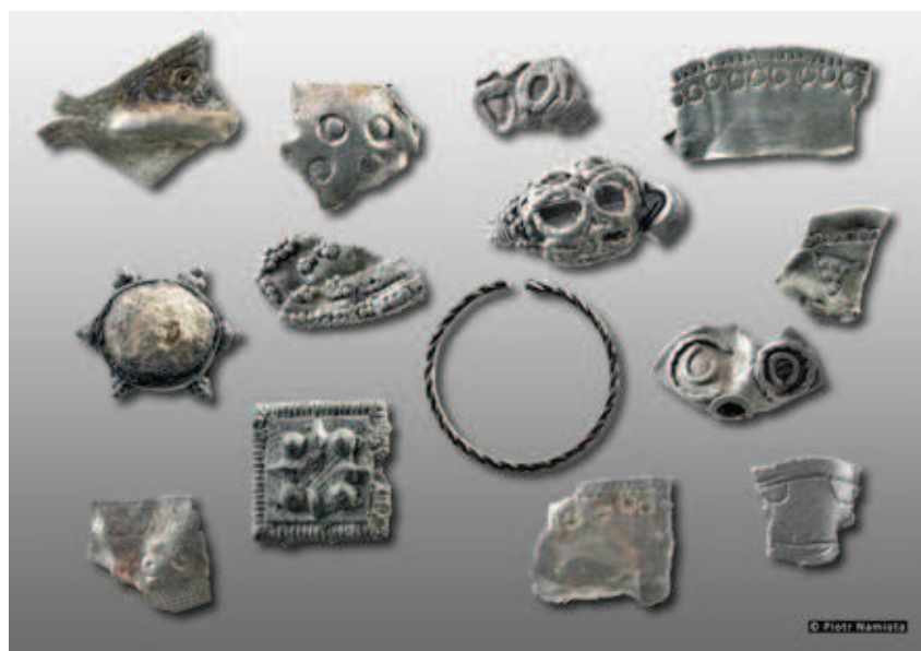
Ryc. 8. Wybór biżuterii z III części skarbu z Tarnowa (Łekna); fot. P. Namiota

Fig. 7. Selection of coins from Part III of the hoard (dirhams and West European coins) from Tarnowo (Łekno); photog. P. Namiota