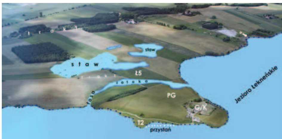
Ryc. 4. Rekonstrukcja środowiska naturalnego w rejonie grodu i klasztoru w Łeknie, zdjęcie lotnicze; fot. Archiwum Urzędu Gminy Wągrowiec, oprac. A.M. Wyrwa

Fig. 3. Denar of Bolesław the Brave from Tarnowo Pałuckie. Magnification — diameter of the original specimen 18.5–19.5 mm; after BOGUCKI 2006b, Fig. 1 and Tab. 1