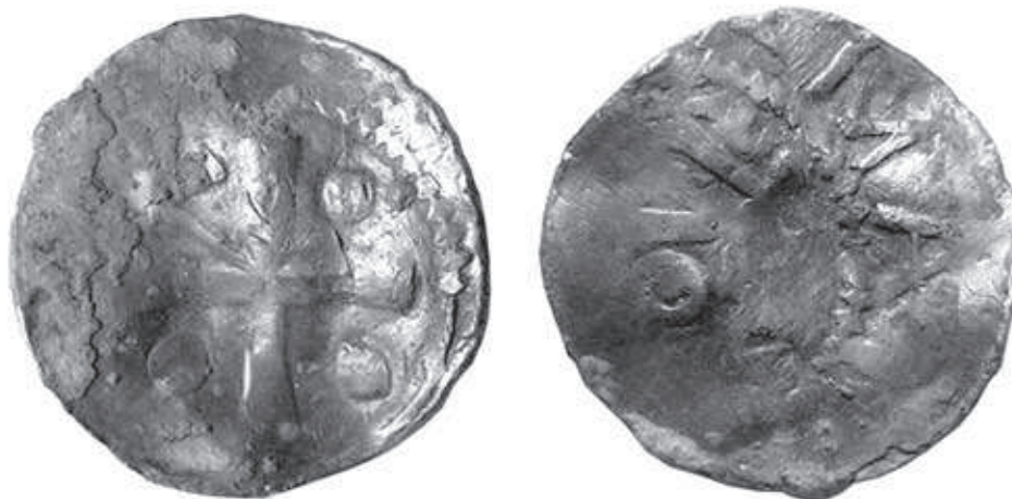
Ryc. 9. Łekno. Denar Ottona III. Powiększenie — średnica oryginału 16 mm; za BOGUCKI 2006a, s. 100, ryc. 10