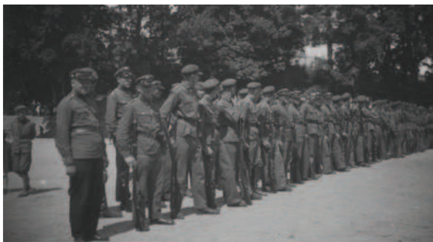
Fot. 1. Uroczystość Związku Strzeleckiego w Krzemieńcu – 6 sierpnia 1933 r.

w Czarukowie. Na terenie powiatu łuckiego wychowanie fizyczne kobiet było prowadzone w trzech oddziałach ZS: Kiwerce, Ławrów i Łuck-Miasto 32 .