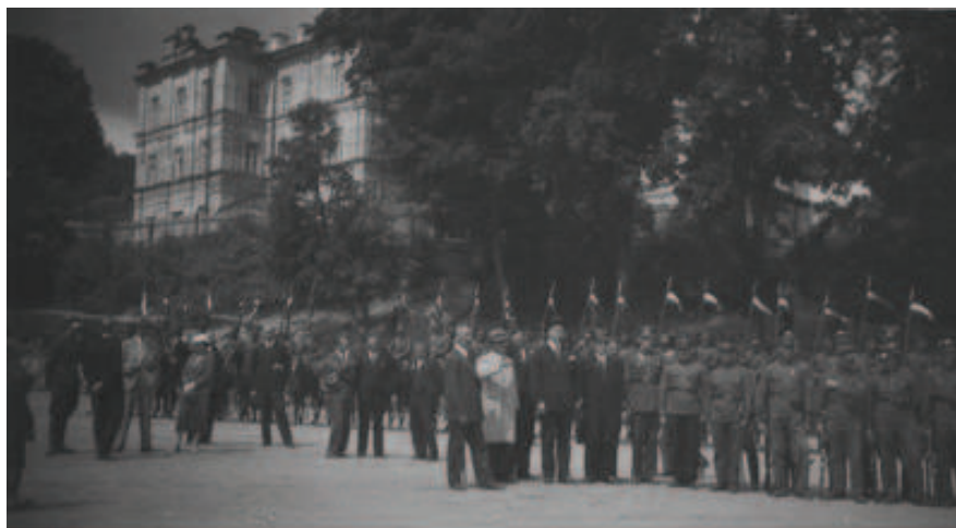
Fot. 2. Uroczystość Związku Strzeleckiego w Krzemieńcu – 6 sierpnia 1933 r.