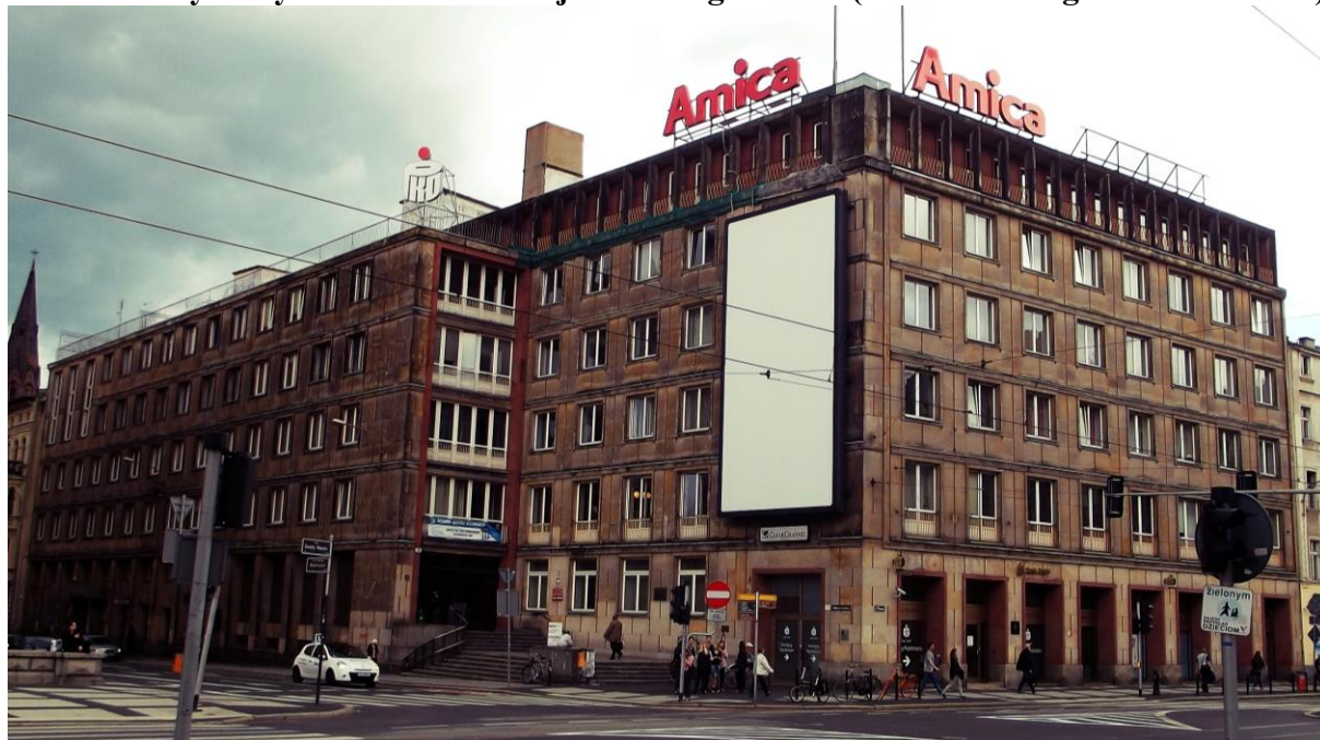
Fot.9. Dawny budynek Komitetu Wojewódzkiego PZPR (obecnie Collegium Historicum)