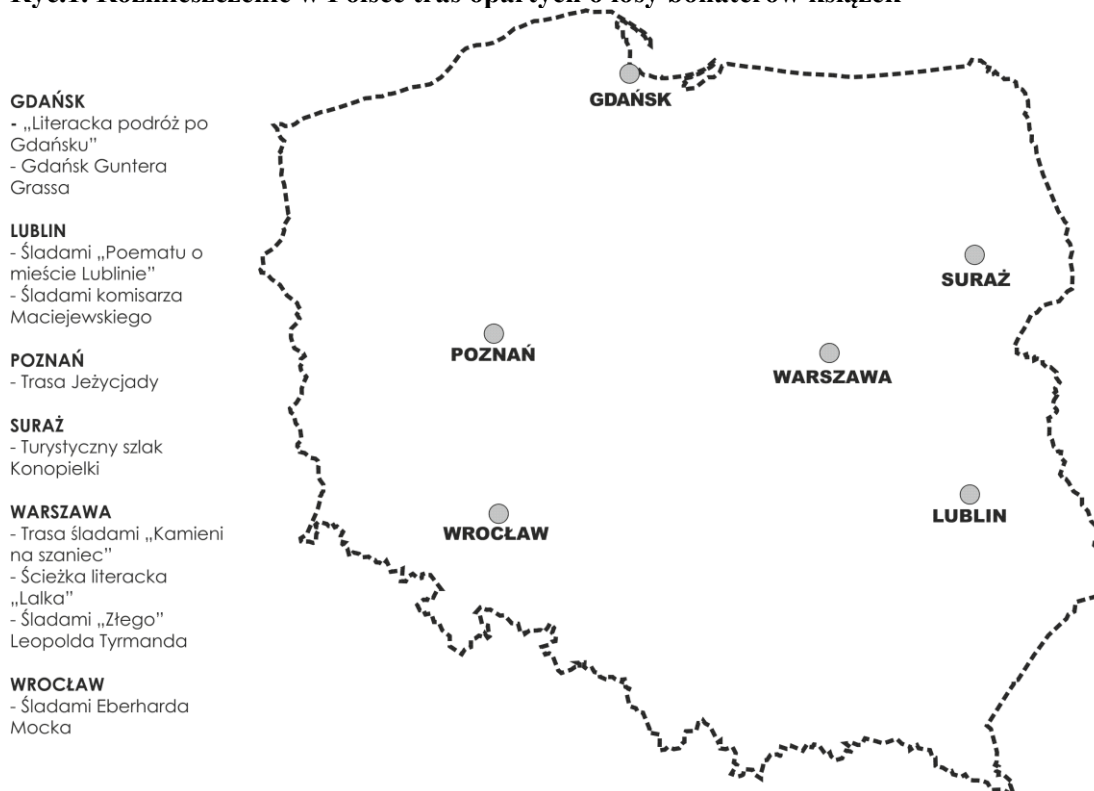
Ryc.1. Rozmieszczenie w Polsce tras opartych o losy bohaterów książek

W Polsce jest niewiele tras opartych o losy bohaterów literackich. Dłuższą tradycję wśród naszych rodaków ma podróżowanie śladami autorów książek, co wskazuje na to ilość oraz popularność tego typu tras. Jednak jest kilka miast, w których szlaki oparte na książkowych wydarzeniach zyskały powodzenie i na podstawie znalezionych informacji, zostaną one zaprezentowane. Rozmieszczenie wspomnianych miast oraz znajdujących się w nich szlaków przedstawia Ryc. 1.